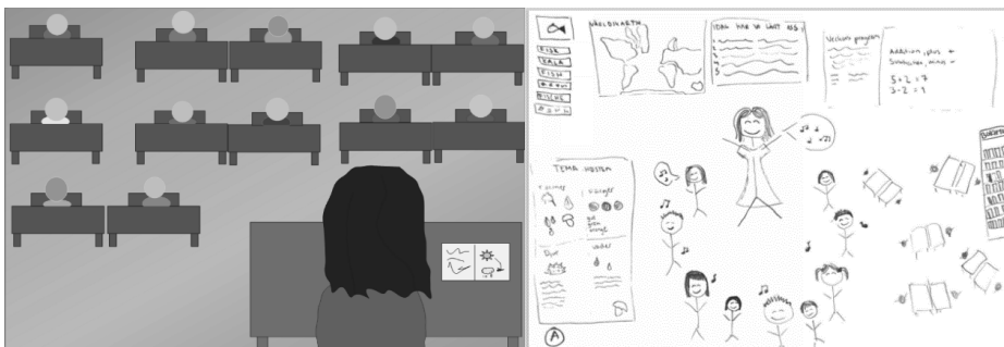
FIGUR 1. Exemplicering av lärarstuderandes (ÅA11 och ÅA24) visualiseringar av svenskans synlighet som kategori A

visualiseringarna identifieras lärmiljöer där svenska (eller något annat språk) inte alls synliggörs. Den här kontrasten presenteras i kategori A som vi benämner icke-visualiserad vs. visualiserad svenska vilket illustreras i figur 1. Till vänster i figuren synliggörs svenskans frånvaro och till höger närvaro.