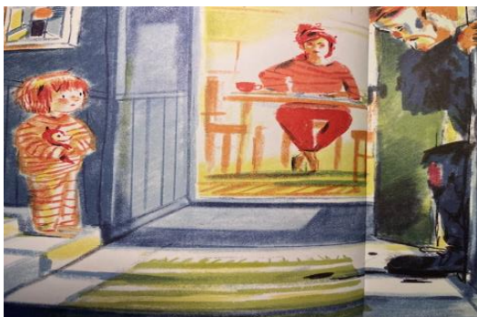
Kuva 6. Isä tulee kotiin yksisarvisjahdista (Karsikas, 2022, s. 4-5).

Kolmannen aukeaman peittää kokonaan kuva, jossa astiat lentelevät ilmassa ja äiti sekä siniharmaa hyökkäävä eläinhahmo ärjyvät itseään käsillä suojelevalle isälle (kuva 7). Liike sekä värimaailma ovat voimakkaita, joka ilmenee