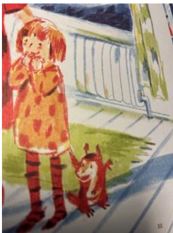
Kuva 13. Isän kiukku