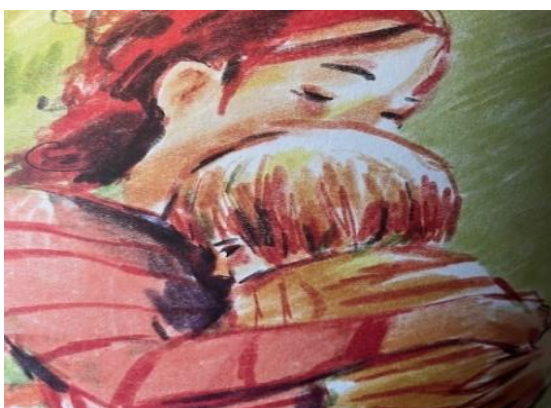
Kuva 8. Myrsky on laantunut (Karsikas, 2022, s. 8).

Yksisarvinen seuraa perheen elämää lähes jokaisella kirjan aukeamalla. Moa päättää toimia ja päästä eroon kaikesta, mikä muistuttaa yksisarvisesta. Isän