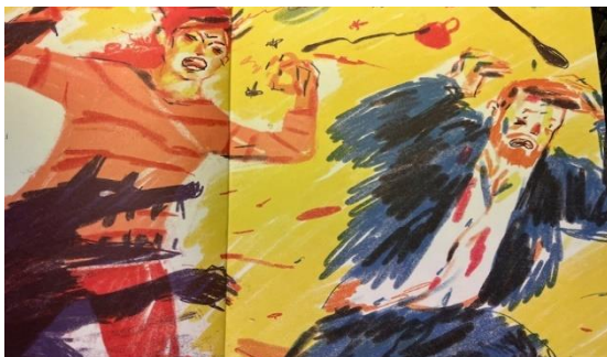
Kuva 7. Myrsky (Karsikas, 2022, s. 6-7).

Seuraavalla aukeamalla lapsen kokemus näkyy sekä tekstissä, että kuvassa (kuva 8). Liike on pysähtynyt, väritys maanläheinen ja tilanne on seesteinen. Moa on äidin sylissä ja itkee. Äiti lohduttaa Moaa ja pyytää anteeksi huutamistaan harmitellen isän ajattelemattomuutta yksisarvisen jahtaamisessa. Teksti kertoo myös Moan tunteesta. ”Ja sinustakin tulee pelottava.”