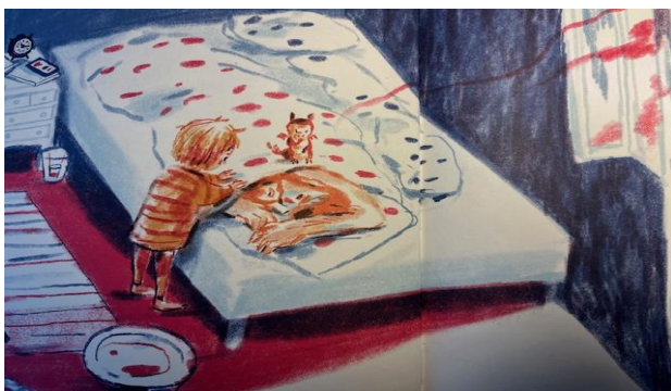
Kuva 11. Aamulla, metsästyksen jälkeen (Karsikas, 2022, s. 38-39).

Seuraavalla aukeamalla kerrotaan aamusta, jolloin Moa menee herättämään kuorsaavan isän. ”Isä lojui syvällä peiton alla. Hän haisi pahalta – koko huone löyhkäsi yksisarviselta.” Isä saa kuulla olevansa valehtelija eikä mikään metsästäjä. Moa on nähnyt miten isä juo eliksiiriä ja riehuu barbaarien kanssa ja pyytää isää lopettamaan (kuva 11). Punainen väri sivun kuvituksessa viittaa yksisarviseen ja sen jättämiin jälkiin.