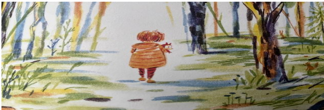
Kuva 12. Metsässä (Karsikas, 2022, s. 11).

Moan mielestä yksisarvinen tuo kotiin syksyn makean tuoksun ja kun isä tulee kotiin, se kuulostaa ikävältä kolinalta. Isän tullessa kotiin hän näyttää hurjalta resuisissa vaatteissaan ja rähjäisessä olomuodossaan. Moa pelkää, on surullinen ja hämillään vanhempien riidoista sekä isän käyttäytymisestä.