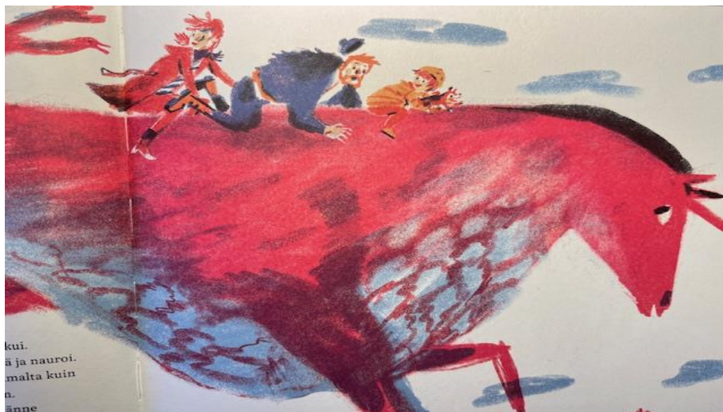
Kuva 15. Yksisarvinen on kesytetty

mikä sinä oikeasti olet! Yksisarvinen pysähtyi ja katseli isää ja äitiä. Sitten se asteli hitaasti lähemmäs ja laskeutui makaamaan heidän eteensä.”