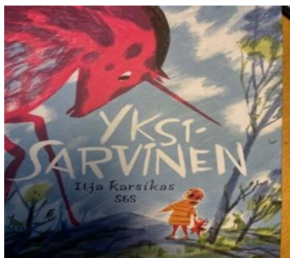
Kuva 1. Etukansi (Karsikas, 2022)