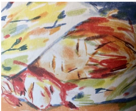
Kuva 5. Aamu, jolloin isä saapuu kotiin yksisarvisjahdista (Karsikas, 2022, s. 2)

Yksisarvinen -lasten kuvakirjan toisella kertovalla sivulla lapsi seisoo vasemmalla sivulla portaissa pehmolelu tiukassa otteessa hänen sylissään. Kuvassa äiti on sijoitettu keskelle aukeamaa keittiön pöydän äärelle istumaan ja vasemmalla yhdelle kolmasosalle oikeasta sivusta on sijoitettu rähjäisen näköinen isä astumassa ovesta sisään (kuva 6.). Teksti kertoo olevan lauantaiaamu ja isä on saapunut kotiin lähdettyään edellisenä iltana jahtaamaan yksisarvista. Teksti kertoo ajankohdasta, isän ulkonäöstä sekä hänen huvittuneesta suhtautumisestaan tilanteeseen.