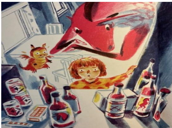
Kuva 9. Salaiset eliksiirit (Karsikas, 2022, s.26)

Moan kaadettua isän eliksiirit viemäriin, isä suuttuu. Kun isä lähtee kiukuisena yön pimeyteen, Moa lähtee seuraamaan isää. Moa näkee Bar Baarin ikkunan läpi, mitä yksisarvisen jahti tarkoittaa. Teksti kertoo Yksisarvisen käyskentelystä juhlijoiden keskellä hehkuvan kirkkaana kiihdyttäen juhlijajoukon suureen laukkaa, kadoten välillä näkymättömiin kuin aave. ”Yhtäkkiä yksisarvinen alkoi juosta ympäri ravintolasalia ja kiihdytti koko joukon suureen laukkaan. Isä tarttui Yksisarvista hännästä ja yritti roikkua sen mukana, kaataen tuolit ja pöydät mennessään.” Kuva kertoo juhlijoiden ulkomuodoista, jotka sekä ihmisiä, että eläimiä. Kuvassa isä tanssii pöydällä valkoisen antropomorfisen eläinhahmon kanssa ja punaista eliksiiriä roiskuu ympäriinsä (kuva 10). Meno näyttää