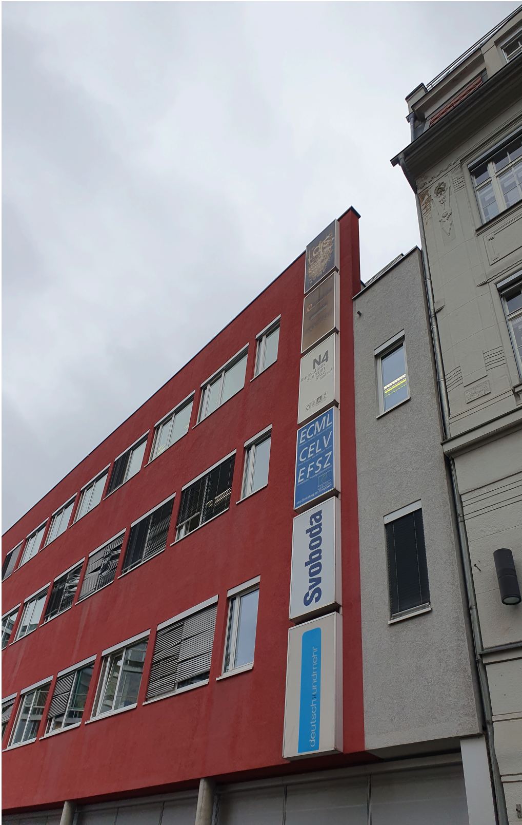
Kuva 1. Euroopan nykykielten keskus ECML sijaitsee Grazissa, Itävallassa.

tukea jäsenvaltioita kielikoulutuspolitiikan kysymyksissä. (ECML, n.d.) Keskuksen toimisto sijaitsee Itävallan toiseksi suurimmassa kaupungissa Grazissa, mutta toimintaa on ympäri Euroopan.