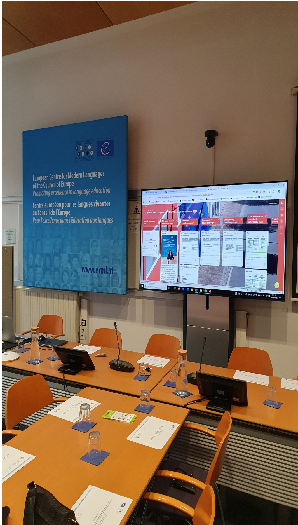
Kuva 3. Työpaja järjestettiin Euroopan nykykielten keskuksessa Itävallassa.