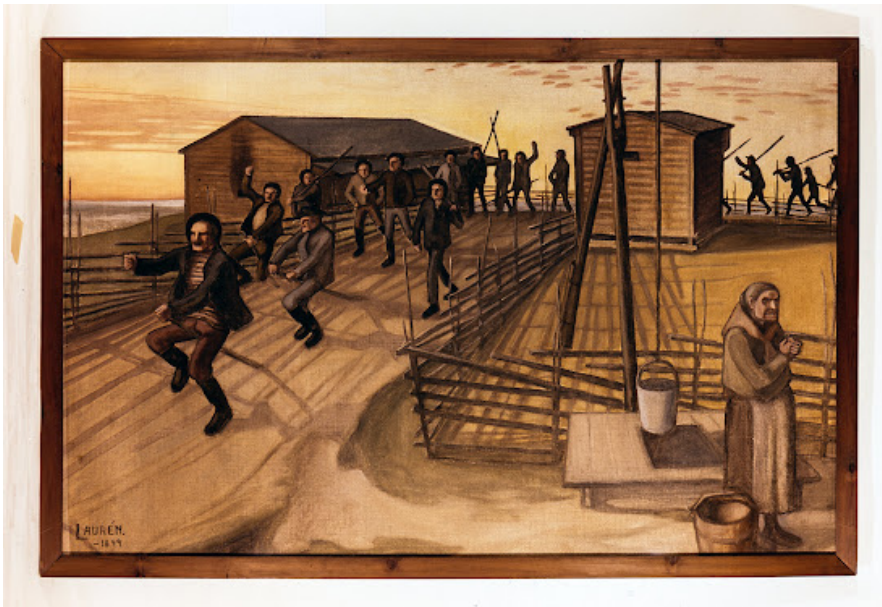
Per Åke Lauren, Lähtö kylätappeluun (1899), Museovirasto.

Puukkojunkkari-ilmiön kokonaisvaltaista tutkimista on hankaloittanut ilmiön pitkä kesto ja siitä syntyneen lähdeaineiston laajuus. Maakunnan henkirikollisuuden tiedetään kasvaneen 1790-luvulta alkaen, ja satunnaisista vaihteluista huolimatta henkirikollisuuden taso pysyi korkeana aina 1880-luvun lopulle. Aiemmat tutkijat, Ylikangas mukaan lukien, ovat yrittäneet lohkoa ja selittää ilmiötä etenkin tilastojen avulla. Tutkijoiden yleisimmin laatimat tilastot koskevat henkirikosten ajallisten ja paikallisten muutosten vertailua. Ylikangas on lisäksi tilastoinut ja vertailut muun muassa henkirikoksissa käytettyjä surma-aseita, surmaamistapoja, vuodenaikojä ja henkirikoksia tehneiden miesten sosiaalisia asemia ajanjaksolla 1790–1825.