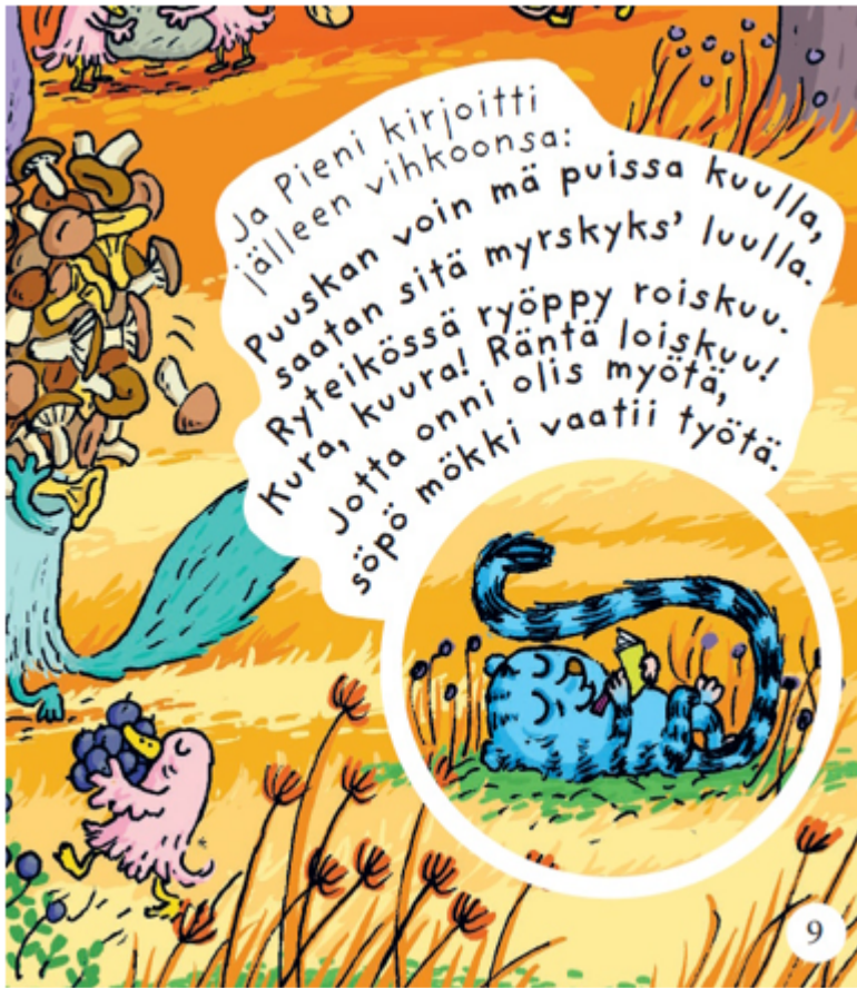
Kuva 2. Pienen riimittelemässä lorussa esiintyy paljon suomen kielen minimipareja, kuten kuulla - luulla , kura - kuura , roiskuu - loiskuu ja myötä - työtä .

Kirjan jokaisella sivulla keskitytään tiettyyn äänteeseen tai äänteisiin. Esimerkiksi vokaaleihin /y/ ja /ø/ keskittyvällä sivulla tarinassa ja kuvituksessa vilisee sanoja kuten pöllö , höyhen , köysi , hölmö , lötkö , söpö ja mökki . Useimmat sanat ovat merkitykseltään yksinkertaisia, jotta ne aukeavat hyvin pienille lapsille ja suomea oppiville. Sanojen merkitysten oppimista tukevat myös lastenkirjaan lisämateriaalina kuuluvat kuvakortit. Sanat ja minimiparit esiintyvät kirjassa sekä itse tarinassa että kuvituksessa, jolloin lapset voivat myös itse tai opettajan ohjaamina etsiä aukeamilta uusia sanoja kielitaidon kehittyessä. Samalla he pääsevät harjoittelemaan äänteiden tunnistusta ja tuottamista satuhetken lomassa kuin huomaamatta. Kirja sopii erinomaisesti myös perheiden omaan käyttöön, esimerkiksi iltasaduksi.