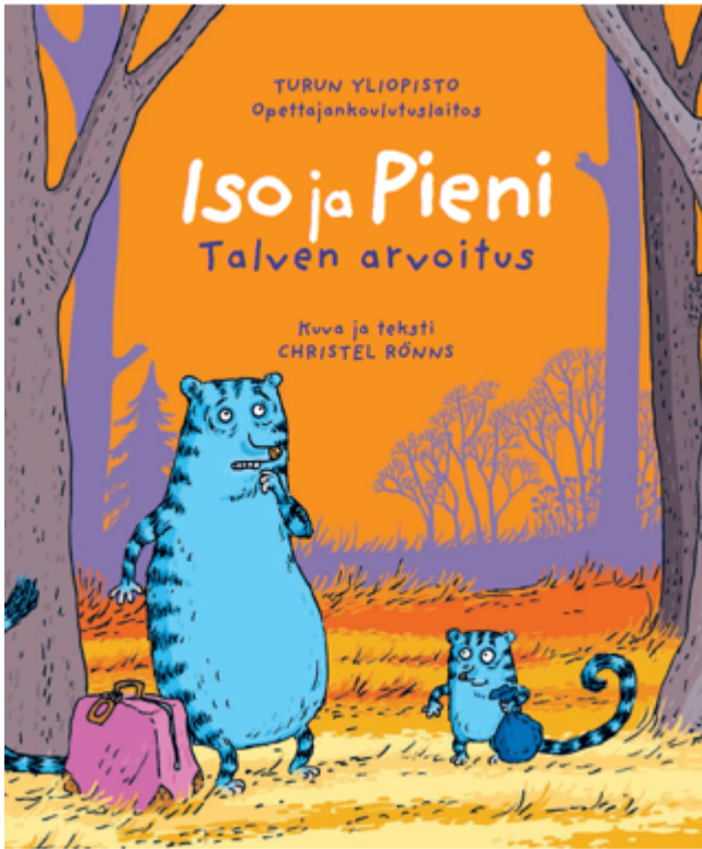
Kuva 4. Kirjan kansi

Iso ja Pieni – talven arvoitus -kirjan materiaalit: