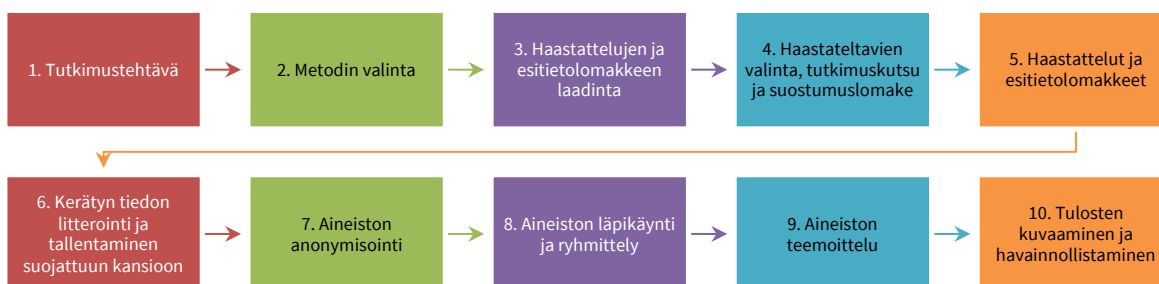
Kuvio 2. Tutkimuksen toteutuksen vaiheet.

Vaiheessa 9 aineisto teemoiteltiin sen mukaan, miten se kertoo haastateltavien kokemuksista terveydentilasta, työ- ja toimintakyvystä, taloudellisesta tilanteesta, saaduista palveluista ja etuuksista ja siitä,