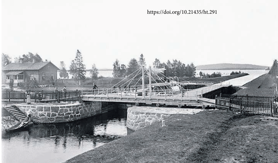
Nerkoon kanava. Näkymä Onkivedelle Väisälänmäen suuntaan. Valokuvaaja: Viktor Barsokevitsch, 1895. Kuopion kulttuurihistoriallinen museo. CC BY 4.0.

ehti vesitse samana syksynä Pietariin. Pohjanmaalle voita vietiin pääosin talvisin, mikä heikensi voin laatua ja alensi sitä kautta hintaa. Vuosisadan alkupuolella Viipurin läänin kauppiaat ja parisniekat (kulkukauppiaat) välittivät itäsuomalaisia talonpoikaistuotteita Pietariin. Kuopion läänistä tiedetään viedyn runsaasti voita ainakin 1820-luvulta lähtien. Ville-Pekka Kääriäisen luku tässä teoksessa osoittaa, että voi oli merkittävä vientiartikkeli Ylä-Savossa itse asiassa jo 1600-luvulta lähtien. Helsingfors Morgonbladissa kirjoitettiin vuonna 1842, että Iisalmessa voikauppa oli vahvasti painottunut Pietarin suuntaan. Iisalmen pitäjistä tiedetään 1840-luvun lopulla viedyn voita vuosittain noin 10 000 leiviskää, kun koko Kuopion läänin vuotuinen voinvienti oli 40 000–60 000 leiviskää. 996