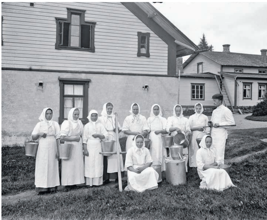
Peltosalmen karjanhoitokoulun oppilaita.