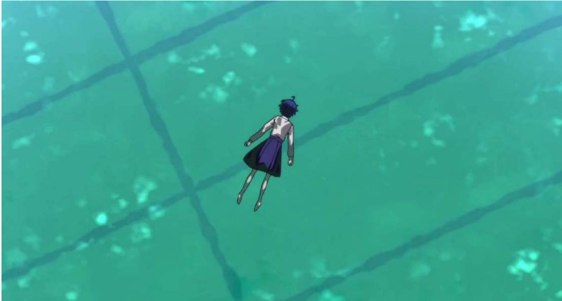
Kuva 26: Hukkunut Toinen Ai. (Wonder Egg Priority 2021, jakso 12, 00:07:43)

Toisen Ain itsemurhan motiivi on vahingollinen minäkuva. Aihin verrattuna Toinen Ai on hiljainen ja epävarma itsestään. Hän ei katso Aita usein silmiin, hänen kasvonsa ovat surullisen näköiset ja hänen olemuksensa on ylipäänsä mitäänsanomaton. Tämä kertoo Toisen Ain huonosta itsetunnosta ja epävarmuudesta. Lisäksi Toinen Ai on pukeutunut siniseen koulupukuun, joka kohtauksessa kuvaa hänen melankolisuuuttaan ja synkkää mielenmaisemaansa. Hänen vierellään keltaiseen huppariin pukeutunut Ai on kohtauksen selkeä väripilkku, joka vaikuttaa Toiseen Aihin verrattuna itsevarmalta. Toinen Ai vaikuttaa myös siltä kuin hän ei haluaisi muiden näkevän itseään ja yrittäisi siksi olla mahdollisimman huomaamaton. (ks. Kuva 27.) Jopa hänen äänensä on hento ja hiljainen, kun hän puhuu Ain kanssa. Toinen Ai muistuttaa paljon Aita ajalta, jolloin tämä vasta tutustui Koitoon. Toinen Ai on myös selkeästi hieman kateellinen Aille, koska tällä on ystäviä ja hänellä ei. Hänen kasvonsa ovat apeat, kun hän kysyy Ailta tämän ystäväistä, eikä hän vaikuta kykenevän iloitsemaan Ain puolesta. Toinen Ai ei sanallisesti vähättele itseään, mutta vertaa elämäänsä jatkuvasti Aihin ja tämän elämään ystävien kanssa: "Ymmärrän, sinä sait siis ystävän.", "On varmasti ihanaa, että hän on sinulle niin tärkeä." (Wonder Egg Priority 2021, jakso 12, 00:05:48; 00:08:14.) Toisessa Aissa on paljon samanlaisia piirteitä kuin Minamissa, joka ei myöskään usko itseensä ja kokee itsensä huonoksi.