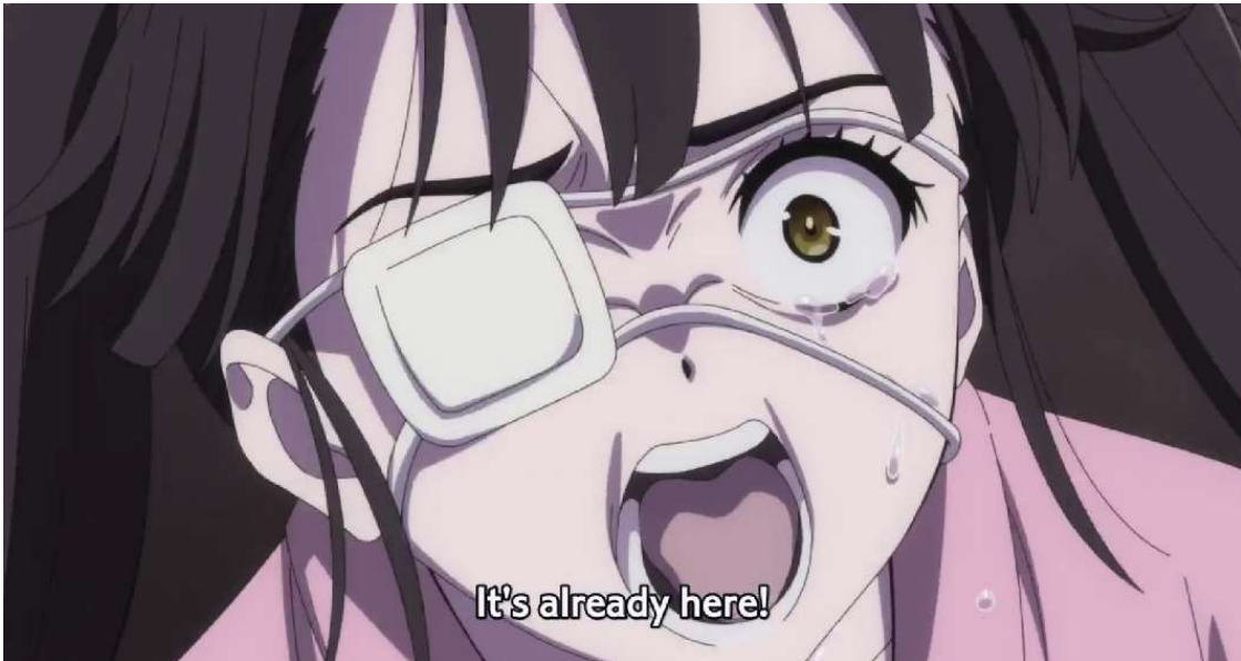
Kuva 31: Kauhistunut Yae (Wonder Egg Priority 2021, jakso 6, 00:10:40).

En kykene toteamaan onko häpeä osa Yaen itsemurhaa vai ei. Yae ei arvostele itseään omista kyvyistään tai itsemurhastaan, ei edes silloin kun Ai kyseenalaistaa ne. Hän vain närkästyttää ja sanoo, että kukaan ei uskonut häntä tosimaailmassa. Yae ei näe siis omaa kykyään ongelmana, joka pitäisi hoitaa. Hän näkee ongelmana muiden ihmisten asenteen häntä kohtaan. Lisäksi kukaan toinen henkilöahmo ei kommentoi Yaea eikä tämän kykyjä tai kokemuksia tosimaailmassa. Toisaalta, koska Yae on erilainen, ja hänet oli eristetty muusta yhteiskunnasta kykynsä takia, hän on saattanut kokea häpeää tosimaailmassa. Yae ei kerro elämästään tarpeeksi, jotta häpeän tunnetta voitaisiin tutkia, joten en kykene tutkimusaineiston rajoissa päättämään häpeän suhdetta Yaen itsemurhaan.