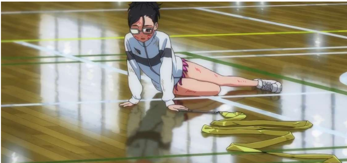
Kuva 36: "Kaikki on minun syytäni." (Wonder Egg Priority 2021, jakso 2, 00:13:37)