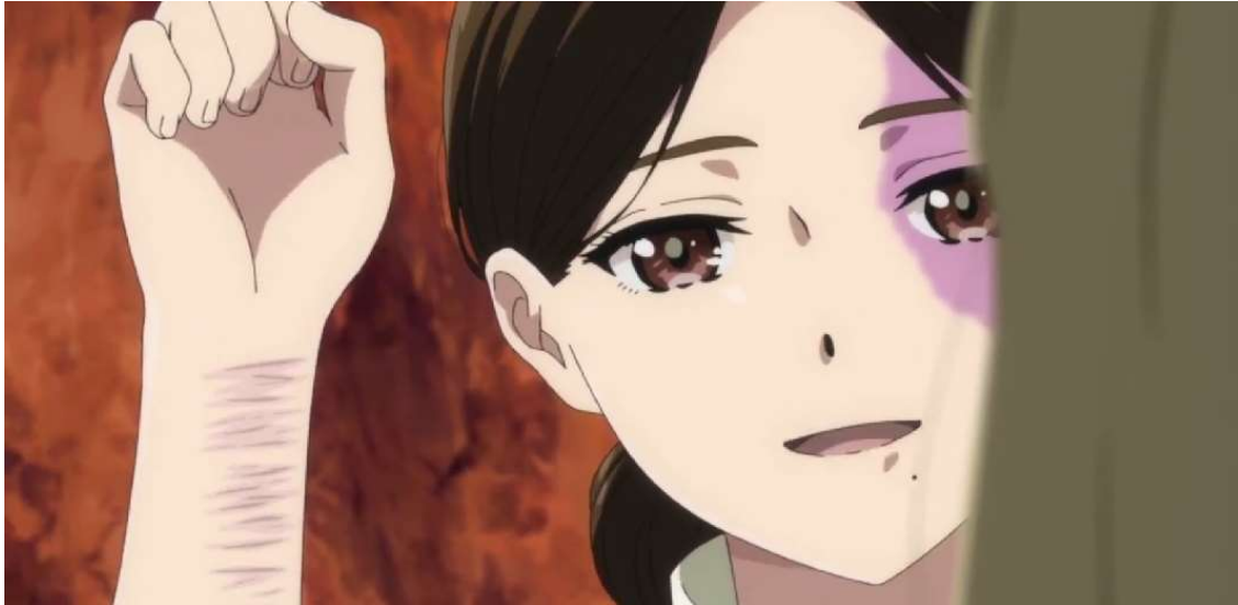
Kuva 20: Kulttihuijaus-tyttö näyttää viiltelyjälkensä Rikalle ( Wonder Egg Priority 2021, jakso 7, 00:14:46).

Tyttö ei usko Rikaa, kun tämä väittää hänen kuolleen typerällä tavalla. Tyttö puolustaa kulttijohtajaa ja hyökkää henkisesti Rikaa vastaan. Ennen kuin hän näyttää viiltelyjälkensä Rikalle, tyttö tajuaa, että Rika viiltelee myös itseään. Tyttö näkee Rikan kärsivän avuttomuudesta itsensä tavoin ja alkaa kyseenalaistamaan Rikan syytä elää: "Poista itsesi elämästä. Siten kaikesta tulee paljon helpompaa" ( Wonder Egg Priority 2021, jakso 7, 00:14:40) Kulttihuijaus-tyttö yrittää houkutella Rikan kuolemaan, jotta tämäkin voisi pelastua ja liittyä kosmokseen. Kulttihuijaus-tyttö yrittää saada Rikan luovuttamaan myös siksi, ettei tämä enää yrittäisi satuttaa hänen traumansa.