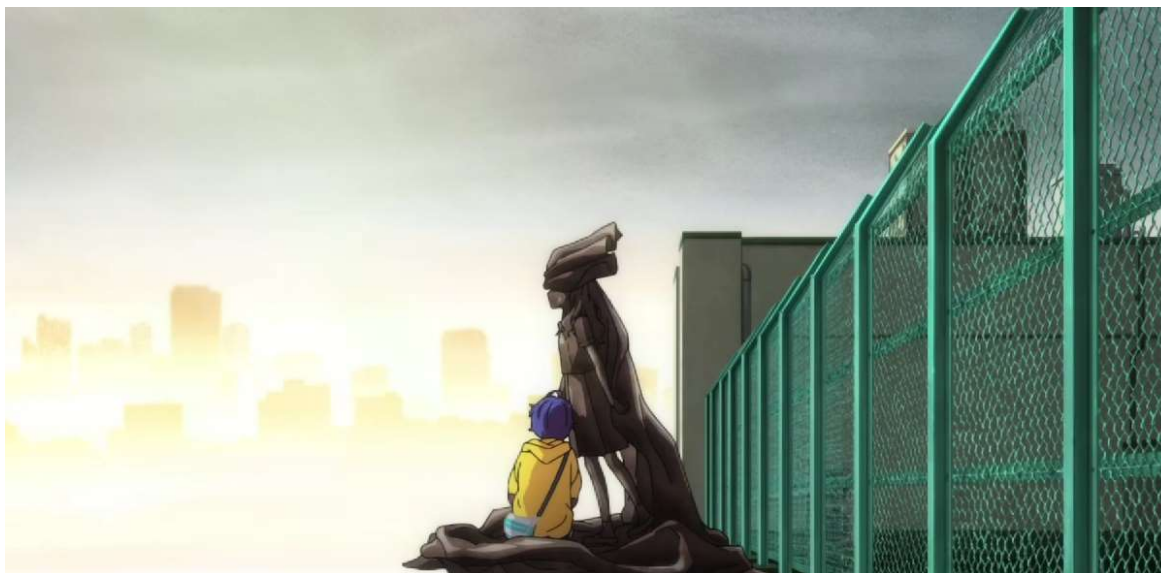
Kuva 12: Ai ja Koiton patsas. ( Wonder Egg Priority 2021, jakso 1, 00:16:25)

Patsas katselee katon reunalta edessä avautuvaa maisemaa ja näyttää siltä kuin olisi hyppäämässä katolta alas. Kun Ai löytää patsaan ensimmäisen kerran, hän istuu sen viereen ja nojaa päänsä sitä vasten. Kohtaus on erittäin surumielinen ja siinä jatkuu sama musiikki kuin Koiton itsemurhan aikana. (Ks. kuva 12.) Patsas edustaa tekotapaa, jolla Koito on tappanut itsensä. Tekotapaa alleviivataan myös sarjan viimeisessä jaksossa, kun opettaja Sawaki kertoo Aille enemmän Koiton itsemurhasta, ja kuinka tämä hyppäsi alas koulun katolta ( Wonder Egg Priority 2021, jakso 13, 00:28:44).