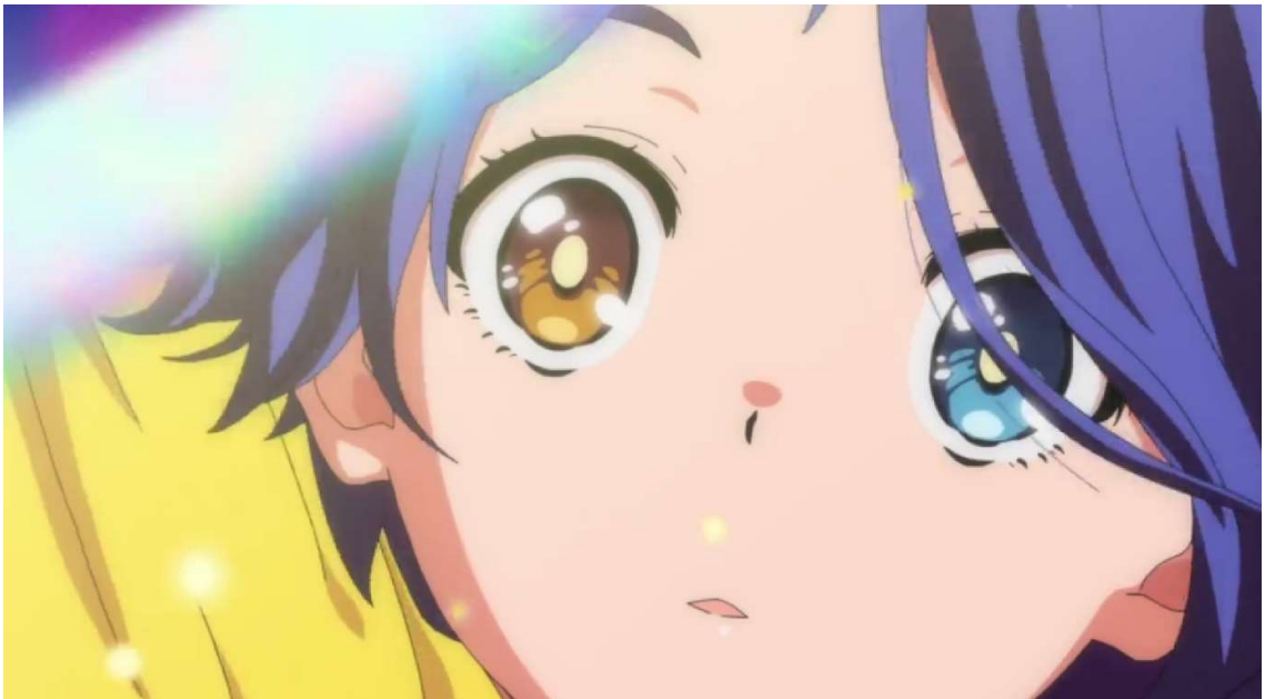
Kuva 4: Ain silmät ( Wonder Egg Priority 2021, jakso 1, 00:18:10)

Seuraavassa luvussa käsittelen merkittävimpiä itsemurhateorioita, niiden taustoja sekä sitä, millaisena itsemurha nähdään japanilaisessa viitekehyksessä. Kerron myös aasialaisten uskomuksien kolmesta viisaasta apinasta ja perustelen, miksi ne ovat merkityksellisiä tutkimukseni kannalta. Kolmannessa luvussa kerron animen analysoinnin metodologiasta, ja miten olen lähtenyt analysoimaan aineistoani. Neljännessä luvussa analysoin ensin tyttöhahmojen itsemurhien motiiveja, tekotapoja ja