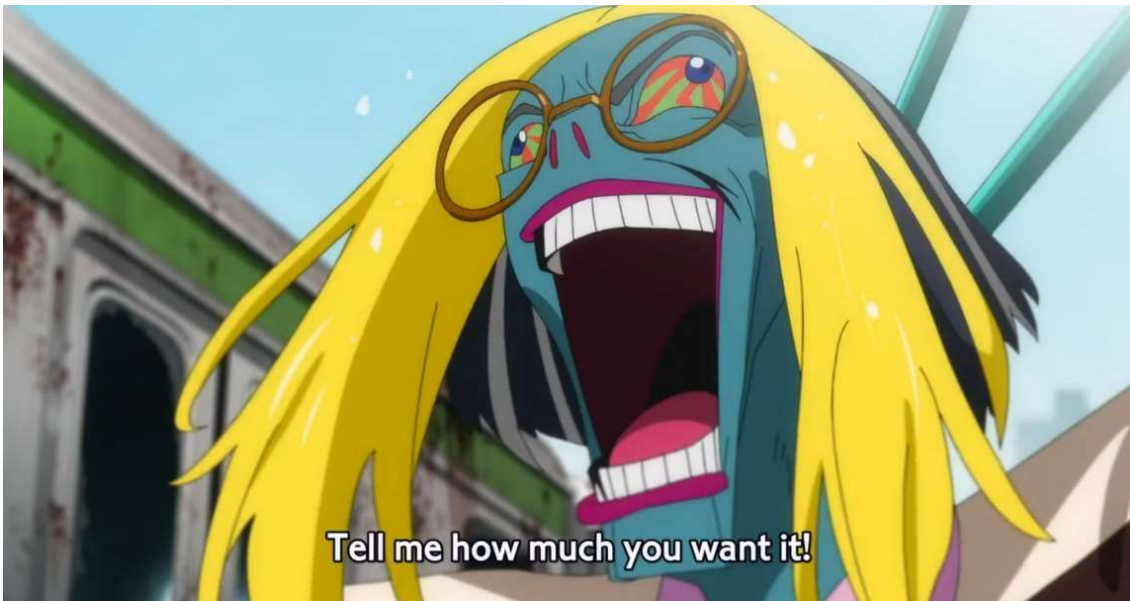
Kuva 28: Trauma syyttää Miwaa hyväksikäytöstä ( Wonder Egg Priority 2021, jakso 4, 00:04:50).

Miwan itsemurhan taustalla vaikuttavat selkeästi vahingoittuneet ihmissuhteet. Miwan ja hyväksikäyttäjän suhde on erittäin vahingoittunut, mutta se ei kuitenkaan ole ainoa syy itsemurhalle. Äidin inho Miwan tekoa kohtaan ja Miwan syyllistäminen ovat myös vahingollisia tekoja, jotka ovat johtaneet Miwan itsemurhaan. Miwalle ei ole ollut turvallista aikuista, joka auttaisi häntä käsittelemään tapahtunutta, mikä näkyy sarjassa Miwan vahvana tukeutumisenä Momoen. Hyväksikäyttäjän syyllisyyttä Miwan itsemurhaan ei kuitenkaan pidä aliarvioida. Hyväksikäyttäjä esiintyy Miwan traumana unimaailmassa. Trauma syyllistää Miwaa tosimaailman tapahtumista ja sanoo Miwan itse halunneen koskettelua. Tämä on hyvin tyypillistä käyttäytymistä hyväksikäyttäjille, jotka pyrkivät siihen, että uhri ottaa tapahtuneesta syyt niskoilleen. Trauma huutaa valheellisia sanojaan Miwalle suurella suullaan. Samalla trauman suusta roiskuu sylkeä ja tämän silmät harottavat eri suuntiin. Traumalla on päässään myös silmälasit, joiden tarkoitus on inhimillistää tämä Miwan hyväksikäyttäjän näköiseksi. (Ks. kuva 28.)