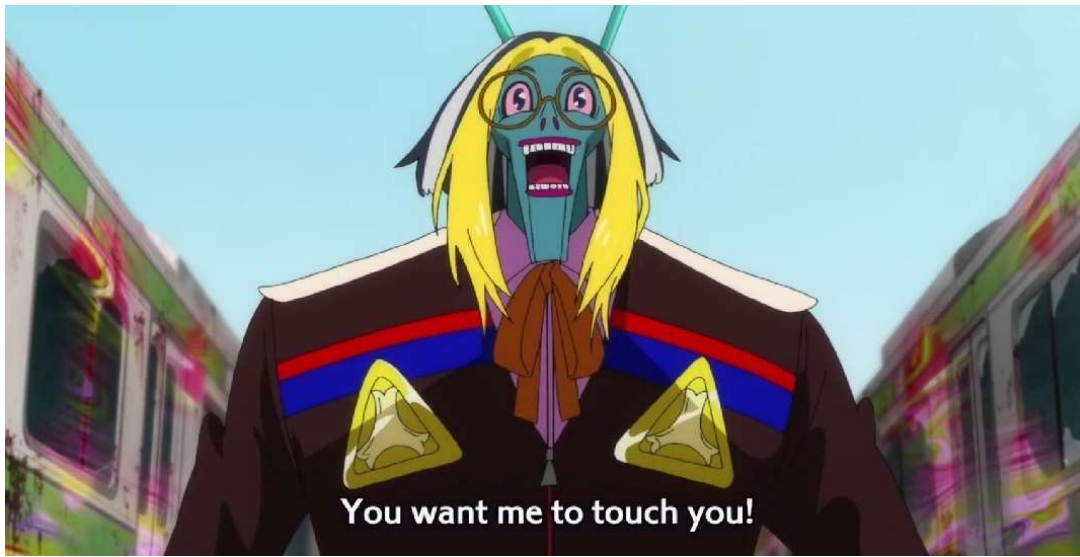
Kuva 39: "Haluat, että koskettelen sinua!" (Wonder Egg Priority 2021, jakso 4, 00:04:44)

taista kiiltoa. (Ks. kuva 39.) Miwa vaikuttaa ensin uskovan traumaa ja alistuvan trauman tahdolle, mutta hän tekee niin vain, jotta Momoella olisi mahdollisuus voittaa trauma. Koska Momoe on luonut luottamuksen Miwan kanssa ennen trauman kohtaamista, Miwa uskoo Momoeen. Momoe on kuunnellut Miwaa ja puhunut Miwan kokemuksista tämän kanssa, minkä vuoksi tämä uskoo siihen, ettei kaikki tosimaailmassa tapahtunut ollutkaan tämän syytä.