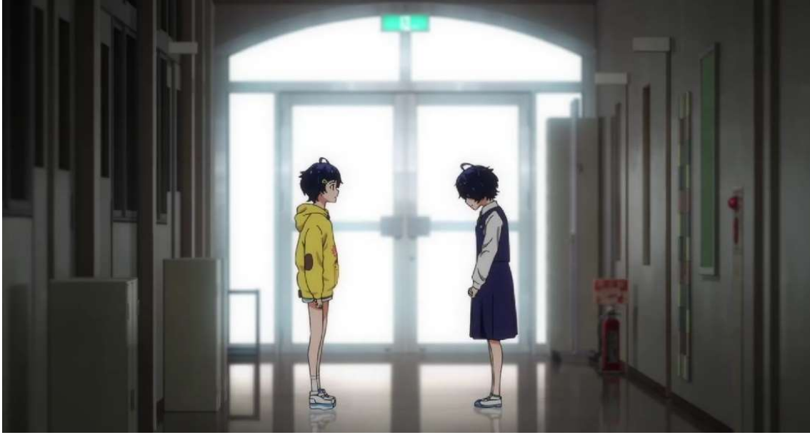
Kuva 27: Ai ja Toinen Ai. (Wonder Egg Priority 2021, jakso 12, 00:05:09)

Toisen Ain itsemurhan häpeä kietoutuu hänen traumansa ympärille. Toisen Ain trauma on opettaja Sawaki, johon Toinen Ai on ihastunut. Trauman sanoista voidaan päätellä, että vielä eläessään Toinen Ai pyysi opettajaa seurustelemaan hänen kanssaan. Dialogista selviää kuitenkin myös, että opettaja Sawaki on Toisen Ain äidin kihlattu. Toinen Ai on tuntenut häpeää, kun hän on saanut tietää, että opettaja pitää hänen äidistään eikä hänestä. Tämän lisäksi Toinen Ai on ollut erittäin epävarma itsestään ja tuntenut häpeää silmistään, joista häntä on kiusattu koulussa. Toisen Ain häpeä silmistä näkyy muun muassa siten, että hän yrittää peitellä sinistä silmänsä hiustensa taakse. Toinen Ai häpeää itseään ja tekojaan Ain unimaailmassa, mikä osoittaa, että häpeä on selkeästi osa hänen itsemurhaansa.