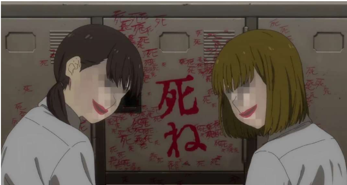
Kuva 33: Tytöt, joiden silmät on sumennettu (Wonder Egg Priority 2021, jakso 1, 00:04:37).

Seeno evil -hirviöiden lisäksi unimaailmassa on muitakin hahmoja, jotka noudattavat tosimaailman ajattelua ja normeja. Sarjan ensimmäisessä jaksossa Ai kohtaa unessaan tyttöjä, jotka kirjoittavat koulun lokerikkoon useita kertoja sanaa kuole (死ぬ). Tyttöjen silmät on sumennettu, mikä kuvastaa sitä, että tytöt eivät näe tekemäänsä pahaa tai mitä seurauksia heidän teoillaan on. Tytöt myös hymyilevät, kun he havaitsevat Ain tuijottavan heitä. Aivan kuten Seeno evil -hirviöt, tytöt piiloutuvat hymyn avulla pahojen tekojensa taakse ja yrittävät ikään kuin hakea hyväksynnän teolleen. (Ks kuva 33.)