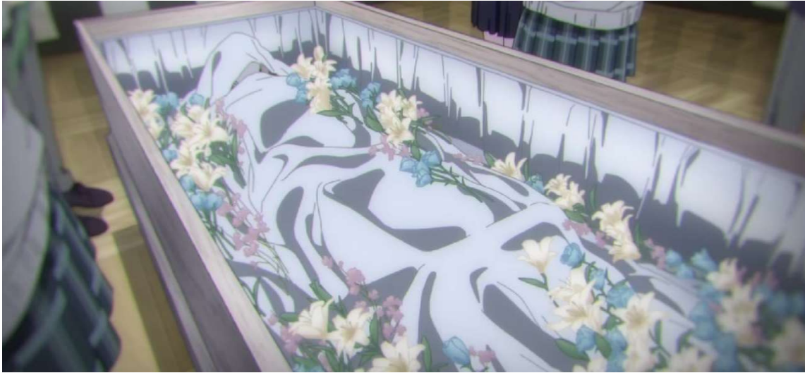
Kuva 25: Kuollut Chiemi. (Wonder Egg Priority 2021, jakso 3, 00:17:36)