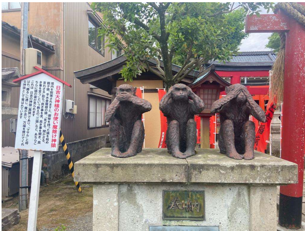
Kuva 8: Kolme viisasta apinaa japanilaisessa temppeleissä Komatsussa (Liu Shanshan 2023).

Kolme viisasta apinaa ja niiden kuvaamat ”älä näe pahaa”, ”älä kuule pahaa”, ”älä puhu pahaa” syntyivät Japanissa Muromachi-kaudella (1333–1573). Ne ovat kiinteästi yhteydessä japanilaiseen kansanuskoon nimeltään Koshin. (Japan information and culture center 2017.) Koshin on taustaltaan taoisminen uskonto, mutta siihen ovat vaikuttaneet muun muassa myös shinto ja buddhalaisuus. Koshinissa uskotaan, että ihmisen sisällä elää matoja, jotka aiheuttavat muun muassa ihmisen ikääntymisen ja sairastumisen. Kuutena päivänä vuodessa nämä madot kykenevät menemään taivaaseen kertomaan jumalille isäntänsä kunniattomista teoista, jolloin jumalat lyhentävät kyseisen ihmisen elinaikaa kolmellasadalla päivällä. Madot kuitenkin kykenevät menemään taivaaseen ainoastaan, jos ihmiset nukkuvat. Välttääkseen tämän Koshinin seuraajat viettävät nämä kuusi kriittistä päivää valvoen. (Eder 1970, 309.) Kolme viisasta apinaa eivät ole aina ole olleet osa Koshinia. Ne ovat todennäköisesti tulleet tunnetuiksi noin 1300–1400-luvuilla, kun vanhoissa Koshinilaisissa kääröissä mainittiin apinat. Tämän seurauksena kolme apinaa laitettiin kuvaamaan kolmea pahuudelta suojautumisen muotoa. (Three wise monkeys info 2022.) Nykypäivänä apinat ovat monelle tuttuja muun muassa emojien kautta: yksi apina on peittänyt käsillään silmät, yksi on peittänyt korvat ja yksi suun. Näissä asennoissa apinat ovat myös patsaina muun muassa japanilaisissa temppeleissä (ks. Kuva 8).