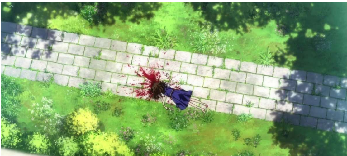
Kuva 11: Kuollut Koito. ( Wonder Egg Priority 2021, jakso 1, 00:12:21)

Patsas katselee katon reunalta edessä avautuvaa maisemaa ja näyttää siltä kuin olisi hyppäämässä katolta alas. Kun Ai löytää patsaan ensimmäisen kerran, hän istuu sen viereen ja nojaa päänsä sitä vasten. Kohtaus on erittäin surumielinen ja siinä jatkuu sama musiikki kuin Koiton itsemurhan aikana. (Ks. kuva 12.) Patsas edustaa tekotapaa, jolla Koito on tappanut itsensä. Tekotapaa alleviivataan myös sarjan viimeisessä jaksossa, kun opettaja Sawaki kertoo Aille enemmän Koiton itsemurhasta, ja kuinka tämä hyppäsi alas koulun katolta ( Wonder Egg Priority 2021, jakso 13, 00:28:44).