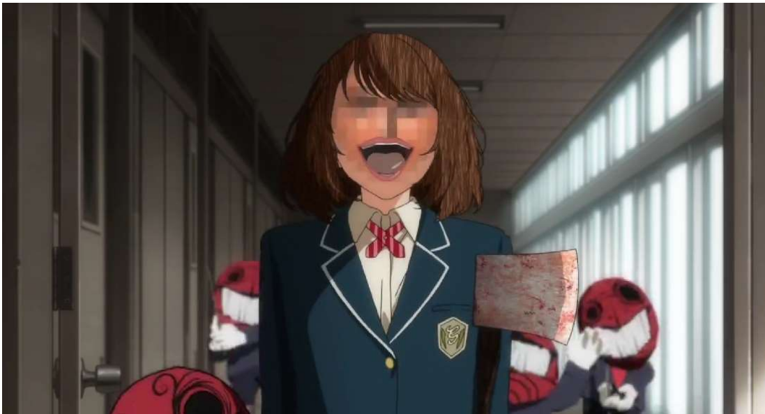
Kuva 34: Tyttö, joka nauraa. ( Wonder Egg Priority 2021, jaksos 1, 00:07:25)

Sumennetut silmät myös luovat ajatuksen siitä, että vaikka tytöt tekevät itse pahaa, heidän ei kuulu siltikään nähdä sitä. Tätä käsitystä vahvistaa kohtauksessa samaan aikaan kuuluva koulun kuulutus, jossa kuuluttaja sanoo: "Mitä teet, jos huomaat että jotakuta kiusataan luokallasi? Aivan oikein! Oikea vastaus on: Teeskentelet, että et näe!" ( Wonder Egg Priority 2021, jaksos 1, 00:04:45). "Teeskentelet, että et näe" - fraasi on suora viittaus Seeno evil -hirviöihin, jotka ilmestyvät paikalle myöhemmin jakson aikana. Tytöt, joiden silmät on sumennettu, eivät ainoastaan aiheuta pahaa henkisellä tasolla vaan myös fyysisellä. Tyttö, joka jahtaa Aita ja Kurumia koulun käytävillä unimaailmassa heittää kirveen Kurumia kohti ja viiltää haavan tämän käteen. Tyttö aiheuttaa Kurumille fyysistä kipua ja nauraa teolleen hysterisesti. Tämäkään ei näe omien tekojensa seurauksia, ja Seeno evil -hirviöt nauravat kuorona hänen kanssaan. (Ks. kuva 34.) Kohtauksen tunnelma on vähintäänkin häiritsevä, sillä tyttö ja Seeno evil -hirviöt kuvastavat ajatusta siitä, kuinka toisen satuttamisen pitäisi olla unimaailmassa oikeutettua. Lisäksi kohtauksen aikana taustalla alkaa soida hiljalleen huilujen ja vaskipuhaltimien kuoro, joka ikään kuin varoittaa Aita ja Kurumia lähestyvistä Seeno evil -hirviöiden hyökkäyksestä.