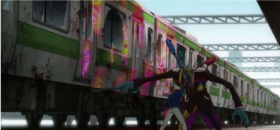
Kuva 14: Momoe taistelee unimaailmassa. ( Wonder Egg Priority 2021, jakso 4, 00:08:10).

nuissa on värikkäitä tahroja, joiden joukossa on myös selkeitä veritahroja. Tahrat tuovat miljööseen kuolemanläheistä tunnelmaa, mutta ovat samalla viittaus Japanissa oikeasti tapahtuviin junakuolemiin. (Ks. kuva 14.)