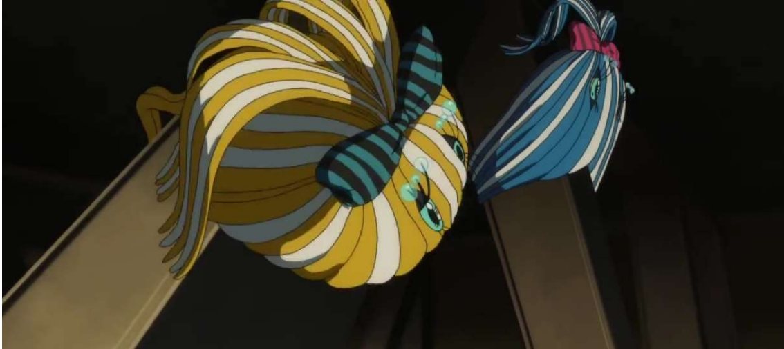
Kuva 18: Kaunishiuksisen tytön trauma (Wonder Egg Priority 2021, jakso 5, 00:19:06).

tiivi, joka romantisoi kaunishiuksisen tytön itsemurhan. Kauneuden ja nuoruuden vaaliminen on universaalisti nähty romanttisena hyveenä, eikä kaunishiuksinen tyttö näe muuta keinoa ylläpitää tätä hyvettä kuin kuoleman.