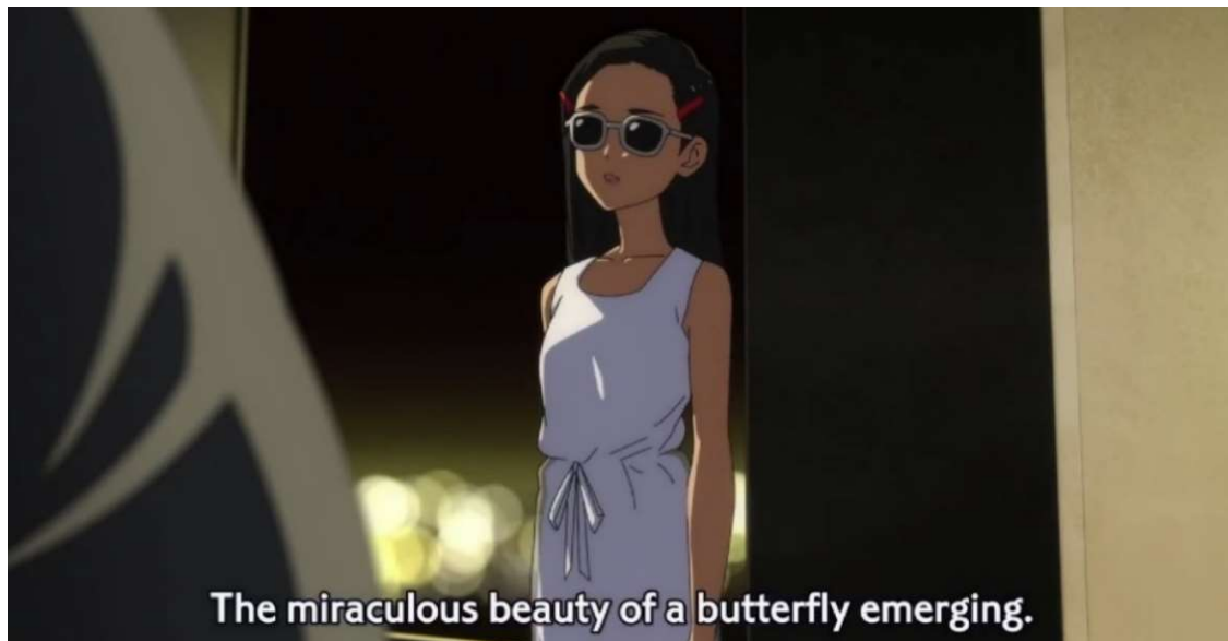
Kuva 17: "Tyttöt kasoavat aikuisiksi. Perhosen ihmeellinen kauneus nousee esiin. Se on ohitse liitävä hetki." (Wonder Egg Priority 2021, jakso 5, 00:10:54)