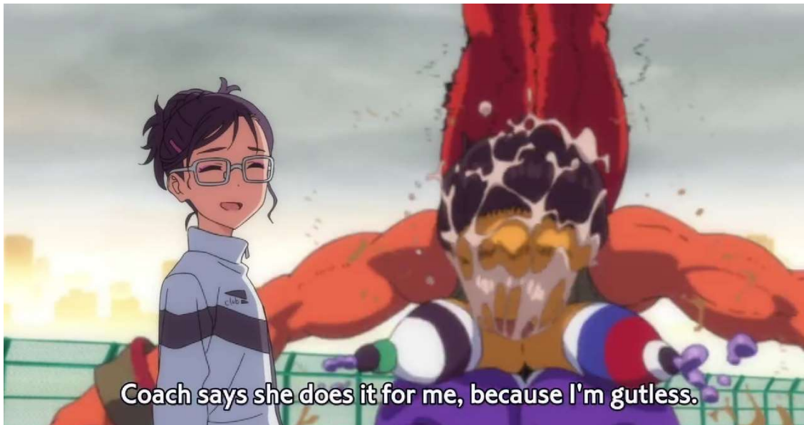
Kuva 22: "Opettaja tekee sen vuokseni, koska en ole tarpeeksi hyvä" ( Wonder Egg Priority 2021, jakso 2, 00:10:26)

Minamin heikentynyt minäkuva on selkeä motiivi hänen itsemurhalleen. Hän näkee itsensä jatkuvasti huonona, ja uskoo sen johtuvan hänestä itsestään. Trauma on Minamia kohtaan erittäin väkivaltainen, mutta silti Minami vähättelee itseään ja syyttää omaa huonouttaan: "Olet väärässä! Hän tekee sen, koska en ole tarpeeksi hyvä.", "Olen pahoillani opettaja! Yritän paremmin jatkossa!" ( Wonder Egg Priority 2021, jakso 2, 00:10:14; 00:10:21). Jopa erittäin väkivaltaisen teon hetkellä Minami kiittää traumaa, kun tämä lupaa lopettaa hänen elämänsä unimaailmassa mahdollisimman nopeasti ja kivuttomasti ( Wonder Egg Priority 2021, jakso 2, 00:13:08). Minami kokee, että ainoastaan trauma kykenee pelastamaan hänet hänen omalta huonoudeltaan ja tekemään hänestä paremman. Minami ei usko omiin kykyihinsä ja häpeää itseään, minkä vuoksi hän alistuu trauman väkivaltaisuuksille.