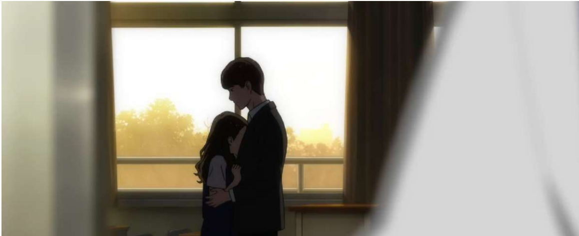
Kuva 13: Koito itkee. ( Wonder Egg Priority 2021, jakso 3, 00:12:05)

Koiton itsemurhan motiivina on estetty rakkaus ja hyväksynnän puute. Sarjan aikana selviää, että Koito on ihastunut opettaja Sawakiin ja yrittää saada tämän huomion erilaisilla tavoilla. Hän ei myönnä ihastustaan Aille eikä ihastus tule katsojalle heti ilmi. Kuitenkin sarjan edetessä erilaiset tapahtumat antavat vihjeitä Koiton ihastumisesta. Esimerkiksi Koiton ollessa vielä elossa hän ja Ai vierailevat opettaja Sawakin työhuoneessa. Opettaja haluaa ryhtyä taiteilijaksi ja on pyytänyt tyttöjä olemaan hänen malleinaan. Kohtauksessa on hiukan jännitteistä tunnelmaa varsinkin silloin, kun Ai näkee hymyilevän Koiton opettajan työhuoneen ikkunasta ( Wonder Egg Priority 2021, jakso 5, 00:08:58). Tilanne jännittyy entisestään, kun Ai on menossa tapaamaan opettaja Sawakia mutta löytääkin Koiton tämän seurasta. Koito itkee lohduttomana opettajan rintaa vasten, ja opettaja on laskenut kätensä tämän käsivarrelle. Kohtauksessa ei ole musiikkia, mikä tekee siitä jollakin tavalla pahaenteisen tuntuisen. (Ks. kuva 13.)