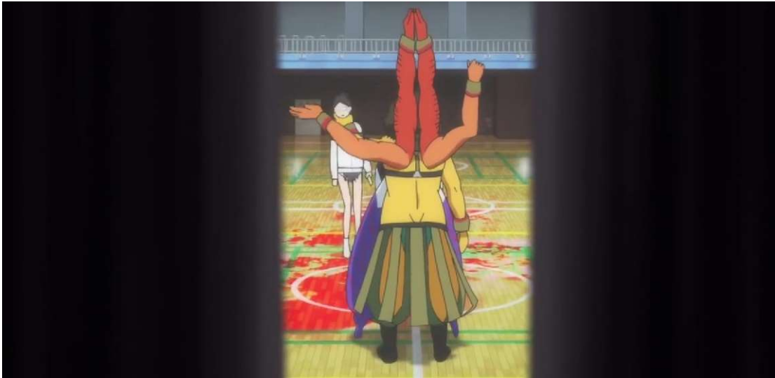
Kuva 35: Trauma lyö Minamia unimaailmassa. (Wonder Egg Priority 2021, jakso 2, 00:12:56)

tehtyä pahaa, ja saa Minamin uskomaan, että tosimaailmassa tapahtuneet asiat olivat tosiaan rakkautta. Minami alkaa myös vähättelemään itseään ja syyttää itseään pahasta, jota hän on kokenut tosimaailmassa. Maatessaan liikuntasalin lattialla Minami soimaa itseään ja katsoo lattiaan. Hän ei kykene katsomaan Aita silmiin, ja häpeää omaa heikkouttaan (ks. kuva 36). Vasta, kun Ai sanoo Minamille, että tämä vain haluaa jonkun löytävän tämän ja rakastavan tätä, Minami löytää tiensä ulos trauman otteesta. Hän katsoo Aita silmät toivosta säihkyen ja alkaa huomata, että hänellä olisi voinut olla toinenkin vaihtoehto ulos tuskasta kuin itsemurha (ks. kuvat 37 ja 38).