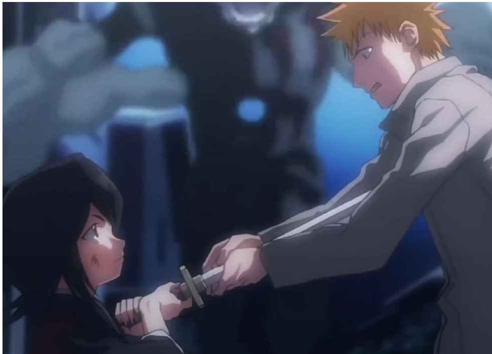
Kuva 7: Ichigo on valmis lävistämään itsensä Rukian miekalla ( Bleach 2004, jakso 1, 00:20:26).

Bleach -nimisessä sarjassa (2004–2012) poika nimeltä Ichigo haluaa pelastaa siskonsa pahalta aaveelta. Hänellä ei ole kuitenkaan tarvittavia voimia aaveen kukistamiseen, minkä vuoksi Rukia-niminen aaveenmetsästäjä auttaa häntä. Rukia haavoittuu pahasti ja pyytää Ichigoa ottamaan hänen voimansa. Ichigon täytyy lävistää itsensä Rukian samuraimiekalla saadakseen aaveenmetsästäjälle kuuluvat voimat (ks. Kuva 7).