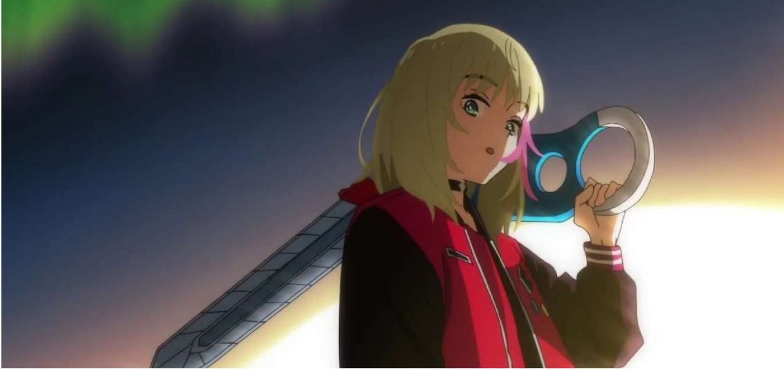
Kuva 1: Rika ja veitsi (Wonder Egg Priority 2021, jakso 3, 00:00:30).

kaammiksi ja nopeammiksi, jolloin he kykenevät muun muassa hyppäämään korkeista rakennuksista ilman vahingoittumista.