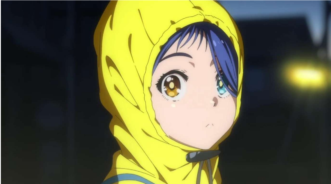
Kuva 3: Ai Ohto ( Wonder Egg Priority 2021, jakso 1, 00:00:29).