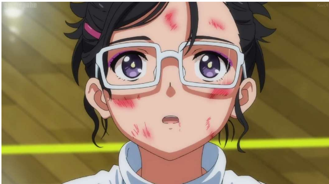
Kuva 38: Minami kuulee Ain sanat. (Wonder Egg Priority 2021, jakso 2, 00:13:52)

Miwan trauma toimii sarjassa Minamin trauman tavoin. Trauma maanittelee Miwaa ja uskottelee tälle, että tämä itse halusi tulla kosketelluksi ja miehen hyväilemäksi. Trauma laittaa kaiken vastuun tapahtuneesta Miwalle ja yrittää näin normalisoida hyväksikäytön rakkauden muodoksi. Trauma ei kuuntele Miwaa ja puhuu Miwasta jatkuvasti syyttävällä äänensävyllä. Trauma seisoo suorassa, mikä luo kuvan siitä, että tämä seisoo täysin valheellisten sanojensa takana. Lisäksi Miwan trauma näyttäisi jopa hieman hymyilevän puhuessaan ja tämän silmissä on ilon kal-