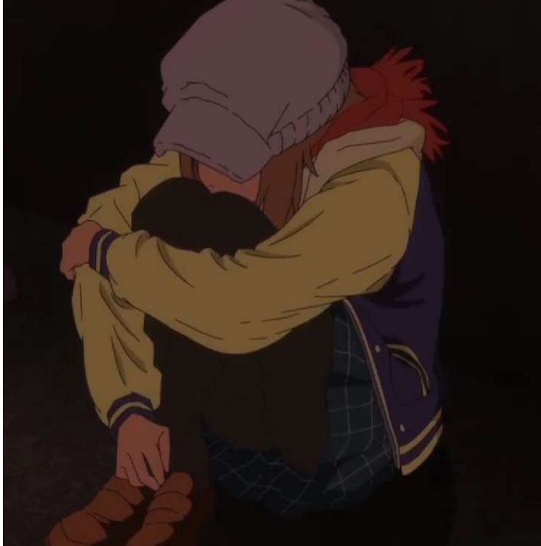
Kuva 10: Kotoa karannut tyttö suojelee itseään. (Wonder Egg Priority 2021, jakso 5, 00:01:20)