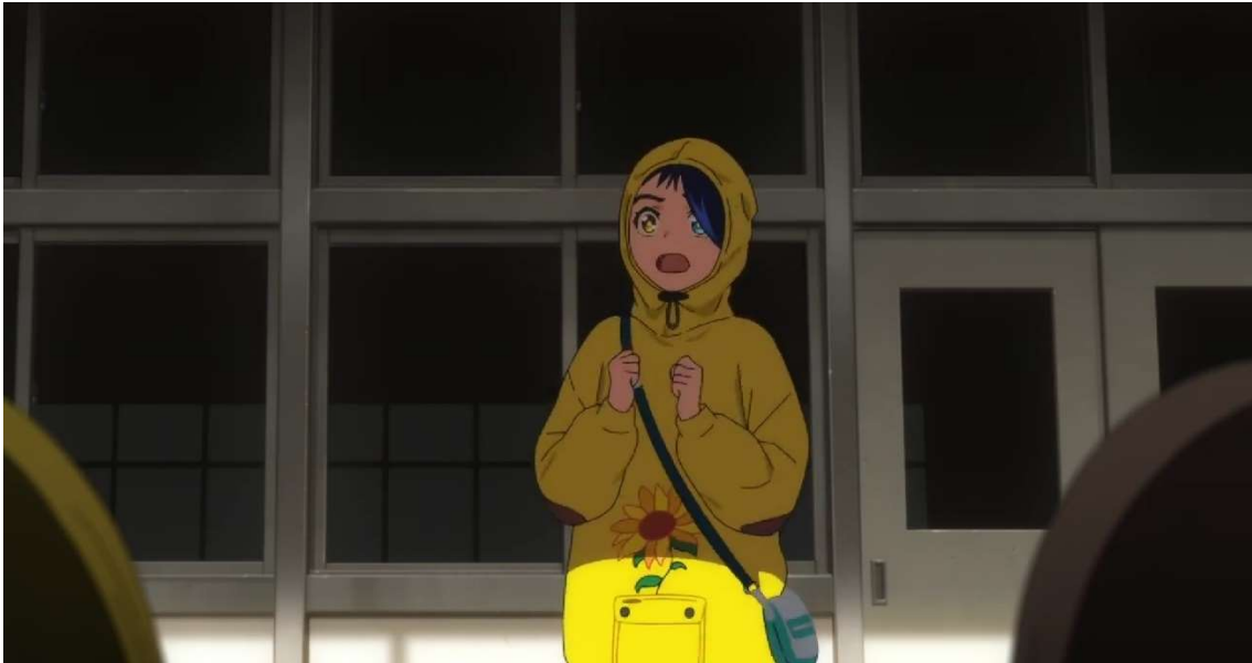
Kuva 30: Ai pelkää kiusaajia unimaailmassa (Wonder Egg Priority 2021, jakso 1, 00:04:39).

Kurumin tapauksessa ei voida tietää, onko häpeä osa hänen itsemurhaansa vai ei. Kukaan ulkopuolinen henkilö, ei edes Kurumin trauma, tee huomautuksia Kurumista tai tämän itsemurhan motiivista. Kurumi ei myöskään vaikuta arvostelemaan itseään, vaan hän määrätietoisesti pakenee unimaailman hirviöiltä pysyäkseen hengissä. En kykene siis tutkimusaineiston avulla päättelemään häpeän suhdetta Kurumin itsemurhaan.