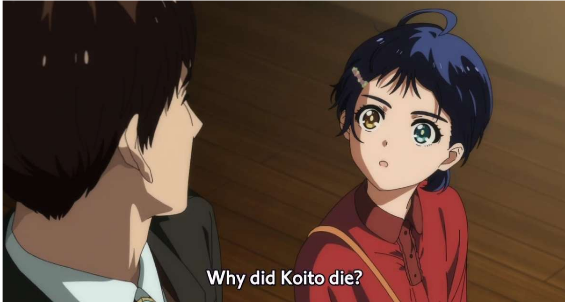
Kuva 40: Ai kysyy opettajalta Koiton itsemurhasta ( Wonder Egg Priority 2021, jakso 10, 00:18:43).

Tämä on suuri muutos sarjan aikana, sillä aiemmin sarjassa itsemurhan tekneistä tytöistä tai heidän kokemastaan pahasta ei haluttu puhua tosimaailmassa. Tapahtuneita asioita ei myöskään haluttu nähdä eikä niistä haluttu kuulla. Ai ei keskustellut Koiton kanssa opettaja Sawakista tai käsitellyt Koiton kiusaamiskokemuksia, kun tämä oli vielä elossa. Vaikka Ai näki ja kuuli Koiton, hän ei puhunut tämän kanssa, eikä hän puhunut tämän kärsimästä pahasta muiden kanssa. Momoekaan ei keskustellut Harukan kanssa tämän seksuaalisuudesta ja väärinkäsityksestä, joka lopulta johti Harukan itsemurhaan. Momoe näki Harukan ja kuuli, mitä tämä halusi, muttei puhunut tapahtuneesta Harukan tai kenenkään muun kanssa. Miwan äiti ei suostunut kuuntelemaan Miwaa, ja ainoastaan syytti tätä koko koskettelutilanteesta. Kaunishiuksinen tyttö ei itse nähnyt, kuinka turhamaista hänen halunsa kuolla nuorena oli, eivätkä Miko ja Mako nähneet Yu-Yun kuoleman jälkeen toista ulospääsyä järkyttävästä tilanteesta kuin seurata idolia kuolemalla.