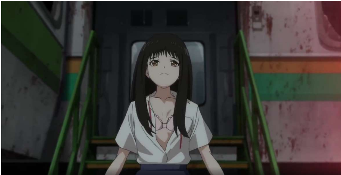
Kuva 29: Miwa riisuutuu trauman edessä ( Wonder Egg Priority 2021, jakso 4, 00:07:01).

Kun Momoe taistelee traumaa vastaan, Miwa päättää auttaa häntä. Miwa huijaa traumaa avaamalla paitansa napit ja uskottelemalla, että antaa tämän koskettaa itseään. Kohtauksen tarkoituksena on saada katsoja tuntemaan olonsa epämuikavaksi. Ei ole luonnollista, että alaikäinen tyttö riisuutuu aikuisen miehen edessä ja tyydyttää tämän seksuaalisia fantasioita. Miwalla on kohtauksessa rauhallinen ilme, ja hän jopa levittää kätensä. Ikään kuin hän antautuisi trauman syleilylle. (Ks. kuva 29.) Kun Momoe lopulta osuu traumaan kuolettavasti, trauma syyttää Miwaa huijaamisesta. Tähän Miwa toteaa: "Totta kai. Kuolisin mieluummin kuin olisin kanssasi." ( Wonder Egg Priority 2021, jakso 4, 00:08:08). Näin Miwa toteaa ensimmäisen kerran ääneen, että hän ei halunnut tulla kenenkään koskettelemaksi. Lisäksi toteamus on suora viittaus Miwan itsemurhaan, ja sen taustalla vaikuttavaan motiiviin.