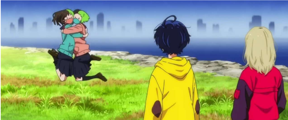
Kuva 19: Miko ja Mako iloitsevat nähdessään toisensa. (Wonder Egg Priority 2021, jakso 3, 00:13:45)

värikoordinoituja (ks. kuva 19). Molemmat tytöt kantavat mukanaan myös valotikkuja, joiden heiluttaminen on varsin yleistä idolien konserteissa laulujen aikana.