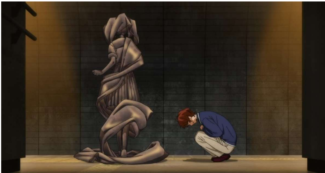
Kuva 16: Momoe ja Harukan patsas (Wonder Egg Priority 2021, jaksso 4, 00:16:43).

Harukan itsemurhan motiivi on Koiton tavoin estetty rakkaus. Haruka rakastaa Momoeta ja haluaisi olla tämän kanssa enemmänkin kuin ystävä. Momoen kuitenkin paetessa paikalta Haruka kokee olonsa avuttomaksi. Hän tuntee hämmennystä seksuaalisuudestaan ja ystävyysuhteestaan Momoeen, mikä lopulta ajaa hänet epätoivoiseen tekoon. Häpeä liittyy Harukan itsemurhaan Momoen kautta. Samalla tavalla kuten Ai tuntee häpeää ja syyllisyyttä Koiton itsemurhasta, Momoe tuntee häpeää ja syyllisyyttä Harukan itsemurhasta. Momoe taistelee hirviöitä vastaan unimaailmassa tuodakseen ystävänsä takaisin ja on valmis jopa uhraamaan oman henkensä. Häpeä tulee esille erityisesti, kun Momoe kertoo Harukasta uusille ystävilleen ja kuvaillee tämän lähentelyä seuraavasti: "Pelästyin ja työnsin hänet pois.", "Kätteni tärisivät. Mitä minun olisi pitänyt tehdä toisin?" (Wonder Egg Priority 2021, jaksso 5, 00:14:01–