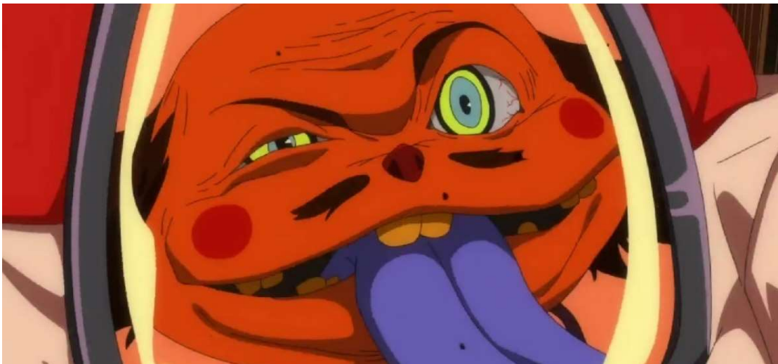
Kuva 9: "Sinun ei tarvitse pelätä. Olenhan sentään jumala!" ( Wonder Egg Priority 2021, jakso 5, 00:00:05)

Aineiston valossa on hankala todeta, millä tavoin häpeä liittyy tai ei liity kotoa karanneen tytön itsemurhaan. Trauma solvaa tyttöä ja kyseenalaistaa tämän teot tosimailmassa, mikä mahdollistaa häpeän tunteen syntymisen. Kuitenkaan tyttö ei arvostele itseään ainakaan sanallisesti eikä sanattomasta arvostelusta ole sarjassa juurikaan näkyviä merkkejä. Tyttö kylläkin haluaa jalkojaan ja käpertyy kerälle, kun trauma sanoo, etteivät hänen vanhempansa rakastaneet häntä. Tämä toiminta voidaan nähdä eräänlaisena suojelumekanismina, jolla tyttö yrittää ikään kuin piilottaa itsensä maailmalta ja sen kauheuksilta. Tytön kasvoja ei näytetä, mikä luo vaikutelman, että tyttöä pelottaa tai hän tuntee muita hankalia tunteita. (Ks. kuva 10.) Sarjassa on toinen tyttö nimeltä Miwa, jota on myös hyväksikäytetty seksuaalisesti. Kuitenkin Miwa vastustaa omaa traumaansa, eikä halua kuunnella tämän sanoja. Kotoa karanneella työllä ei vaikuttaisi olevan rohkeutta sanoa traumalle vastaan, mutta tämäkään ei kerro varmasti häpeän tunteesta tai sen olemattomuudesta. Tämän vuoksi häpeän suhdetta kotoa karanneen tytön itsemurhaan ei ole mahdollista todeta.