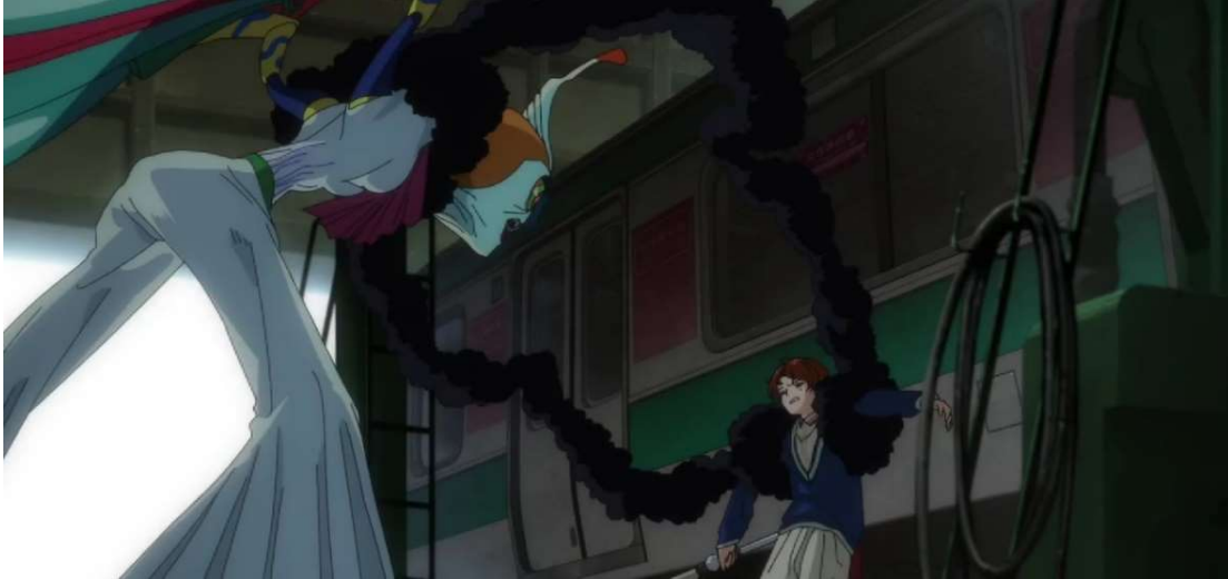
Kuva 15: Momoe taistelee unimaailmassa 2. (Wonder Egg Priority 2021, jaksso 4, 00:14:55)