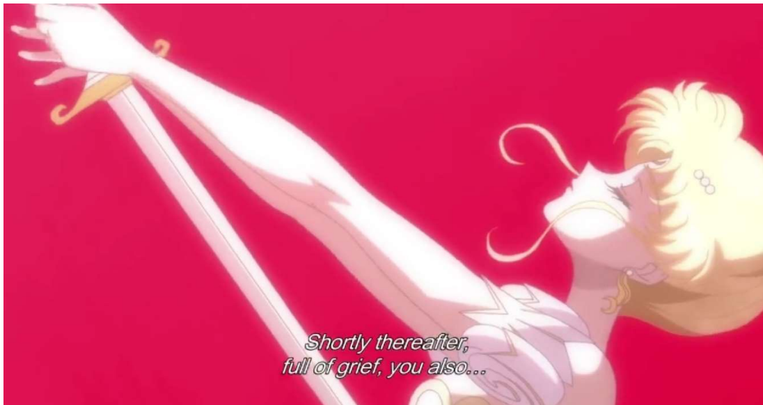
Kuva 5: Prinsessa Serenity surmaa itsensä ( Sailor Moon Crystal 2014, jakso 10, 0:10:59).

Seppuku ja kakugo no jisatsu ovat huomattava osa myös animen tarinankerrontaa. Itsemurhia tai niiden kaltaisia tekoja esiintyy monissa eri genrejen animeissa ja muun muassa Sailor Moon Crystal , Puella Magi Madoka Magica ja Bleach sisältävät selkeitä kohtauksia seppukusta tai sen kaltaisista teoista. Sailor Moon Crystalissa (2014) sarjan päähenkilö prinsessa Serenity surmaa itsensä miekalla, kun hänen rakastetunsa prinssi Endymion kuolee sodassa pahuutta vastaan (ks. Kuva 5).