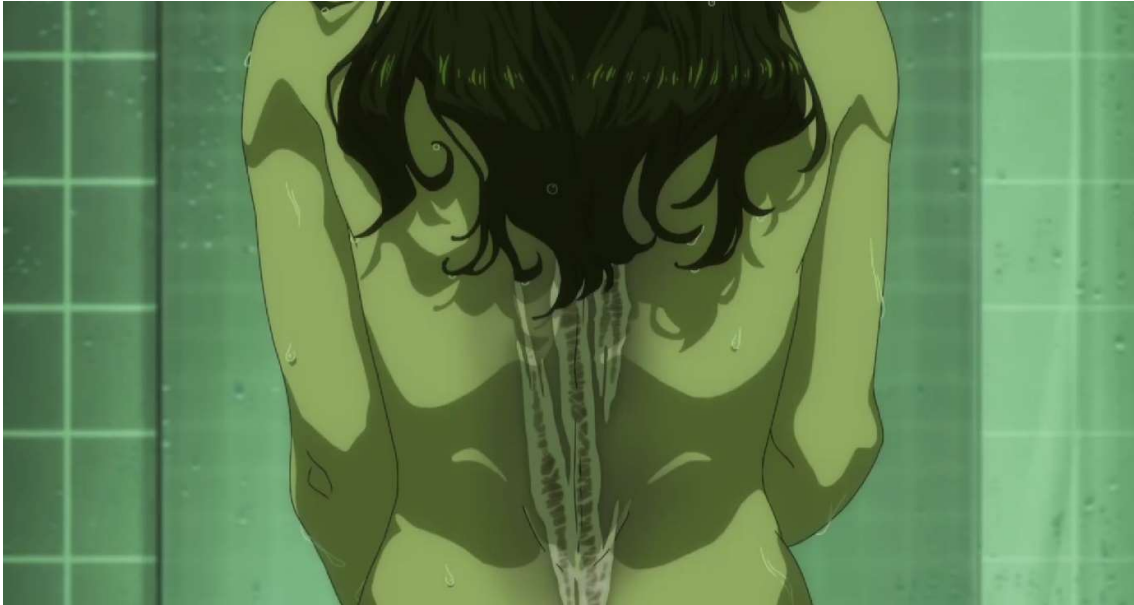
Kuva 2: Neirun selän haava ( Wonder Egg Priority 2021, jakso 5, 00:18:13).

Kohtauksessa on selkeästi moen kaltainen, seksuaalisesti jännittynyt tunnelma, jolla yritetään vedota katsojien tunteisiin alaikäistä tyttöähän. Moe näkyy sarjassa myös henkilöhahmojen silmissä, koska moe-tunnetta herättävät henkilöhahmot ovat luonteeltaan ”unenomaisia ja vaarallisen avuttomia”, mikä näkyy muun muassa hahmojen suurissa silmissä (Akgün 2020, 278). Erityisesti Ain silmät ovat sarjassa paljon esillä niiden erivärisyyden vuoksi, ja ne on monesti kuvattu kimaltelevina ja erittäin kauniina. Niistä on myös paljon lähikuvia sarjan aikana. Heti sarjan ensihetkistä lähtien Ain silmät tekevät hänestä ulkoisesti söpön hahmon, jonka tarkoitus kiinnittää katsojan huomio ja mielenkiinto itseensä. (Ks. Kuvat 3 ja 4.)