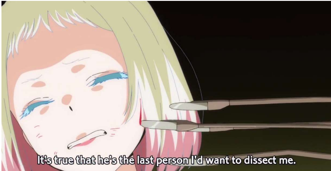
Kuva 21: Trauma viiltää Kotobukia (Wonder Egg Priority 2021, jakso 9, 00:13:49).

lä totta, että hän on viimeinen ihminen, kenen haluan leikkelevän minut.” (Wonder Egg Priority 2021, jakso 9, 00:13:43.)