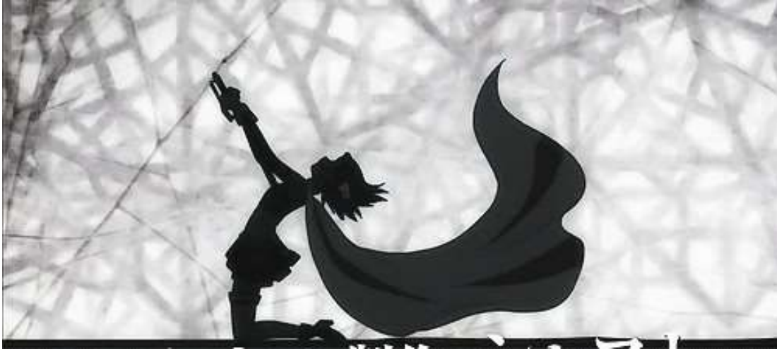
Kuva 6: Sayaka lävistää itsensä miekalla ( Puella Magi Madoka Magica: Rebellion 2013, 01:25:54).

Bleach -nimisessä sarjassa (2004–2012) poika nimeltä Ichigo haluaa pelastaa siskonsa pahalta aaveelta. Hänellä ei ole kuitenkaan tarvittavia voimia aaveen kukistamiseen, minkä vuoksi Rukia-niminen aaveenmetsästäjä auttaa häntä. Rukia haavoittuu pahasti ja pyytää Ichigoa ottamaan hänen voimansa. Ichigon täytyy lävistää itsensä Rukian samuraimiekalla saadakseen aaveenmetsästäjälle kuuluvat voimat (ks. Kuva 7).