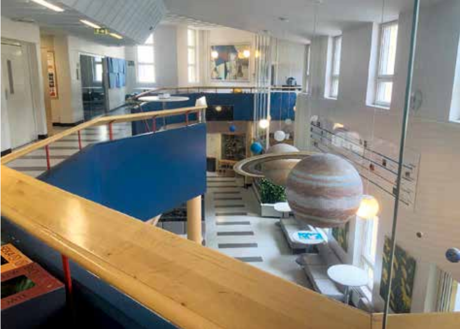
Kuva 17. Esimerkkejä opettavista sisustuselementeistä ovat aurinkokunnan pienoismalli aulan katossa, faktoja esittelevä seinätaulu ja lasivitrini, jossa on täytettyjä eläimiä.

Yksi aineenopettaja hahmotteli asiaa: ”Seinien, lattioiden, kattojen pitäisi olla kuin muinoin kirkkostruktuurissa: asia ovat kuvien avulla muistuteltavissa mieliin joka paikassa.”