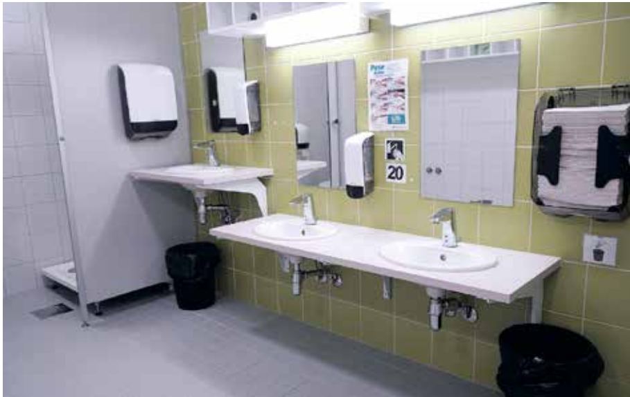
Kuva 11. Kangasvuoren päiväkotikoulun vessoissa on huomioitu monikäyttöisyys ja ergonomisuus. Vessatilassa on wc-koppien lisäksi myös liukuovella varustettu pesupaikka. Eritasoiset lavuaarit huomioivat eripituiset käyttäjät ja tukevat ergonomista ympäristöä.

Olisi hyvä, jos oppilaat ja opettaja voisivat halutessaan työskennellä seisoen. Tähän ei ole vielä oppilailla kunnollista mahdollisuutta, koska heillä ei ole säädettäviä työpöytiä, vaan joutuvat nostamaan tuolinsa pöydälle, jos haluavat työskennellä seisten. Tällöin vain takarivin paikat tulevat kysymykseen, koska edempänä istuvat blokkavat näkyvyyden taululle.