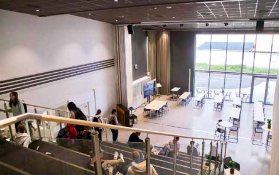
Kuva 4. Kaustisen musiikkilukion aulan katsomon portaat mahdollistavat itsenäisen opiskelun ja kohtaamiset. Tila on käytettävissä myös yhteisöllisissä tapahtumissa. Korkeat, verhoihin pimennettävät ikkunat tuovat luonnonvaloa tilaan. Näyttämö muuntuu siirrettävän väliseinän avulla suljetuksi luokkatilaksi.

koettavia tiloja. Nähtiin, että kodikkuutta lisäsi esimerkiksi ”kotipesä-ajattelu”. Eräs opettaja kirjoitti: ”yhteisiin tiloihin lisää kodikkuutta - mutta toisaalta, kaikki pitäisi saada sitoutettua siihen, että näistä pidetään myös huolta.”