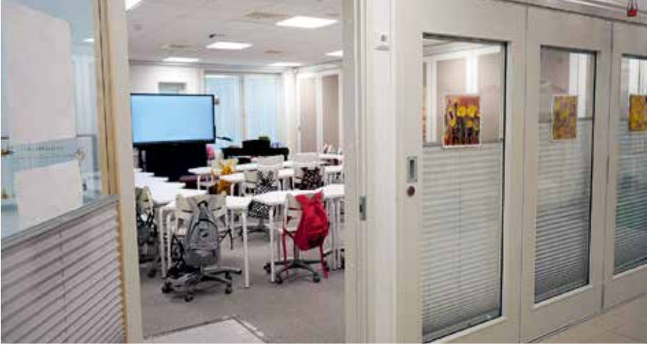
Kuva 20. Kangasvuoren päiväkotikoulussa luokkahuoneiden avattavat seinät mahdollistavat esimerkiksi yhteisopettajuuden. Tilat ovat avattavissa myös käytäville. Näkyvyys luokkahuoneesta käytävään voidaan rajata verhoilla.

Huomautettiin, että useammat opettajat käyttävät samoja luokkahuoneita, joten niiden tulisi muuntua eri tarkoituksiin sekä kurssien ja opintojaksojen näköisiksi esimerkiksi perinteiseen tuntiopetukseen, käsityöhön ja kuvataiteeseen. Toivottiin myös joustavuutta olosuhteiden järjestämisessä. Tiloilta toivottiin joustavuutta ja soveltuvuutta eri käyttötarkoituksiin. Työskentelypaikkoja tulisi olla mahdollista muokata esimerkiksi pari- ja ryhmätyöskentelylle ja luokkatila pitäisi pystyä jakamaan väliseinällä.