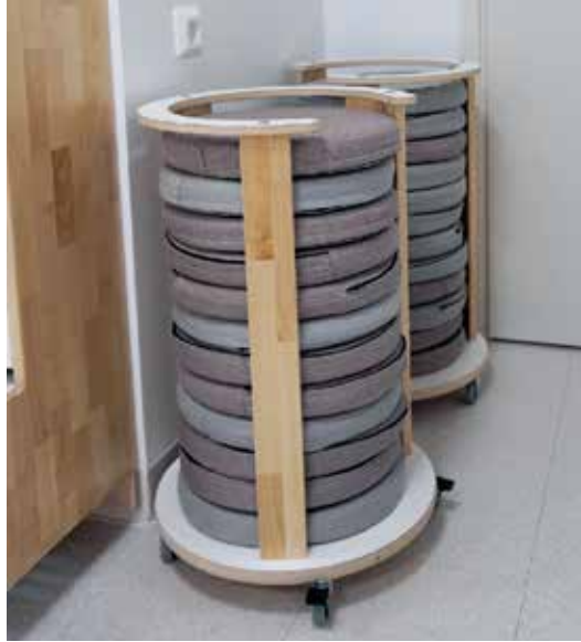
Kuva 9. Kangasvuoren päiväkotikoulun pyörillä liikkuvat istuinalustojen säilytysratkaisut mahdollistavat istuinten helpon säilytyksen ja liikuttelun.

lattiatyynyjä, riippukeinuja ja sohvia. Sopivat ja mukavat kalusteet mahdollistaisivat tutkimisen ja leikkimisen. Sohvat nähtiin erityisen sopivina sylittelyyn ja kirjan lukemiseen. Luokanopettajat toivoivat niin ikään pehmeitä materiaaleja ja kalusteita. Eräs opettaja toivoi: ”Luokkaan pehmeitä istuimia, joissa esim. motorisesti levoton oppilas voi liikkua opiskellessaan.” Myös aineenopettajat toivoivat mukavia huonekaluja ja esimerkiksi rentoutumisen mahdollistavia kalusteita.