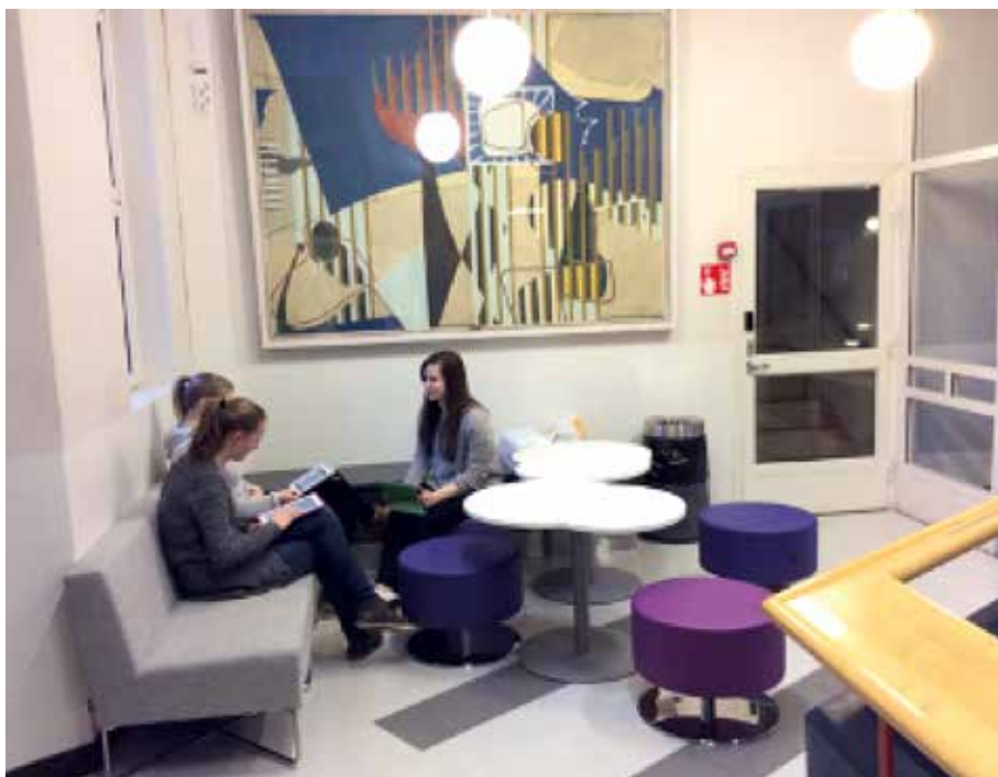
Kuva 10. Jyväskylän yliopiston Normaalikoulun aulatiloiissa esteettistä miellyttävyyttä lisäävät esimerkiksi taideteokset ja tunnelmalamput. Auloihin on myös hankittu sohvaryhmiä niin työskentelyä kuin oleskeluakin varten.