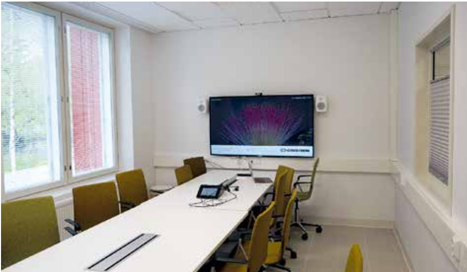
Kuva 1. Kangasvuoren päiväkotikoulun neuvottelutilan käytävälle ja pihalle avautuvat ikkunat voidaan tarvittaessa himmentää kaihtimilla. Tilassa on myös varustelu etäpalaveriin.