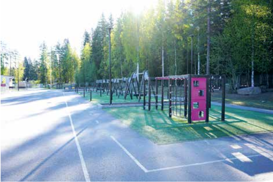
Kuva 16. Kangasvuoren päiväkotikoulun piha on monipuolinen. Tekonurmella olevien keinujen ja kiipeilytelineen ympärillä kulkee ajorata muun muassa pyörille ja rekoille. Rakennetun pihan lisäksi luonnonympäristö on vahvasti läsnä.

myös välituntien tarkempaa suunnittelua, jotta kaikki oppilaat mahtuvat siellä hyvin leikkimään.