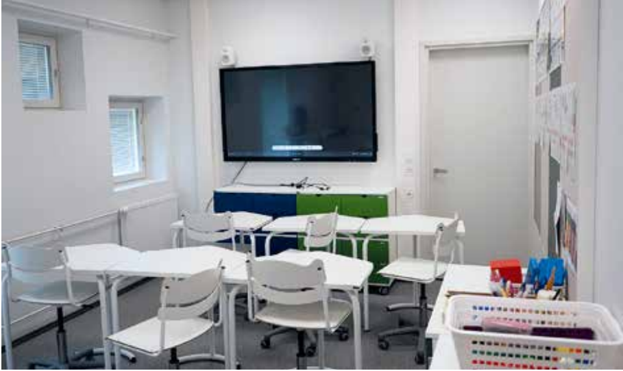
Kuva 5. Kangasvuoren päiväkotikoulun pienryhmätoiminnan ja eriyttämisen mahdollistava tila. Tilaan tulee hyvin valoa ikkunoista, joista näkyy tielle ja metsään (ei esimerkiksi pihalle, joka voisi vaikuttaa keskittymiseen). Lisäksi tilasta on kulkumahdollisuus naapuriluokkaan, jolloin tilaa on mahdollista hyödyntää myös luokan ryhmätyötilana.

Eräs opettaja pohti lisäksi, kuinka pienessä koulussa oli helpompi tuntee oppijat ja huolehtia heidän yksilöllisistä tarpeistaan.