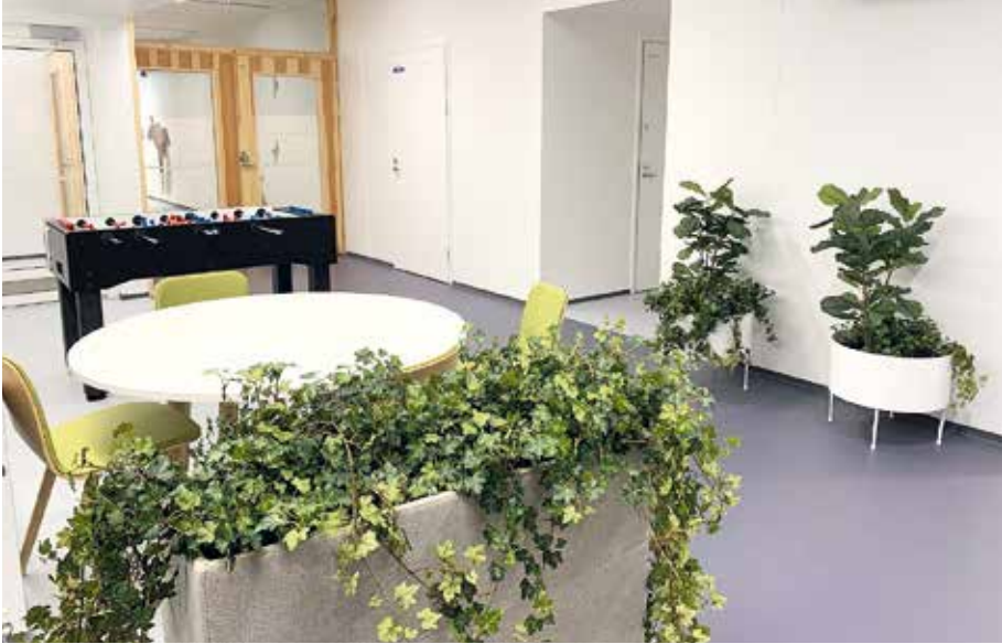
Kuva 15. Kortepohjan päiväkotikoulussa on mahdollista pelata erilaisia pelejä. Luonnon läsnäoloa luodaan osin myös tekokasveilla.

vaihtoehtoja yhdessä tekemiseen, esimerkiksi erilaisia toiminta- ja pelipisteitä. Tarvittaisiin tiloja, joissa pelata niin vauhdikkaampia kuin rauhallisempiakin pelejä.