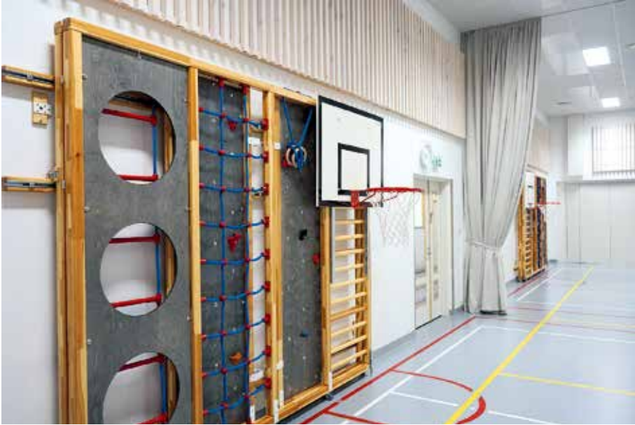
Kuva 12. Kangasvuoren päiväkotikoulun liikuntasalin seinustalla on auki vedettävät kiipeilykehikot.

rytmittää liikunnan ja joustavan toiminnan myötä. Lisäksi toivottiin kehonhallintaa ja hienomotoriikkaa tukevia ”välineitä, kokemuksia, ponnisteluja ja stimuloineita”. Toivottiin tilavampia käytäviä ja avaria tiloja (ks. myös III.1 Tilavuus ), joissa liikkua myös tuntien aikana. Liikuntasalin käyttömahdollisuudet koettiin joissakin vastauksissa liian vähäisinä. Myös aineenopettajat toivoivat ratkaisuja, jotka houkuttaisivat liikuntaan, esimerkiksi erilaisia liikuntaan kannustavia oleskelupaikkoja. Liikunnan mahdollisuuksia sisäympäristöissä lisäisivät opettajien mukaan hyppyruudukot lattialla ja muut liikuntaan kannustavat pelit, tanssimatot monessa nurkkauksessa sekä polkupyörät, joilla voi polkea kännykän akkunsa täyteen. Toivottiin urheiluvälineitä luokkiin ja enemmän tilaa näiden käyttöön. Eräs opettaja kommentoi: ”Sisäliikunnan ’ujuttaminen’ mukaan päivään, esim. liikuntavälineet ja niiden käytön rohkaiseminen.”