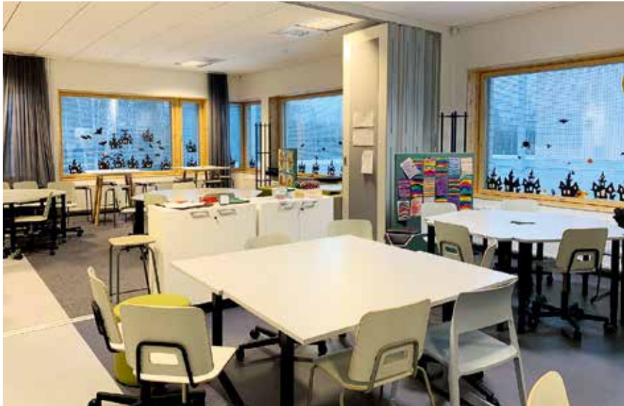
Kuva 2. Kortepohjan päiväkotikoulussa tuetaan yhteisopettajuutta. Haitariovien toisistaan erotettavat luokkatilat on suunniteltu niin, että toinen luokkatila on kooltaan pienempi. Tila toimii parhaiten joko avattuna tai siten, että toisessa tilassa työskentelee vähemmän oppijoita kuin toisessa. Tämän on ajateltu kannustavan yhteisopettajuuteen rinnakkaisluokkien opettajien kesken.

Yhteisiä tiloja oppimista, tutkimista, liikkumista, leikkimistä varten yli ryhmärajojen. Tila, joka tukee pitkäkestoisia lasten kanssa tehtäviä projekteja.