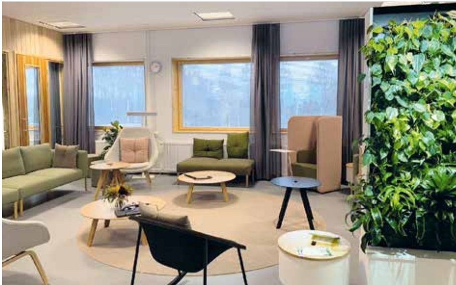
Kuva 13. Kortepohjan päiväkotikoulun henkilökunnan huoneessa on mahdollista levähtää ja kohdata kollegoja rauhallisessa tunnelmassa.

Työpäivät eivät saisi olla yhtä täyteen tupattuja kuin tällä hetkellä. Tuntien välillä pitäisi olla mahdollisuus siirtyä juoksematta tilasta toiseen.