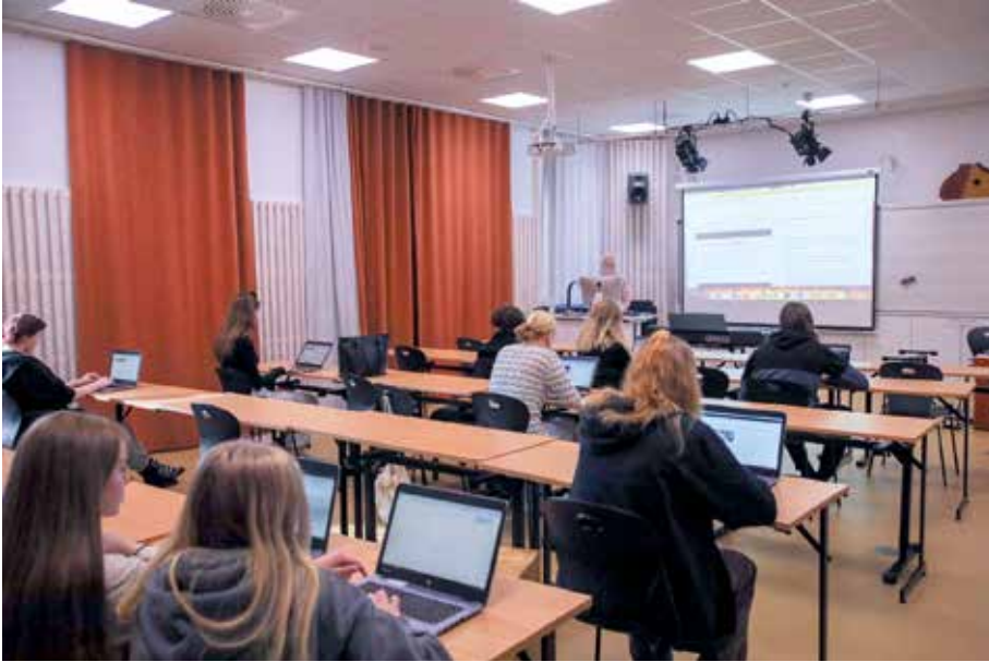
Kuva 19. Pöydät on järjestetty riviin opettajan pöytää ja esitystekniikkaa kohden mahdollistamaan opettajan antaman tehtävänannon. Opiskelijat työskentelevät omilla laitteillaan.

ja kestäviä kalusteita heikkolaatuisiin kalusteisiin niin käytäville kuin luokkiin. Annamme itsestämme tusinatavaran näköisen ilmeen, kun aiemmin (oppilaitoksen nimi) oli laadukas täyspuu-kestävä tuote. Oppijoiden tiloissa tulee olla kalusteet, jotka kestävät käyttöä JA jotka ovat ekologisesti kestäviä.