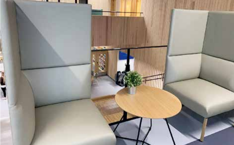
Kuva 3. Kortepohjan päiväkotikoulun leveille käytävälle sijoitetut huonekalut mahdollistavat sekä kohtaamiset että työskentelyn.

Korona-aika näkyy koulun eristäytymisenä - vaikka ollaan kaupungin keskellä, vierailut ja yhteistyöt ovat olleet minimissä. Toivotaan, että tilanne palautuisi normaaliin ja päästäisiin taas hyödyntämään koulun ulkopuolisia ympäristöjä aktiivisemmin.