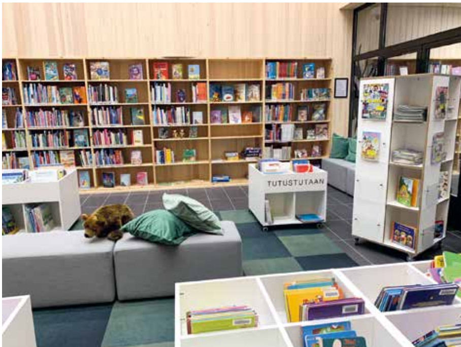
Kuva 18. Kortepohjan päiväkotikoulun yhteydessä oleva kunnallinen kirjasto mahdollistaa sujuvan yhteistyön kirjaston henkilökunnan kanssa samoin kuin kohtaamisia alueen asukkaiden kanssa.