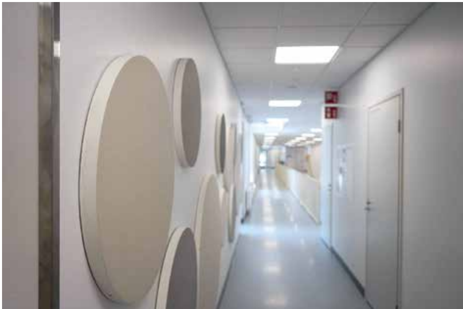
Kuva 7. Kangasvuoren päiväkotikoulun käytävillä on pyritty vaimentamaan melua akustoivalta katolla ja seinälevyillä. Seinälle sijoitetut vaimennuslevyt luovat myös mukavaa tunnelmaa ja lisäävät viihtyvyyttä.

Aineenopettajat toivoivat, että oppitunnit olisivat meluttomia. Etenkin ruokailua edeltävää tuntia kuvailtiin rauhattomaksi, kun muut kulkivat