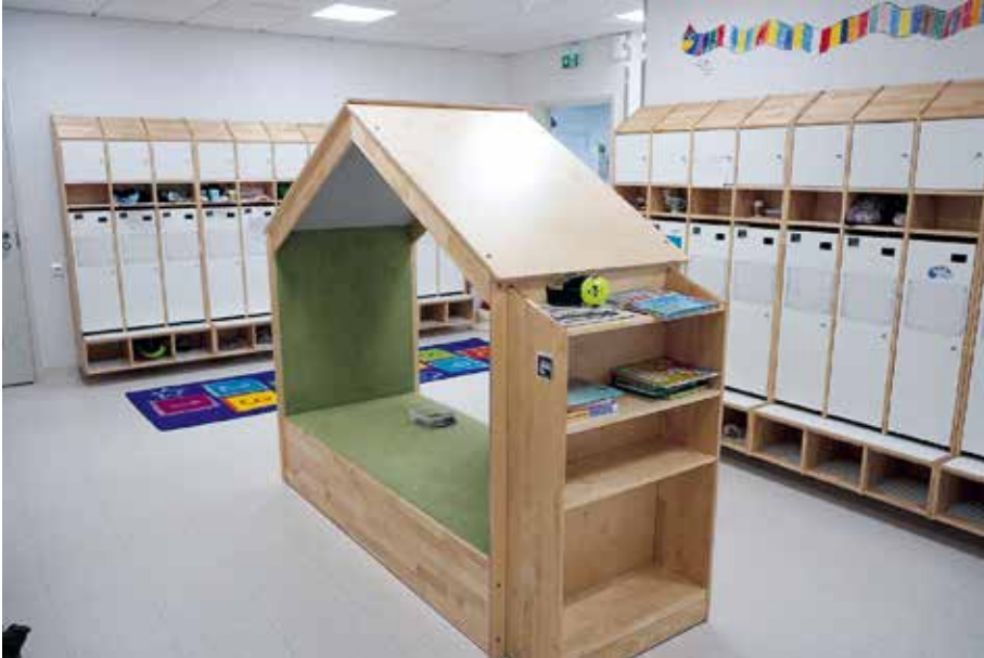
Kuva 8. Kangasvuoren päiväkotikoulun ryhmien aulatiloiissa on naulakko- ja kaappitilaa kullekin lapselle. Tilan keskiosassa on maja odottelua, rauhoittumista tai leikkimistä varten.

II.11 Ei huomiota hajottavia tekijöitä (Gislason, 2010; Flutter, 2006; Mäkelä & Helfenstein, 2016) tarkoittaa esimerkiksi tukea keskittymiseen ja rauhoittumiseen ja mahdollisuuksia sekä virtuaalisia että fyysisiä tiloja keskittymistä vaativaan työhön. Huomiota hajottavia seikkoja voidaan vähentää esimerkiksi pimennysverhojen avulla tai rajoittamalla internetin ja erityisesti sosiaalisen median käyttöä.