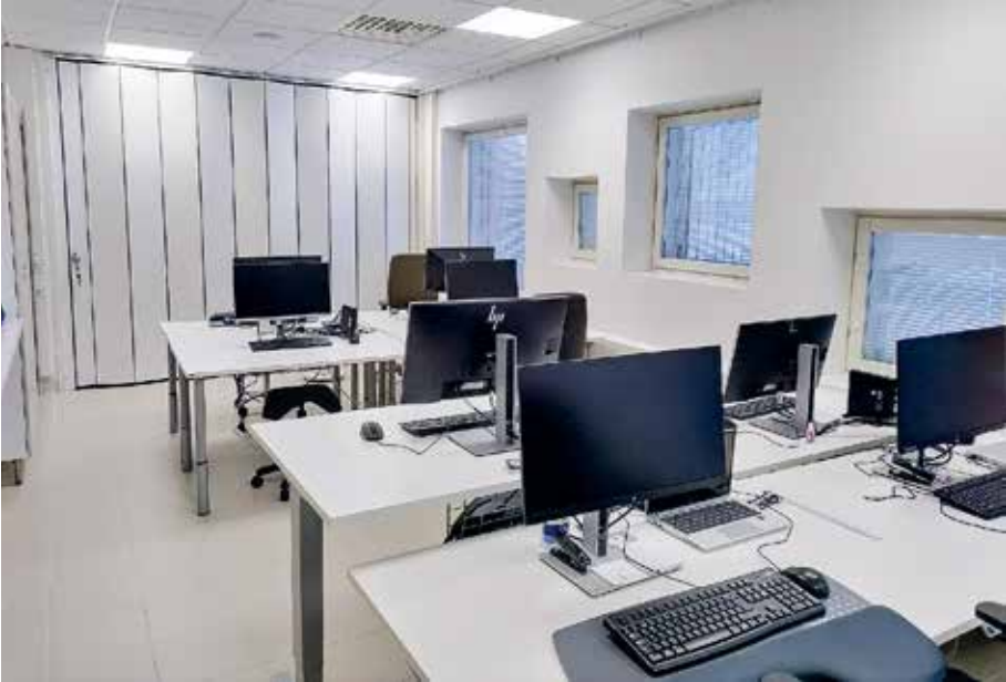
Kuva 6. Kangasvuoren päiväkotikoulun opettajanhuoneesta häiritäisellä erotettu hiljaisen työskentelyn huone, jossa voi toimia useampi työntekijä kerrallaan.

tavarat, oma kone) - työn tuottavuus, saada tehtyä pois rästitöitä mahdollistuisi.