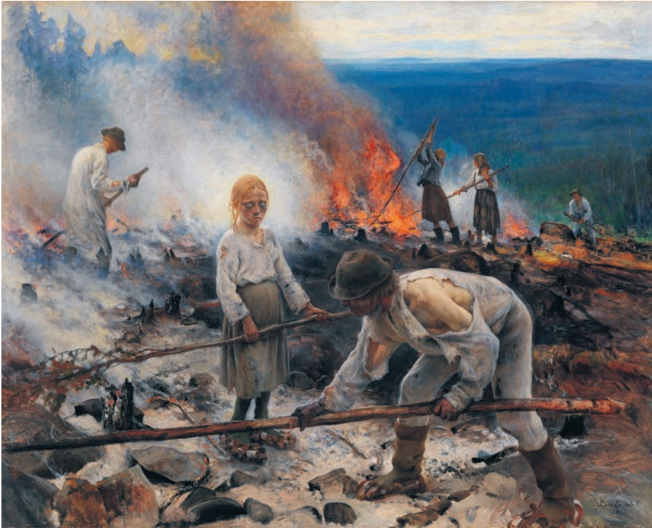
Lapinlahden Puurulan talon väkeä ja naapureita kaskipellolla ikuis-tettuina. Eero Järnefelt, Raatajat rahanalaiset / Kaski, 1893. Öljy kankaalle, 131 × 164 cm. Kansallisgalleria / Ateneum.