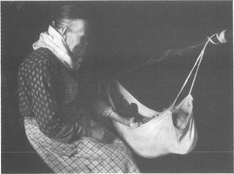
Lapsi vivussa, mummo hoitajana. Vuoksela 1934.

Nykyään etenkin naisten lapsen kaipuu perustunee paljon haluun saada nimenomaan pieni lapsi, jota voi hoitaa. Monet ajattelevat, että lapset ovat jollain erityisellä tavalla ihastuttavia olentoja. Lapsista toivotaan olevan iloa, ei niinkään hyötyä. Epäilen, että perspektiivi on voinut olla osittain toinen niin sanottua hyvinvointivaltiota edeltävänä aikana. Oletan, että lapsen merkitys nousi tuolloin tämän kasvaessa, pystyessä työhön ja lopulta vanhempiensa huoltamiseen ja elättämiseen. Äitiyden hedelmistä nautittiin kenties eniten siinä vaiheessa, kun lapset oli saatu kasvatettua aikuiseksi ja itse oli päästy anopin arvostettuun asemaan. Lasten merkitys äidille oli suuri, koska ne olivat hänen vanhuudenturvansa 382 . Ehkä poika oli tämänkin vuoksi tärkeä, tytöthän muuttivat avioituessaan useammin pois kotoa.