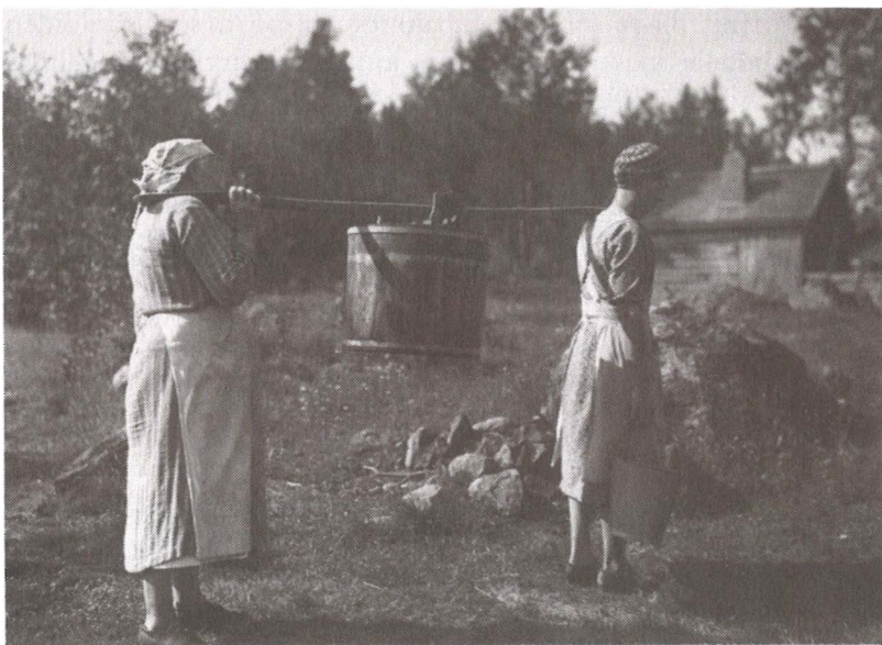
Pestyä pyykkiä kannetaan tangolla. Somerniemi 1936. Museovirasto. Kuvaaja Helmi Helminen.