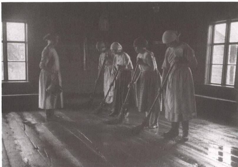
Juhannussiivous Konginkankaalla v. 1926.

taen rahvas siis käänsi ylemmän luokan edustajia vastaan asean, jota oli vuosisatojen ajan käytetty sen kurissapito- ja hallintavälineenä. 441