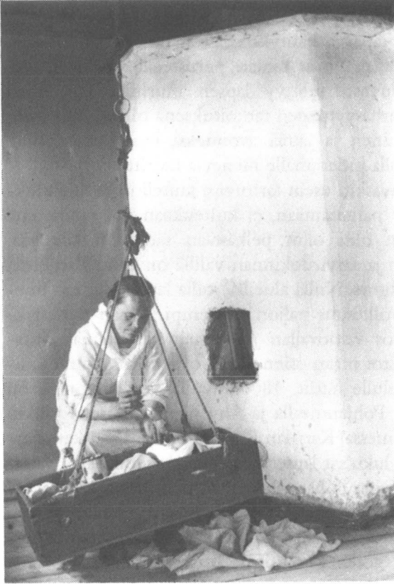
Lasta syötetään sarvesta, jonka päässä on lehmän nänni. Ilomantsi 1927.

pienokaisiaan, koska heillä ei ollut varaa lehmän maitoon. 47 Toisaalta myös aviottomat lapset kuolivat usein pian, koska heidän äitinsä hakeutuivat pian töihin, eivätkä ehtineet imettää lastaan 48 .