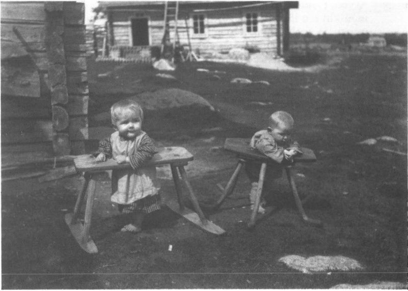
Lapset skammissa. Ilomantsi 1927.

Kansanvalistajat kiinnittivät vuosisadan alussa huomionsa lähinnä lasten terveyteen ja etenkin hengissä pysymiseen. 1930-luvulla alkoi valistuksen määrä ja sävy muuttua muun muassa perhelehdissä. Lastenhoito-ohjeita ilmestyi runsaasti ja lapset kuvattiin niissä erityisen suloisina. Väestöpolitiikalla oli osuutensa asiaan; syntyvyys oli laskenut huomattavasti ja äitejä yritettiin suostutella lasten hankintaan. 536