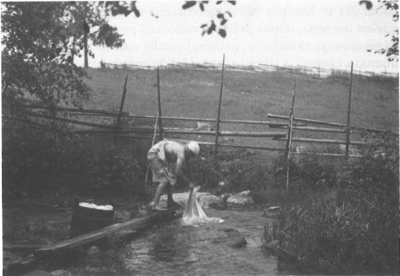
Pyykkiä virutetaan. Somerniemi 1936.