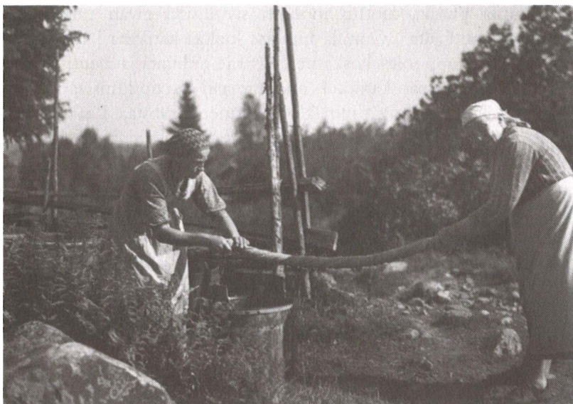
Hurstia väännetään. Somerniemi 1936.