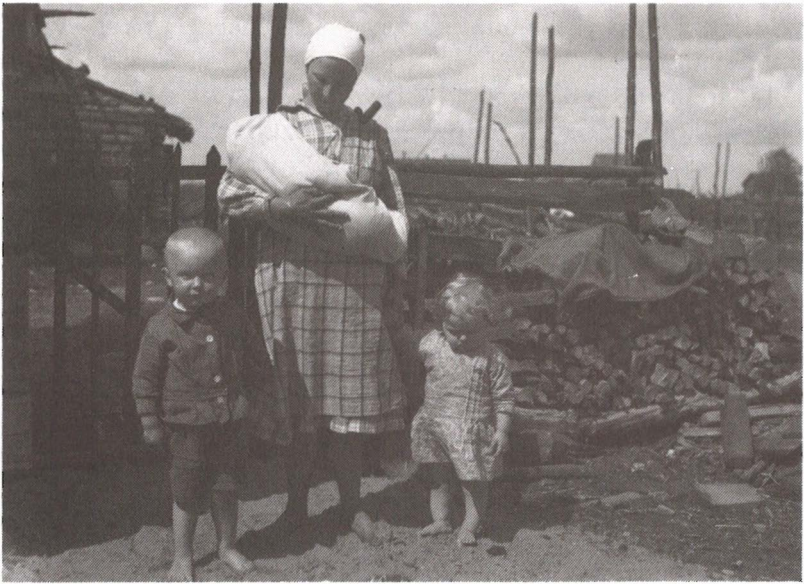
Äiti tulossa lasten kanssa töistä, sirppi olalla, vauva vivussa. Metsäpirtti v. 1930. Museovirasto. Kuvaaja Tyyni Vahter.

työntekoaan. Perusesimerkki teemasta on kuitenkin pellon laidalla synnyttäjä , joka synnyttää ilman muiden apua ja ryhtyy saman tien jatkamaan töitään. Kotisynnytyksaineisto sisältää näiden tarinoiden ohella paljon muutakin äitien työntekoa ja perheen sisäistä työnjakoa valaisevaa kerrontaa, jota hyödynnän tässä.