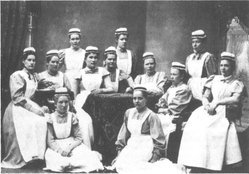
1800- ja 1900-lukujen vaihteen kättilöopiskelijoita opettajineen.

Puhtausvalistus kuului olennaisena osana naisille suunnattuun neuvontaan. Aivan erityisen merkityksen puhtaus sai kättilöiden työssä ja heidän harjoittamassaan äitiysvalistuksessa.