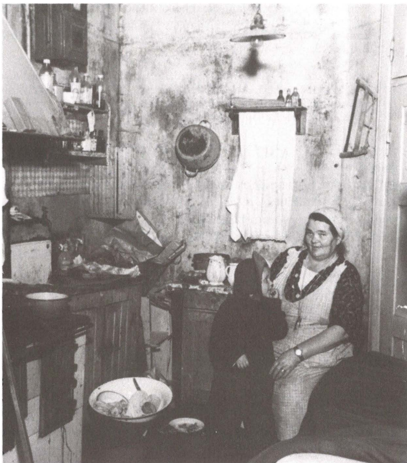
Helsinkiläisäiti lapsineen keittiössä v. 1953. Kuvassa näkyy emalinen pesuvati, joka on mahdollisesti saatu äitiyspakkauksesta.

Vuonna 1933 jolloin kohdalleni tuli ensi synnytys, vaatepuoli oli vähän huono. Taisi olla vähän taidon puutetta jos köyhyyttäkin saada lapselle vaatetta. Vanhoista vaatteista niitä otettiin niin paljon kuin sai ja lisää yritettiin ostaa pehmeää flanelia. Minä laittelin lopuista kappaleista siteitä itseäni varten. Pesin, silitin ja taittelin siististi valmiiksi, siitä oli kättilöt hyvillään. Ollapa kaikilla näin laitettu. 524