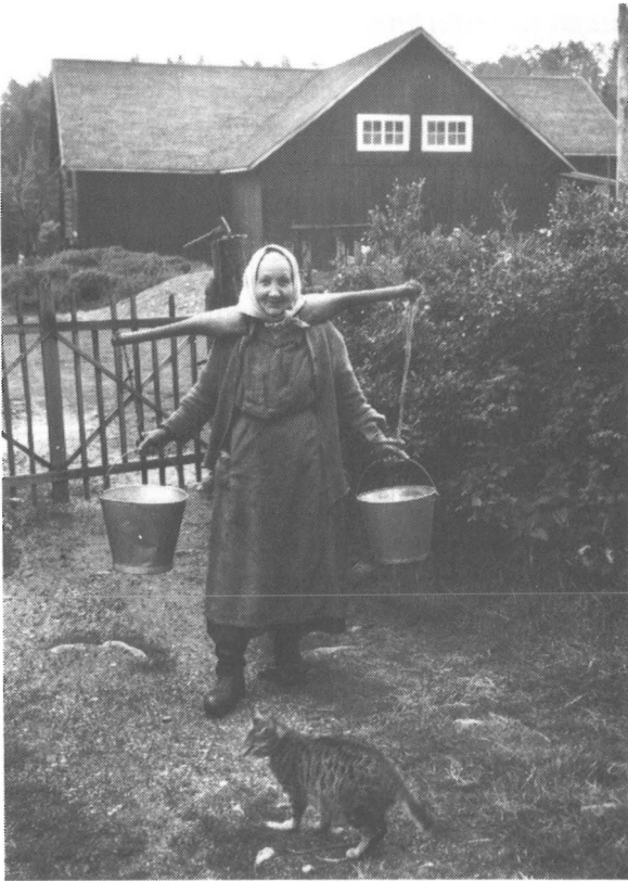
Olkatangolla kannetaan vettä. Ryhmättylä 1938.

Vastustus osoittaa edelleen, että valistuksessa oli kysymys vallasta määrittellä oikea elämäntapa, ja että kaikki naiset eivät suostuneet luovuttamaan omaa elämäntapaansa koskevaa määrittelyvaltaa valistajille. Puhtauden tuottaminen vaati – ja vaatii edelleenkin – naisilta kovaa työtä. Siihen käytetty aika on pois jostain muusta. Ennen pesukoneitten ja vesijohtojen aikakautta puhtausvaatimukset olivat nykyistä paljon kouriintuntuvampia. Mainittakoon, että niinkin myöhään kuin vuonna 1952 Suomen naisten laskettiin kulkevan päivittäin matkan maasta kuuhun kantaessaan vettä. Noihin aikoihin vain 10–25 prosentissa asuntoja oli nainen ja ämpäri -yhdistelmää tehokkaampia vesihuoltovälineitä: wc:itä, viemäreitä ja vesijohtoja. 551