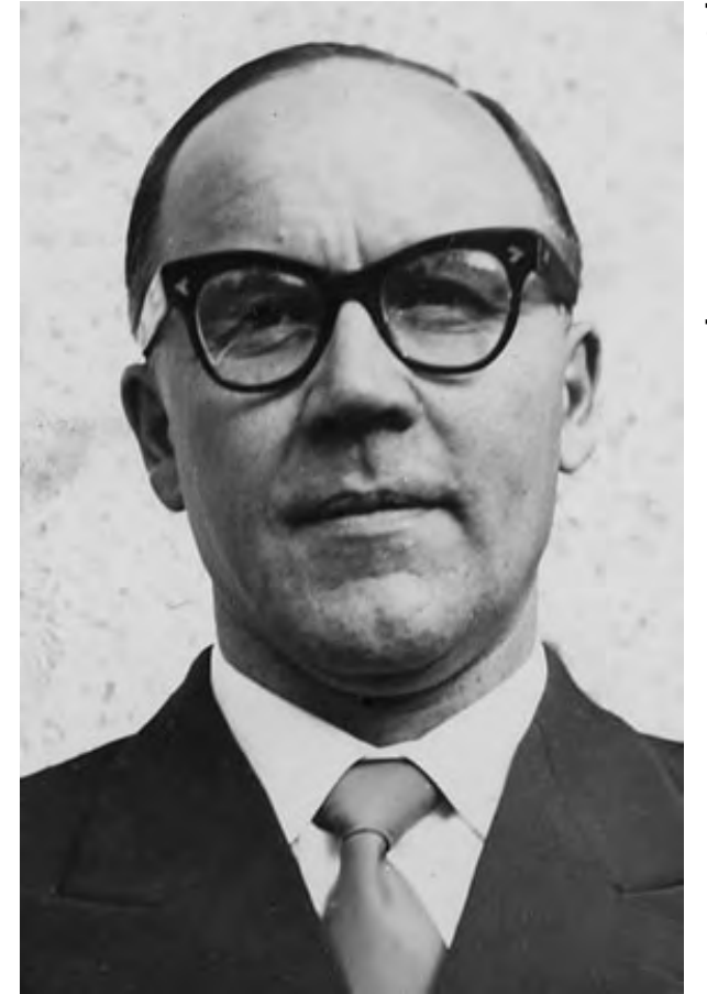
[KUVAN LÄHDE: WIKIPEDIA]

Simons esitti muistiossaan Neuvostoliiton ja USA:n kiihdytinhankkeen taustan ja siihenastiset vaiheet. Hän totesi, että kiihdyttimen mahdolliseksi sijoituspaikaksi on esitetty kahta valtiota – Suomea ja Itävaltaa.