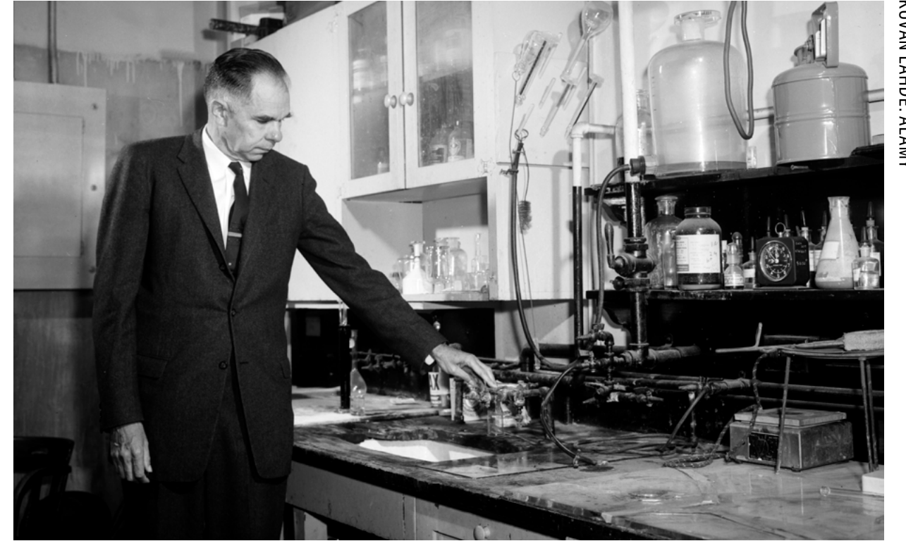
Glenn T. Seaborg vuonna 1962.

Pahaksi onneksi juuri vierailun aikoihin neuvostoliittolaiset ampuivat alas Yhdysvaltojen Lockheed U-2-tiedustelukoneen, joka oli kuvaamassa eräitä Neuvostoliiton sotilas-kohteita ja ydintutkimuslaitoksia. Tämän selkkauksen takia toukokuun puolivälissä vuonna 1960 Pariisissa alkanut neljän maan (Neuvostoliitto, USA, Iso-Britannia ja Ranska) valtionpäämiesten aseistariisumiskokous epäonnistui. Nämä maailmanpoliittiset tapahtumat myrkyttivät myös tiedemiesvierailun ilmapiirin, ja vierailun päätteeksi pidettyyn