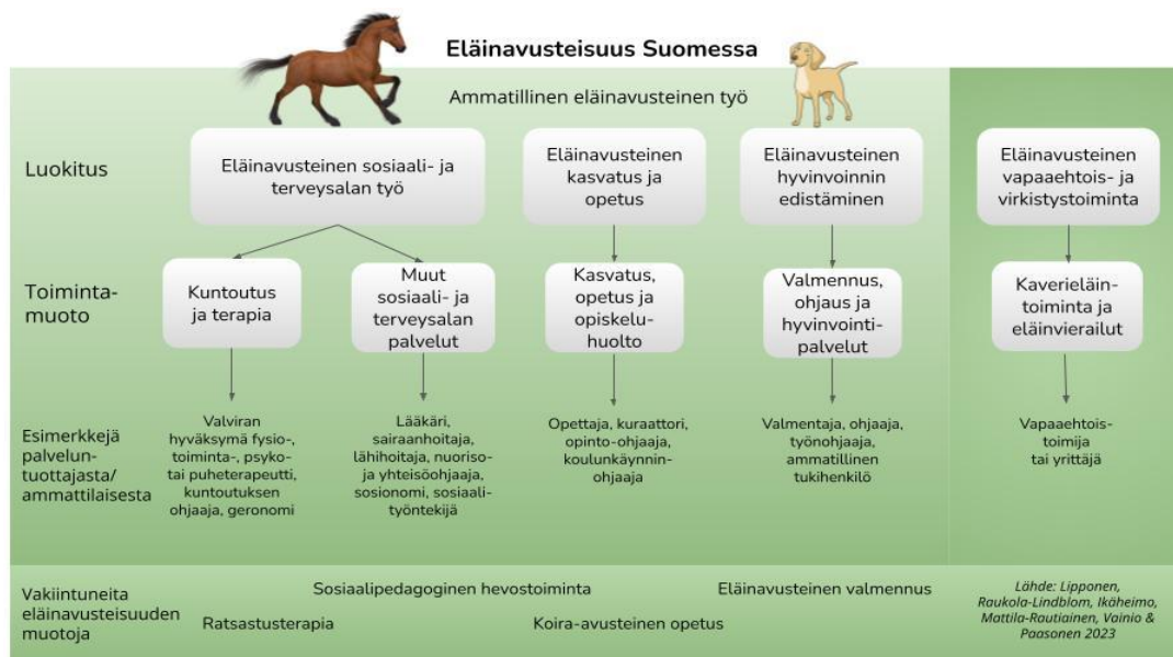
Kuvio 2. Eläinavusteisen työn jaottelu Eduskunnan Eläinavusteisen työryhmän mukaan

Eläinavusteisen työskentelyn jaottelu Eduskunnan Eläinavusteisen työryhmän mukaan. (Kuvio 2.).