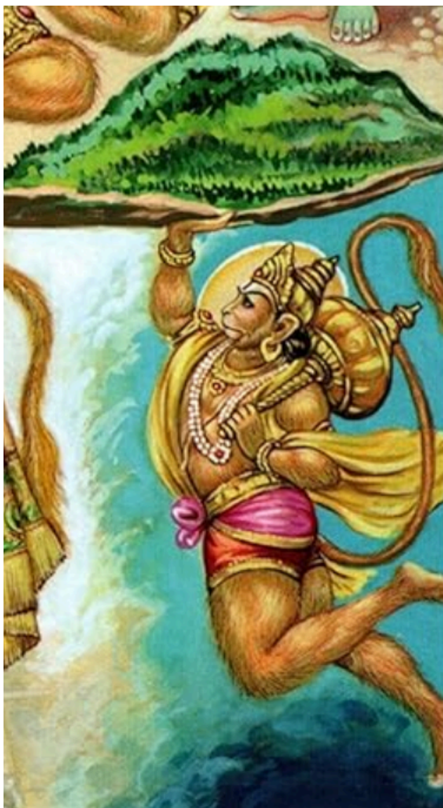
Kuva 4: Gita Press, Gorakhpur, 2023, Hanuman Ank.

Ramayanasta käy, ilmi kuinka Hanuman käy hakemassa parantavan lääkkeen Raman velipuolelle Lakshmanalle tämän haavoittuessa taistelussa Ravanaa vastaan (kuva 4). 65 Ramayanassa kerrotaan seuraavasti: