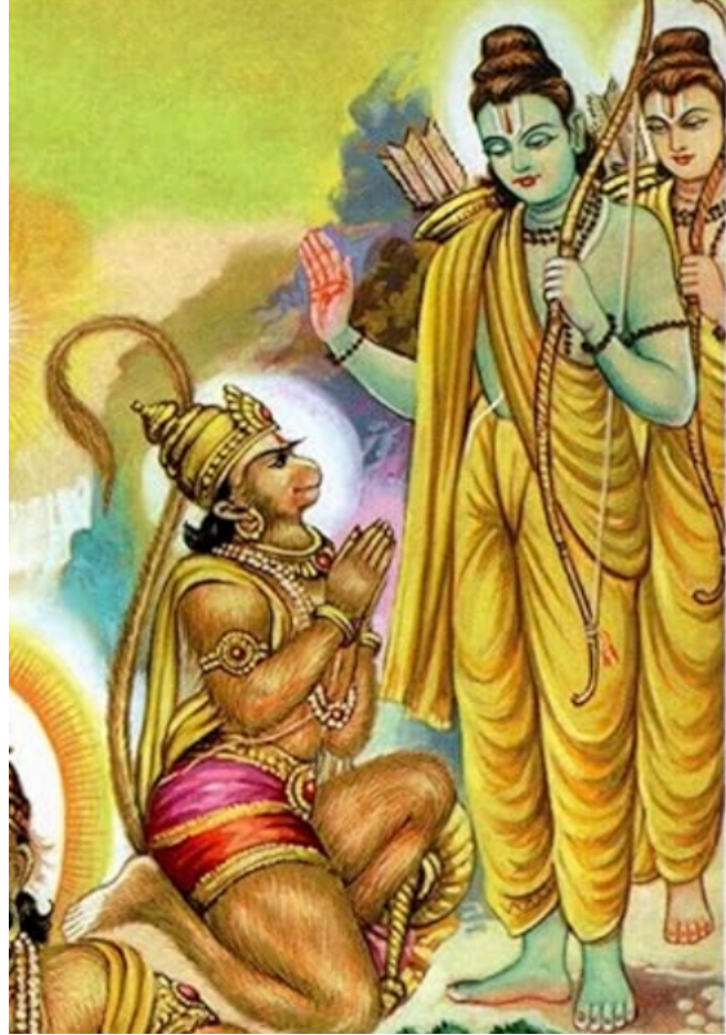
Kuva 2: Gita Press, Gorakhpur, 2023, Hanuman Ank.