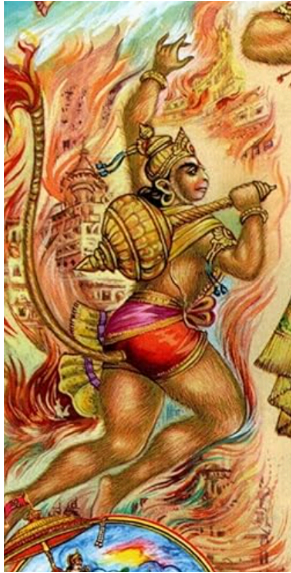
Kuva 3: Gita Press, Gorakhpur, 2023, Hanuman Ank.

Kuvan alalaidassa esitetty Hanuman ja tämän ympärillä olevat liekit (kuva 3) ovat tulkintani mukaan ote Ramayanasta, jossa Hanuman polttaa Lankan kaupungin. Ramayanassa kerrotaan, kuinka Hanumanin pelastusoperaatio Sitan pelastamiseksi Ravanan käsistä johti siihen, että hänet vangittiin hänen ollessa Raman sanansaattaja sekä aikomuksestaan pelastaa Sita: