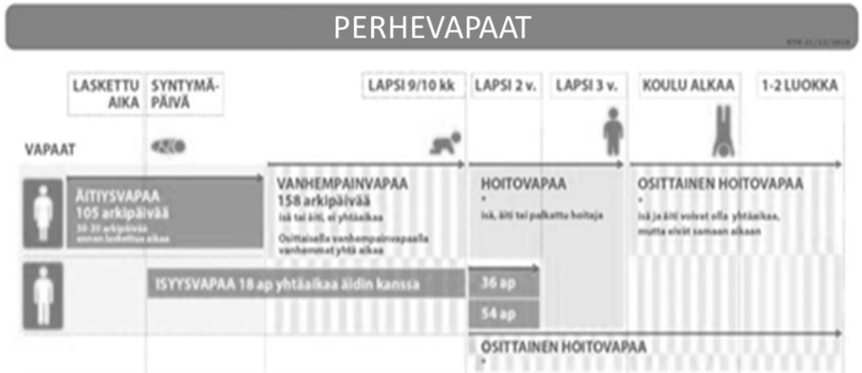
Kuva 1. Perhevapaajärjestelmä (Isolankila ym., 2019).

Kansaneläkelaitos (2021) toteaa, että perhevapaat ja etuudet ovat keinoja, joilla pyritään tukemaan lapsiperheitä. Raskaus ja vauva-aikana vanhemmille kuuluvat äitiysavustus, äitiysraha, isyysraha, vanhempainraha ja lapsilisä. Lastenhoidon tukiin kuuluvat kotihoidon tuki, joustava hoitoraha ja osittainen hoitoraha. Muissa tilanteissa valtio tukee toisinlaisin tukikeinoin perheitä lapsen sairastaessa tai jos lapsella on vamma. Muita tukitoimia mahdollistetaan perheiden tilanteista riippuen.