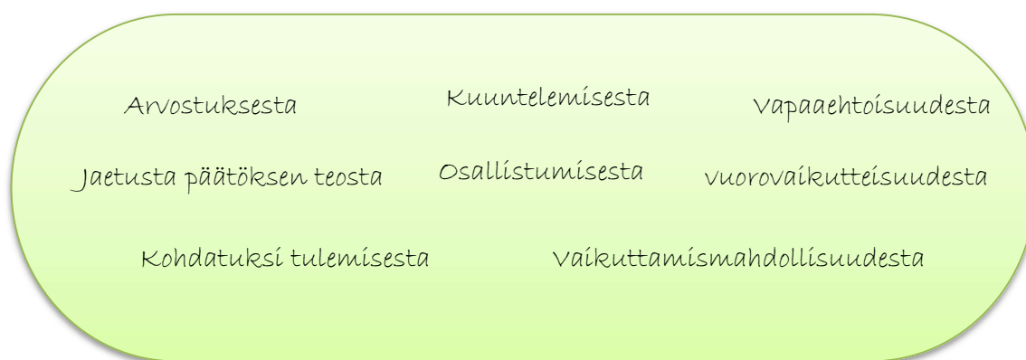
Kuvio 3. Tutkimusaineiston mukaiset lapsen osallisuuden osa-alueet.

Lasten osallisuus koostuu kuuntelemisesta, kohdatuksi tulemisesta, mielipiteiden arvostamisesta, vuorovaikutteisuudesta, vapaaehtoisuudesta, kuulumisen tunteesta, osallistumisesta, mahdollisuudesta vaikuttaa sekä omaan elämään että itselle tärkeäksi koettuun asiaan ja jaetusta päätöksen teosta.