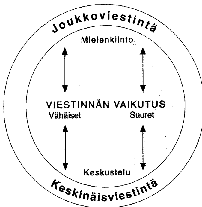
Kuvio 4. Joukkoviestinnän ja keskinäisviestinnän suostuttelukehä (Wiio & Puska 1993, 50)

Aids-valistuksen lisääntymisen myötä mm. kondomin käyttö sukupuolitautilien ehkäisijänä on saavuttanut joukkoviestinnän kautta myös keskinäisviestinnän tason. Aihetta on käsitelty aktiivisesti joukkoviestinnässä ja näin on saatu aikaan yleistä keskustelua ja asenteiden muuttumista kondomimyönteisempään suuntaan. Ihmisten kiinnostus asiaan puolestaan pitää yllä joukkotiedotuksen aktiivista roolia, mikä edelleen vahvistaa suostuttelukehän pyörimistä. Shawn ja McCombsin (Wiio 1992, 171) päiväjärjestysmallia voidaan soveltaa tilanteeseen toteamalla, että ihmiset ovat hyväksyneet kondomikeskustelun päiväjärjestykseensä.