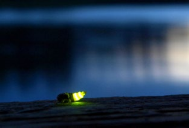
Yön yksinäinen valopilkku, kiiltomatonaares loistaa pimeään yöhön.

Facebookin, Instagramin ja Twitterin avulla