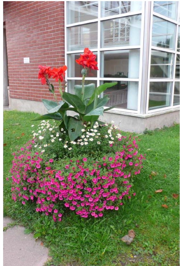
Elokuun 12. päivä kuvatussa Mattilanniemen kesäkukkais- tutuksessa on kannaa, markettaa ja pikkupetuniaa.

Seminaarinpuistossa oli kymmenen, Mattilanniemessä viisi ja Ylistöllä kolme kesäkukka-astiaa. Lajeina käytettiin mm. ryhmäsamettikukkaa, kannaa, verbenaa, ahkeraliisaa, pikkupetuniaa ja markettaa.