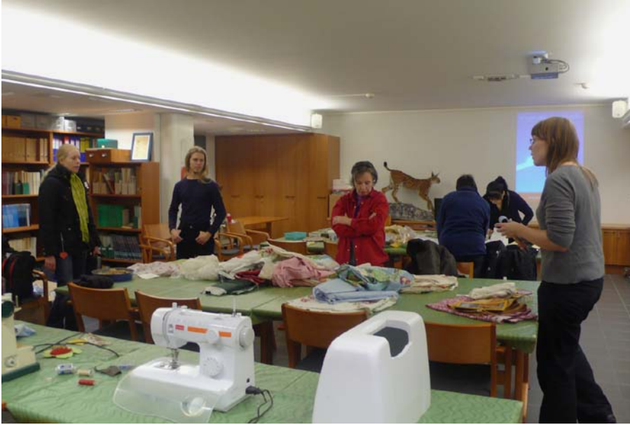
Luonto-Liiton järjestämä Älä osta mitään -päivä museon kirjasto-luentosalissa 26.10.