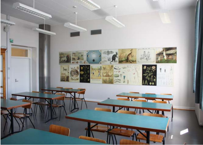
Seminariumin kolmannen kerroksen luokka peruskorjauksen jälkeen.

Koska rahoitusta ei ollut, perusnäyttelyn valmistamista siirrettiin kohti seuraavia vuosia. Vuoden lopussa saatiin päätös näyttelyrahoituksesta ja suunnittelutyön on tarkoitus alkaa vuonna 2011.