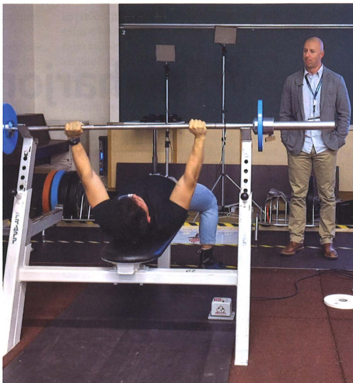
Nopeusperusteisen voimaharjoittelun demo menossa.