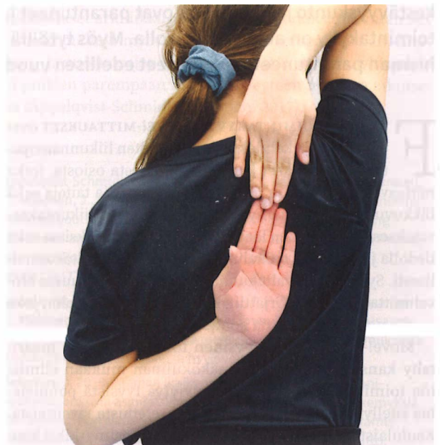
Kuva 2 Oikean olkapään liikkuvuuden mittaus.

Viidennen luokan tyttöjen mediaanitulos oli 3 minuuttia 44 sekuntia ja poikien 4 minuuttia 40 sekuntia. Kahdeksannen luokan tyttöjen mediaanitulos oli 4 minuuttia 12 sekuntia ja poikien tasan 6 minuuttia. Positiivisesta kehityksestä huolimatta isolla osalla oppilaista kestävyyskunto kaipaa kohentamista.