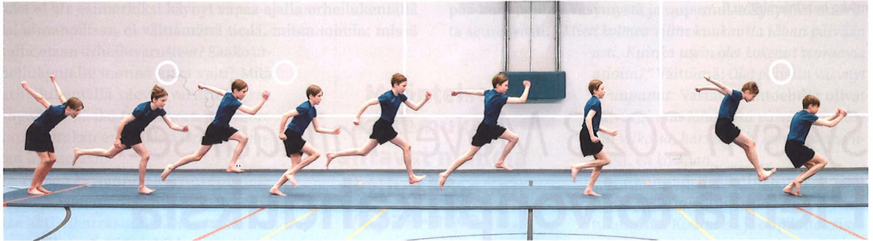
Kuva 1 Viisiloikka vauhdissa.

Hyvinvointialueiden ja kuntien erot ovat merkittäviä, sillä heikon toimintakyvyn oppilaiden osuus vaihtelee 32 prosentista 50 prosenttiin hyvinvointialueiden välillä ja Oprosentista ja 92 prosenttiin kuntien välillä. Vaikka Move!-n summaindikaattori toimiikin parhaiten nimenomaan seurannan välineenä, on muutosten tulkinnessa syytä olla varovainen. Muutoksen tulisi olla pienissä alle 100 oppilaan kunnissa vähintään 5 prosenttiyksikköä, jotta siihen kannattaa kiinnittää huomiota. Suuremmissa kunnissa muutamien prosenttiyksiköiden muutokset ovat jo merkittäviä.