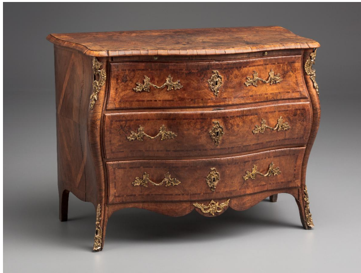
Kuva 6. Pähkinäpuinen mahapiironki messinkilistoilla ja pronssiheloituksilla 1760-luvulta.