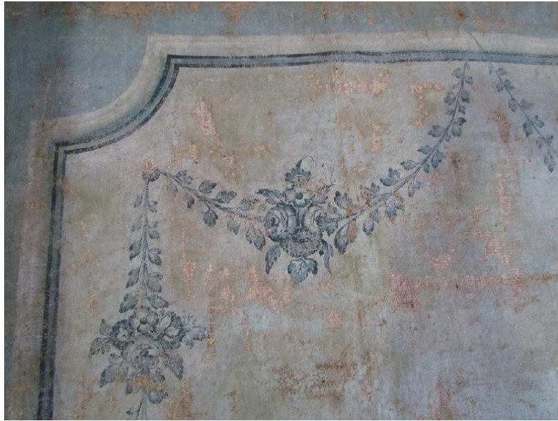
Kuva 10. Pellava- tai hamppukankaalle öljymaalilla maalattu tapetti, jossa on ajalle tyypillisiä symmetrisiä kukkakuvioita. Valmistettu 1790-luvulla.