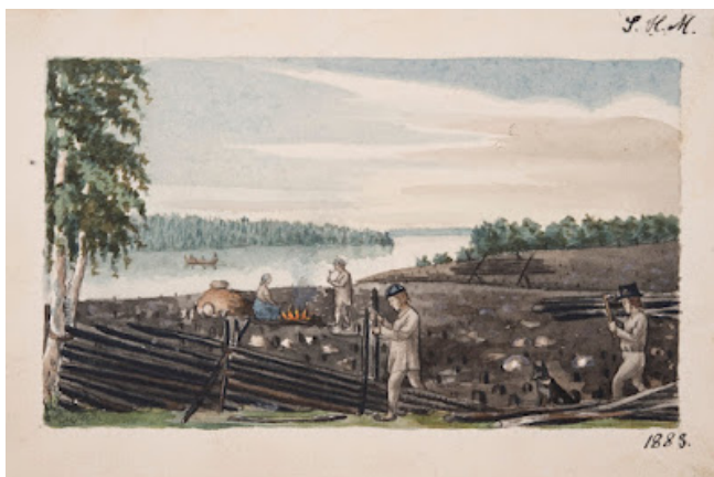
Magnus von Wrightin (1805–1868) akvarelli kuvaa aidantekoa ja kaskimaata 1800-luvun Viipurin läänissä.

kun tuoremmassa kotimaisessa tutkimuksessa Suomi on asemoitu länsi- ja itäeurooppalaisen perhe- ja kotitalousmallin väliselle raja-alueelle.