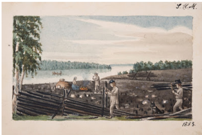
Magnus von Wrightin (1805–1868) akvarelli kuvaa aidantekoa ja kaskimaata 1800-luvun Viipurin läänissä.

kun tuoremmassa kotimaisessa tutkimuksessa Suomi on asemoitu länsi- ja itäeurooppalaisen perhe- ja kotitalousmallin väliselle raja-alueelle.