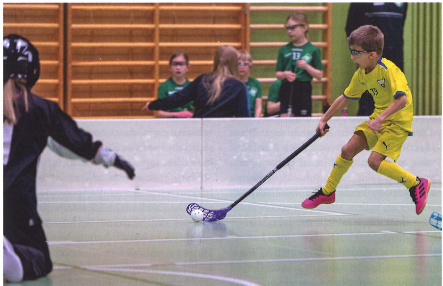
Liikuntataidot ovat portti harrastamiseen

Taitojen oppimisessa on vallalla kaksi koulukuntaa; informaation prosessointimalli ja ekologinen malli. Informaation prosessointimallissa keskiössä on opetettava taito. Toistomäärät, spesifisyys, etukäteen määritelty suoritustekniikka, virheiden välttäminen ja korjaaminen sekä jatkuva vaatimustason nosto ovat tunnuspiirteitä tälle ajattelulle. Informaation prosessointiteoriassa ihmistä verrataan tieto-