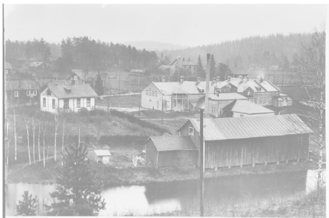
Yksi Kirvun neljästä huopatehtaasta.