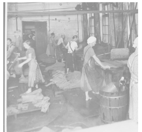
Huopatossujen tamppausta Kirvun huopatehtaalla.