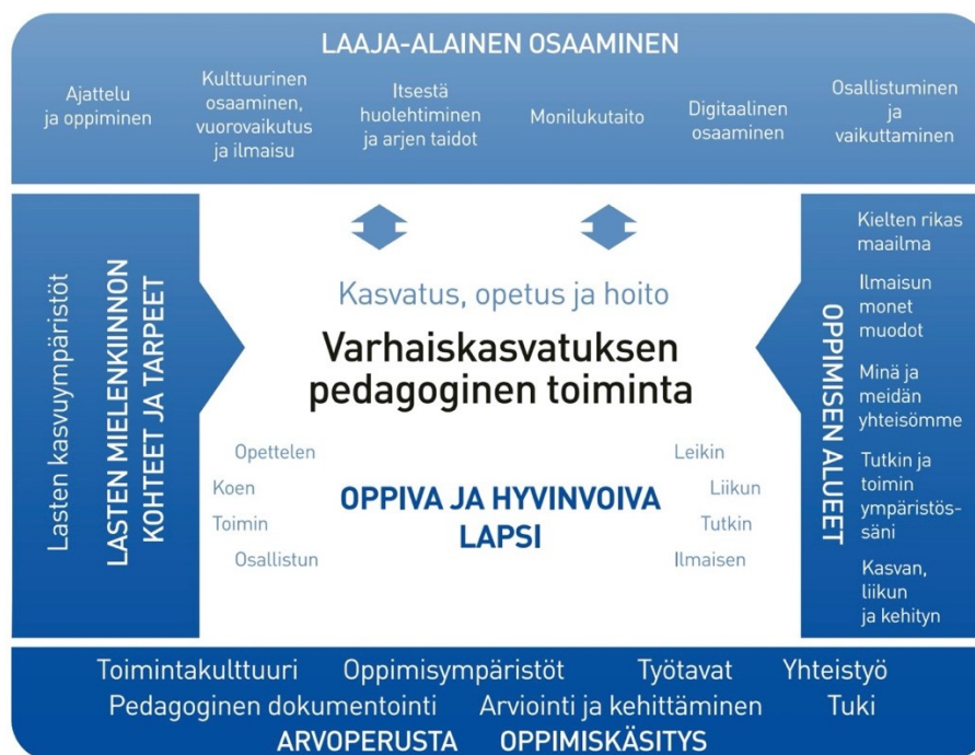
Kuvio 1. Varhaiskasvatuksen taidekasvatuksen toiminta