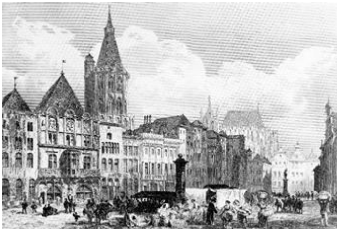
Kuva 1. Kölnin Alter Markt -tori (n. 1850), taustalla tuomiokirkko.