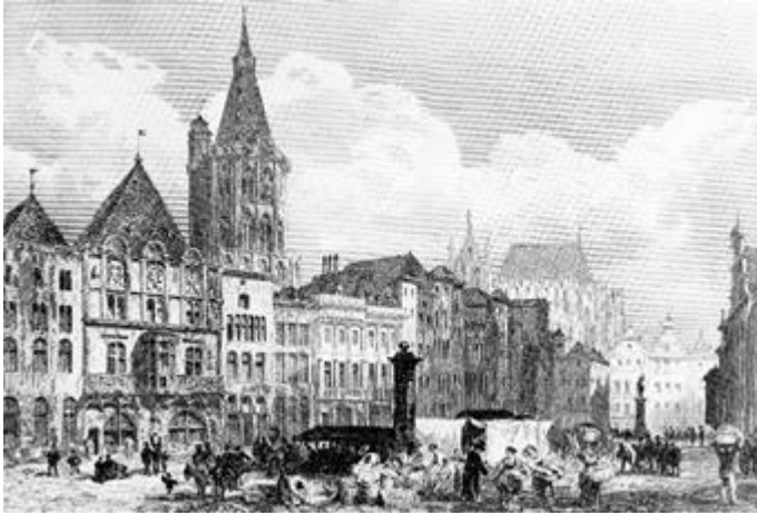
Kuva 1. Kölnin Alter Markt -tori (n. 1850), taustalla tuomiokirkko.