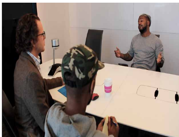
Työpaikkahaastattelussa (kuvakaappaus, YouTube).