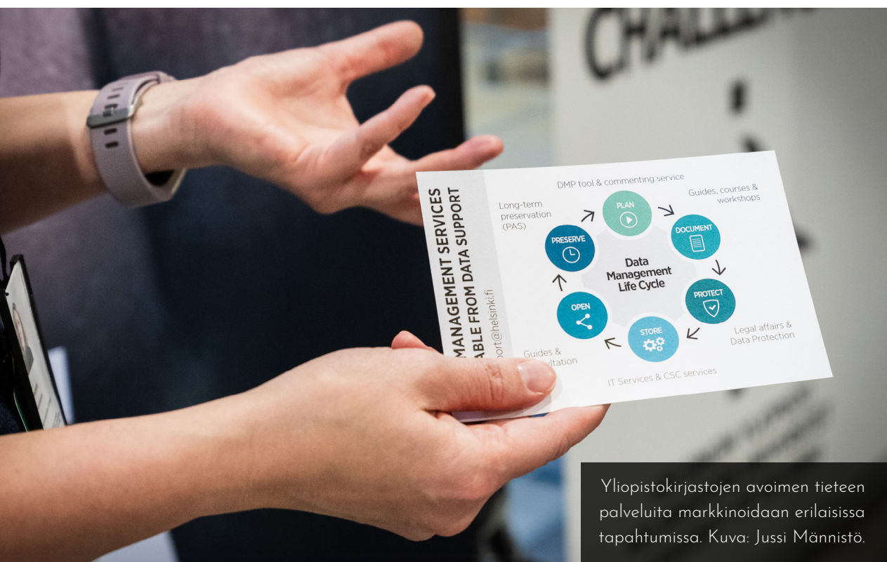
Yliopistokirjastojen avoimen tieteen palveluita markkinoidaan erilaisissa tapahtumissa.

Useimmissa AVOTT:n linjauksissa on nostettu esiin tutkijoiden ja opettajien meritoituminen. Tähän on Itä-Suomen yliopistossa pyritty löytämään vastauksia kansainvälisessä yhteistyössä YUFE-yliopistoallianssin (Young Universities for the Future of Europe) YUFERING-hankeessa (YUFE Transforming R&I through Europe-wide Knowledge Transfer). Hankkeessa on laadittu tutkijaportfolio esimer-