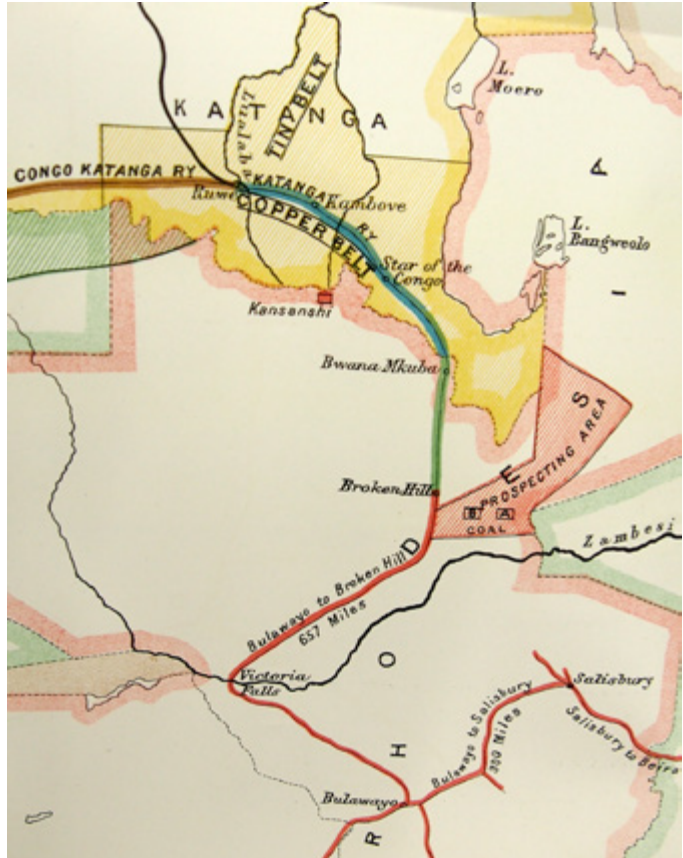
■ Kartta 1. Karttaan punaisella merkitty rautatie ulottui Bulawayoon (alareunassa) saakka 1897, mutta kesti vuoteen 1909 ennen kuin rautatie ulottui Katangan kuparikentille (keltaisella). Tämän jälkeen Katangan kupari voitiin kuljettaa rautateitse Bulawayon ja Beiran (oikealla) kautta Britannian markkinoille.

Eteläisen Afrikan luonnonvarojen taloudellinen hyödyntäminen painottui kaivostoimintaan ja malmien etsintään, joihin Etelä-Afrikan kauppakomppania omasi monopolioikeudet Sambesin pohjoispuoleisilla alueilla vuodesta 1889 vuoteen 1924 saakka. Vuosien 1901–1906 välisenä aikana kauppakomppania hallinnoi myös Katangan mineraaleja belgialaisen Comité Spécial du Katangan kanssa tehdyn sopimuksen ansiosta. 33 Kauppakomppania suosi Katangassa suuria ja hyvin organisoituja, malmien etsintään varustettuja retkikuntia, joilla uskottiin olevan resurssien puolesta paremmat mahdollisuudet toimia eurooppalaisille usein epäterveellisessä ympäristössä kuin yksittäisillä malminetsijöillä. Erityisen merkittäviksi muodostuivat Tanganyika Concessions -yhtiön vuosina 1899–1906 Bulawayosta Katangaan organisoimat kolme retkikuntaa, joista Eriksson osallistui toiseen (huhtikuu 1901–marraskuu 1902) ja kolmanteen (kesäkuu 1903–elokuu 1906). 34