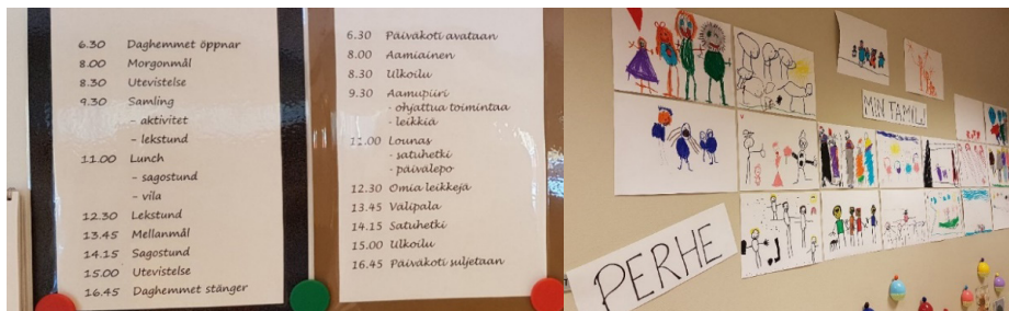
KUVA 1. Tekstejä kahdella kielellä kielirikasteista (suomi–ruotsi) varhaiskasvatusta toteuttavan ryhmän fyysisissä oppimisympäristöissä.

Fyysiseen ympäristöön voidaan tuki lisätä myös kuvia, tekstejä tai kirjoja, joilla stimuloidaan kaksikielisen opetuksen kohdekielen käyttöä (ks. myös From ym. tässä teemanumerossa).