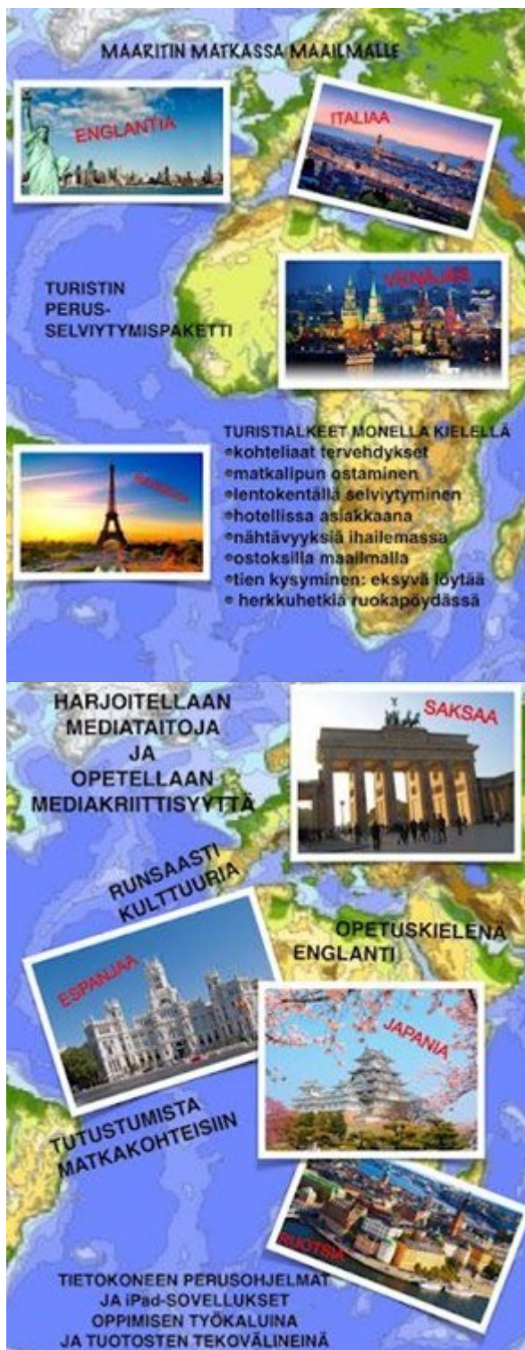
Kuva 3. Julisteet esittelevät Act Globally -kansainvälisyyskasvatuksen ja turistikielten valinnaisineen.

Toinen vaihtoehto olisi edistää yhteistyötä eri koulujen välillä. Esimerkiksi jos kaksi tai kolme koulua tarjoaa saman valinnaisen kielen, voitaisiin harkita näiden koulujen oppilaiden yhdistämistä yhteiseen ryhmään. Tällä toimenpiteellä voitaisiin varmistaa valinnaisen kielen ryhmän toteutuminen. On kuitenkin tärkeää, että koulut sijaitsevat riittävän lähellä toisiaan, jotta oppilaiden siirtymiseen ei kulu liikaa aikaa, ja että siirtyminen tapahtuu turvallisesti.