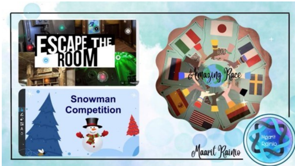
Kuva 1. Digitaalisia tehtävätyyppejä.

Suunnittelemani pakohuonepeli Escape the Room vie oppilaat jännittäville seikkailuille ympäri englanninkielistä maailmaa, kun he ratkovat seuraavia lukkojen takana piileviä arvoituksia ThingLink -alustalla: