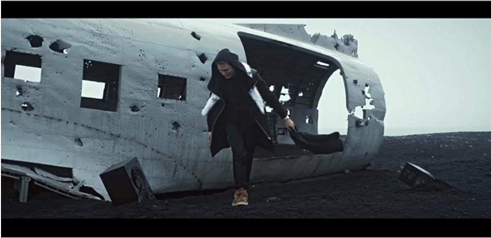
Kuva 2. "Ääri rajoille"-videossa keskeisen symboliikan luo tuhoutunut lentokone, jonka luota Cheek aloittaa lipun kuljettamisen vuoren huipulle subliimin luontokuvaston keskellä. Kuvakaappaus "Ääri rajoille"-videosta (2014) Liiga Musicin YouTube-kanavalta.

kertoo itsestään merkityksellistääkseen elämänsä tapahtumia. Musiikkivideossa henkilökohtainen narratiivi on reflektiossa muodostuva rekonstruktio. Merkityksellistämällä valitsemansa tapahtumat keskeisiksi ja ohittamalla toiset, kertoja luo itselleen ja toisille tulkinnallisen viitoituksen (engl. navigational beacons ) menneistä ja tulevista tapahtumista. Musiikkivideon mahdollistama henkilökohtainen narratiivi on siten vahvasti performatiivinen. (Mt.) "Ääri rajoille"-videon poeettisessa ja visuaalisessa kokonaisuudessa konkretisoituu Cheekin tuotannolle leimallinen asenne, jossa taiteenlajiin kohdistuva rakkaus saa rikkomaan kategorioiden rajoja. Kuten kappale sanoittaa: "rohkeus ei oo sitä ettei pelota / vaan et uskaltaa hyppää, vaik ei tiedä selviikö elossa". Teknisesti musiikkivideon ratkaisu mahdollistaa kaksi tarinalinjaa: luonnon armoilla ääri rajoja tavoittelevan Cheekin ja pojan yksinäiseen huoneeseen sijoittuvan analogisen tarinan omaan asiaan uskomisesta. Tulkitsen valittujen tapahtumien kokonaisuuden korostavan taiteenlajiin kohdistuvaa rakkautta ja sen tuottamaa elämän merkityksellisyyden tunnetta myös resonanssin ja jatkuvuuden kautta.