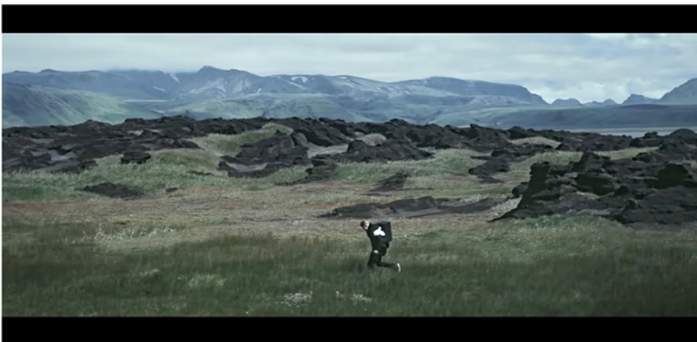
Kuva 3. ”Ääri rajoille”-videon visuaalisuus perustuu vaikuttaviin vuoristomaisemiin, joiden keskellä korostuu artistin yksinäinen hahmo. Kokonaisuus yhdistyy taiteenfilosofiassa subliimin käsitteellä kuvattuihin tunnekokemuksiin. Kuvakaappaus ”Ääri rajoille”-videosta (2014) Liiga Musicin YouTube-kanavalta.