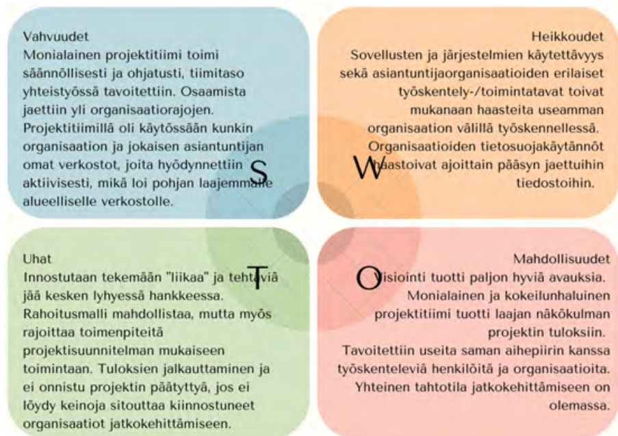
Kuvio 4. Projektitiimin tiivistetty näkemys ja kokemus työskentelystä hankkeessa.

man alueellisen verkoston syntyminen ja hyödyntämisen hankkeessa. Kolmen eri organisaation erilaiset toimintatavat, tietosuojakäytännöt ja sovellusten ja järjestelmien yhteiskäyttöisyys nähtiin itsearvioinnissa yhtenä heikkoutena. Innostava yhteinen työskentely projektitiiminä tuotti paljon uusia avauksia, mikä nähtiin myös yhtenä uhkana. Alkuperäiset tiedostot on tallennettu joko JAMK:n Onedrive kansioihin tai tutkimusten osalta IDA-järjestelmään. Jaetut kansiot ja tiedostot eivät aina toimineet kaikille ja jakamista jouduttiin tekemään useaan kertaan, mikä koettiin yhtenä heikkoutena projektin työskentelyssä. Myös Teams-alustan vaihtaminen kesken työpäivän koettiin ongelmalliseksi ja sen käytöstä luovuttiin (Teams-tiiminä). Hankkeen rajalliset resurssit ja hanke-suunnitelma tuli pitää mielessä, eikä kaikkia hyviä ideoita voitu hankkeen puitteissa toteuttaa. Itsearvioinnissa pohdittiin myös sitä, että jäävätkö hankkeen tuotokset ja tulokset hyödyntämättä hankkeen jälkeen, jos ei löydy rahoitusta ja tahtoa jatkokehittämiselle. Projektitiimillä on kuitenkin vahva kokemus ja näkemys, että jatkokehittämiseen on keskusomalaisilla simulaatiotoimijoilla yhteinen tahtotila, ja SimO-hankkeen pohjalta kirjoitetaan jatkohankehakemus vuoden 2023 aikana.