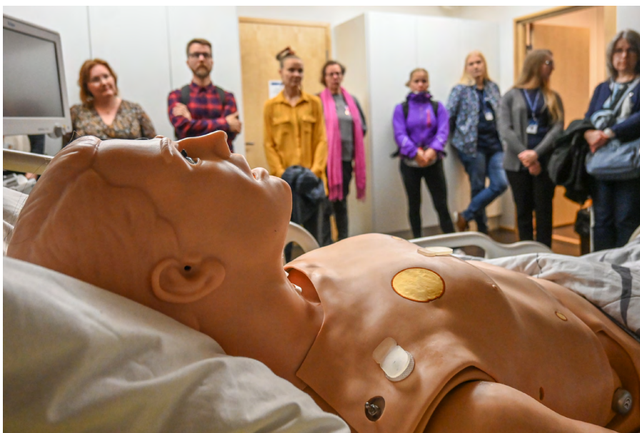
Kuva 1. Työpajan yhteydessä tutustuttiin erilaisiin simulaatiotilaan. Valokuvaaja Juho Jäppinen.