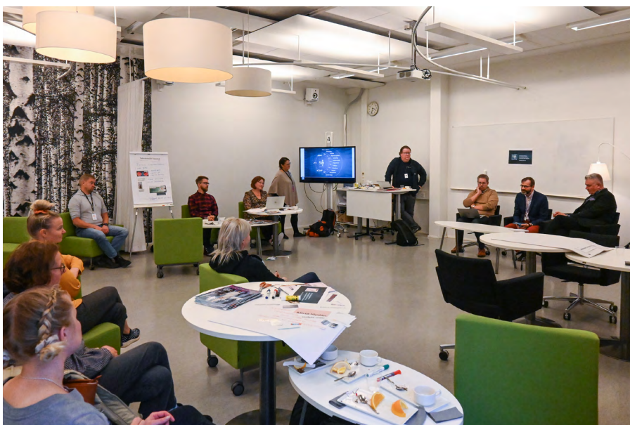
Kuva 2. Toisessa työpajassa visioitiin Tulevaisuuden sanomia ja annettiin ideoiden lentää.