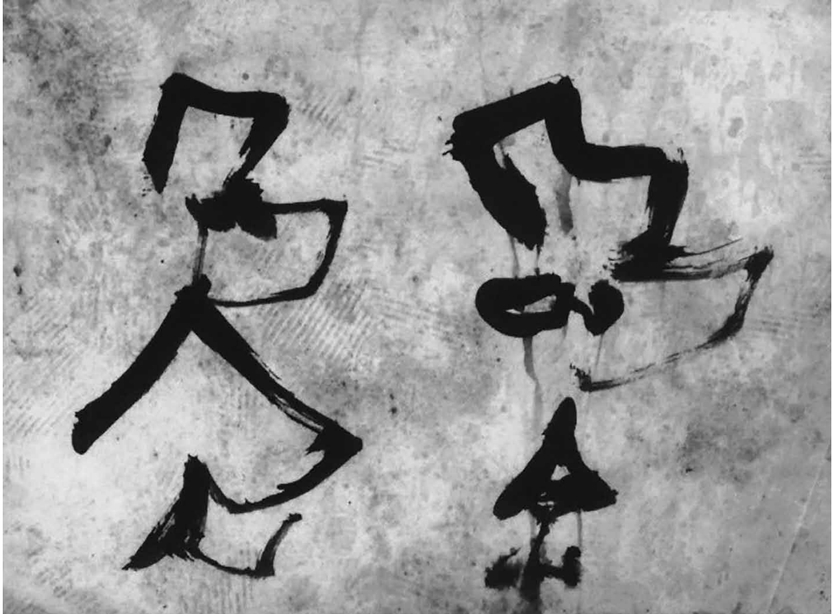
Kuva 1. Dotremontin varhainen piirros saamelaisista vuodelta 1962 (Walecka-Garbalinska 2015, 52).

Puutteistaan huolimatta matkakirjoituksilla on dokumentaarisia ansioita ja siten kulttuurihistoriallista arvoa. Saamenmaata käsittelevissä teksteissään Dotremont havainnoi luontoa, maisemia ja toislajisia – luoden yhteyksiä näkemänsä ja kirjoituksen elementtien välille. Hän oli kiinnostunut alueen geologiasta ja sääolosuhteista, mikä lisäsi tekstien kytköksiä tiettyyn alueelliseen erityislaatuisuuteen. Dotremontilla todellinen ympäristön havainnointi sulautuu kuvitteellisen pohjoisen kokemukseen ja aistikokemuksen rajoilla tapahtuvaan kokemukselliseen ”uppoutumiseen”, kuten ”Sevettijärvelle”-tekstin keskenään limittyvät todellisuuskokemukset ilmentävät.