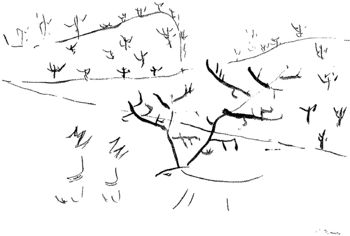
Kuva 4. Vuonna 1961 toteutettu esilogogrammi Saamenmaalta (Dotremont 2011, 23).