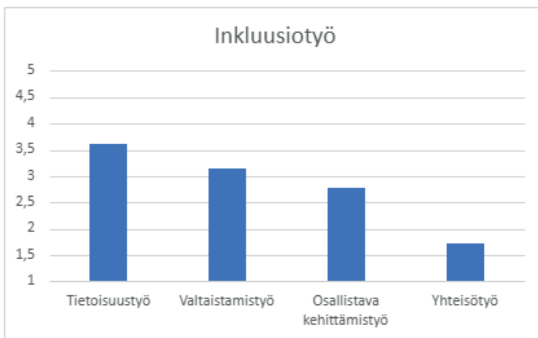
Kuvio 2. Inklusiotyö (asteikko: 1=en koskaan, 2=harvoin, 3=silloin tällöin, 4=usein ja 5=jatkuvasti)

Inklusiotyöhön liittyvissä väittämissä sisään rakennettuna ajatuksena oli, että rakenteelliseen sosiaalityöhön sisältyvä vaikuttamistoiminta tapahtuu Mullalyn (2007) rakennejaottelun sosiaalisten suhteiden tasolla (ks. luvut 2.1 ja 4.3). Analyysin perusteella inklusiotyö jakautui neljään osa-alueeseen: tietoisuustyö, valtaistamistyö, osallistava kehittämistyö ja yhteisötyö. Tietoisuustyön tavoitteena on yhteisten keskusteluiden ja tiedottamisen avulla vahvistaa asiakkaiden tietoisuutta heidän elämäntilanteiden rakenteellisista syistä ja lisätä tietoa erilaisista osallistumisen mahdollisuuksista, kuten vertaistuesta ja osallisuutta tukevasta yhdistystoiminnasta. Tietoisuustyötä tehdään kaikista inklusiotyön, mutta myös kaikista rakenteellisen sosiaalityön osa-alueista useimmin, keskimäärin usein (ka. = 3,6; ks. kuvio 2). Lähes puolet (43,9 %) sosiaalityöntekijöistä tekee tietoisuustyötä usein tai jatkuvasti ja vajaa 14 prosenttia vain harvoin. Asiakastyötä tekevät sosiaalityöntekijät toteuttavat tietoisuustyötä hiukan useammin (ka. = 3,4) kuin johtavat sosiaalityöntekijät (ka. = 3,3).