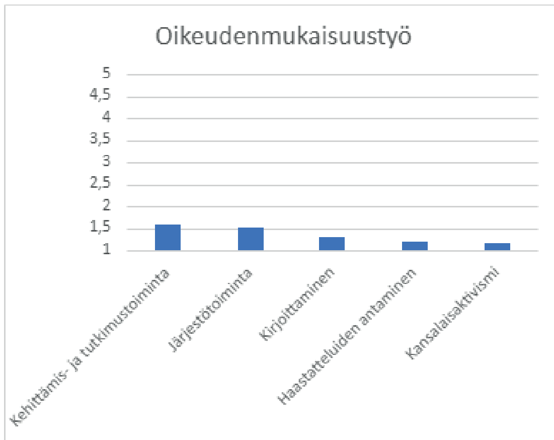
Kuvio 4. Oikeudenmukaisuustyö (asteikko: 1=en koskaan, 2=1–3 kertaa kolmessa vuodessa, 3=4–6 kertaa kolmessa vuodessa, 4=7–9 kertaa kolmessa vuodessa ja 5=10 kertaa tai useammin kolmessa vuodessa)

toimimalla itse kehittämis- tai tutkimushankkeessa, ideoimalla kehittämis- tai tutkimusaiheita yhdessä kehittäjien tai tutkijoiden kanssa, osallistumalla kehittämis- tai tutkimushankkeisiin informantin roolissa sekä pitämällä puheenvuoroja seminaareissa ja kokouksissa. Huomattavan suuri osuus (37,3 %) sosiaalityöntekijöistä ei kertomansa mukaan ollut viimeisen kolmen vuoden aikana osallistunut kehittämis- tai tutkimustoimintaan lainkaan – näin siitäkkin huolimatta, että he parhaillaan olivat vastaamassa tutkimuskyselyyn. Kehittämis- ja tutkimustoimintaan osallistuminen on jonkin verran yleisempää johtavien sosiaalityöntekijöiden (ka. = 1,9) kuin asiakastyötä tekevien sosiaalityöntekijöiden (ka. = 1,4) keskuudessa ( p < ,001 ). Kuitenkin reilu viidesosa (22,8 %) johtavista sosiaalityöntekijöistä ilmoitti, että he eivät ole tehneet tätä oikeudenmukaisuustyön muotoa viimeisen kolmen vuoden aikana.