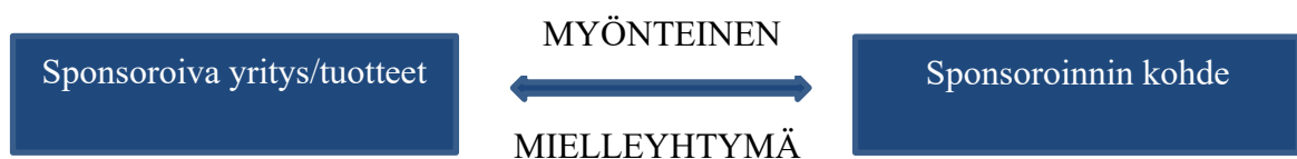
KUVA 2. Sponsoroinnin kohteen valinnan lähtökohta (Alaja 2000, 112).

Yritykset valitsevat sponsoroinnin kohteensa erilaisin tavoin ja perustein. Peruslähtökohta sponsoroinnin valinnassa yleensä on, että yritys pyrkii luomaan myönteisen miellelyhtymän yrityksensä ja sponsoroinnin kohteen välille (kuva 2). Onnistuneessa sponsoroinnissa sponsoroinnin kohde viestii yrityksen kanssa samoista arvoista ja kohteen avulla yritys voi välittää kohderyhmille sanomaansa. (Alaja 2000, 111, 112) Jotta sponsorointi olisi onnistunutta ja luontevaa, yrityksen arvojen ja mielikuvien tulisi olla samat kohteeseen liitettävien arvojen kanssa (Aaker 2000, 301; Gwinner & Eaton 1999, 47).