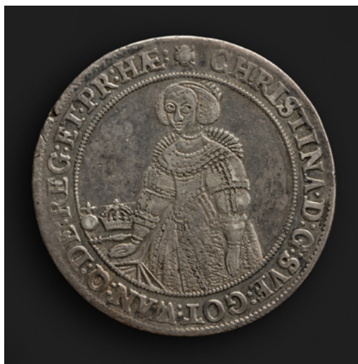
■ Kuva 1. Kuningatar Kristiina vuonna 1640 lyödyssä riikintaalerissa. Kuvälähde: Suomen Kansallismuseo, Antellin kokoelma CC BY 4.0.

Esittelemme tässä artikkelissa apuvälineen, jonka tarkoitus on helpottaa monivaluuttaisuudesta tutkimukselle aiheutuvia ongelmia. Olemme yhdistäneet hajallaan olevat valuuttakurssitiedot vapaasti verkossa saatavilla olevaksi Suomen esiteollisen kauden valuuttamuunnin (1534–1880) -tietokannaksi. Se sisältää Suomen alueella esiteollisena aikana käytössä olleiden tärkeimpien kotimaisten valuuttojen keskinäiset valuuttakurssit. Tärkeys viittaa valuuttayksiköihin, joita virallisuontoisissa alkuperäislähteissä, kuten verohinnastoissa, perukirjoissa ja veronmaksuluettelossa, tyypillisimmin esiintyi. Ehdotamme lisäksi erilaisten raha-arvojen yhteismitallistamisen ongelman ratkaisuksi rahallis-