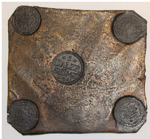
■ Kuva 2. Kupariplootu vuodelta 1650 arvoltaan yksi taaleri hopearahassa (daler silvermynt). Kuvallähde: Turun museokeskus CC BY 4.0.

Taalerin ympärille kehittyivät tilivaluutat daler silvermynt , daler kopparmynt , daler courant ja daler carolin . Alkuun daler kopparmynt oli kuparirahan ja daler silvermynt hopearahan yksikkö, mutta myöhemmin kuparirahaa voitiin laskea niin daler kopparmynteinä kuin daler silvermynteinä . Vuosien 1644–1776 aikana ploorurahaksi ( plätmynt ) painetut kuparirahat olivat hyväksytyt maksuväline. Plootut saattoivat painaa 0,378 kilogrammasta 19,7 kilogrammaan. Pelkkä termi plootu ( plåt ) viittasi vuoden 1715 jälkeen kahteen hopeataaleriin kupariplootuna. Rahat, joista suomalaisessa tutkimuksessa on totuttu käyttämään nimityksiä hopeataaleri ( daler silvermynt ) tai kuparitaaleri ( daler silvermynt ) olivat siis kirjanpidollisia tilivaluuttoja. Mikäli maksu suoritettiin fyysisillä hopearahoilla, käytettiin siitä 1600-luvun puolivälistä lähtien ensin termiä daler silvermynt i specie tai daler silvermynt i vitt mynt ja hieman myöhemmin termejä daler courant tai daler carolin . 14