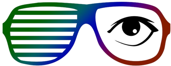
Funkify-simulaattori (avaa linkki Chrome-selaimessa)

Chrome-selaimeen on ladattavissa lisäosia, joilla voi tutkia verkkosivuja tai dokumentteja erilaisten toimintarajoitteiden näkökulmasta