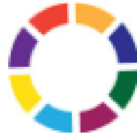
Web Disability Simulator (avaa linkki Chrome-selaimessa)