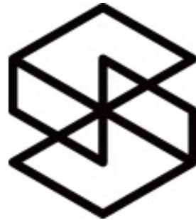
Silktide-simulaattori (avaa linkki Chrome-selaimessa)