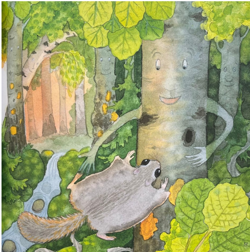
Kuva 5. Kirjailija Titta Kuisma. Kuvittaja Laila Nevakivi. Lapsen oma metsäkirja . 2020. Sivü 51. Kustantaja Minerva Kustannus Oy.