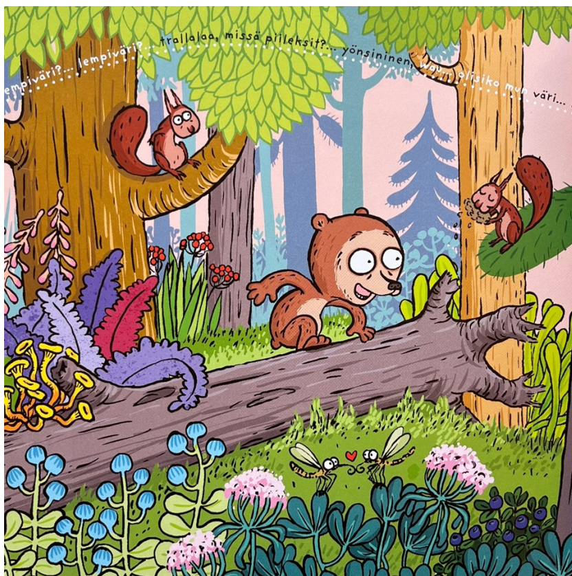
Kuva 1. Kirjailija/kuvittaja Christel Rönns.

Totti ja villit värit . 2022. Sivun 8. Kustantaja Lasten Keskus.