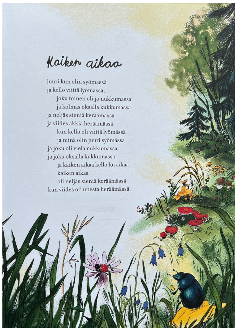
Kuva 3. Kirjailija Kirsi Kunnas. Kuvittaja Silja-Maria Wihersaari.