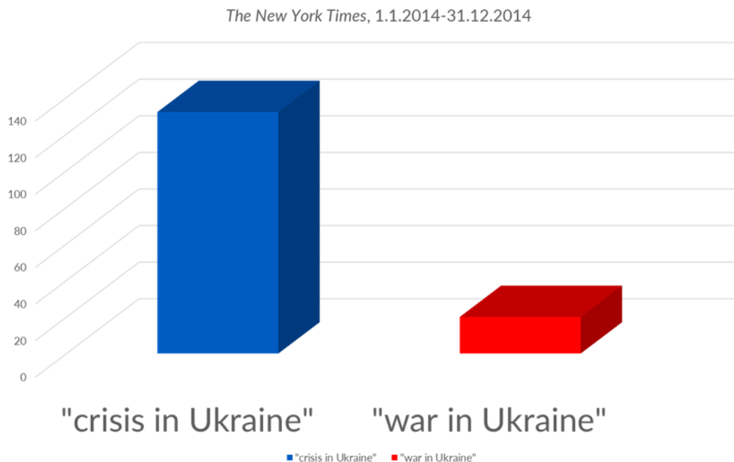
Kuva 3. Vuonna 2014 New York Times uutisoi Ukrainan tilanteen ”kriisinä”, ei ”sotana”. Koostanut Antero Holmila.

Yksi tällainen jatkokysymys on se, että missä määrin alttius käsitteellistää kaikki ongelmat ”kriiseiksi” sai meidät tulkitsemaan Venäjän vuonna 2014 aloittaneen sodan täysin väärin. Janet Roitmanin mukaan kriisitulkinta on aina ulossulkeva siten, että se estää meitä hahmottamasta vaihtoehtoisia tulkintamalleja (Roitman 2013b). Koska Ukrainan tapauksessa välttelimme sota -terminologiaa ja korvasimme sen epämääräisellä kriisillä, loimme lännessä itsellemme sokean pisteen, joka vääristi ymmärrystä Venäjän toimien perimmäisestä luonteesta.