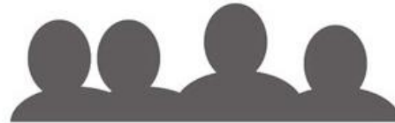
The expanding number of people from different backgrounds becoming involved with heritage buildings and repair issues

Kuva 1. Rakennusperintönäkemyksen laajenemisen neljä ilmenemismuotoa. Kuva: Iida Kalakoski.