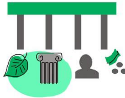
The versatile motivations for preservation, repair and reuse