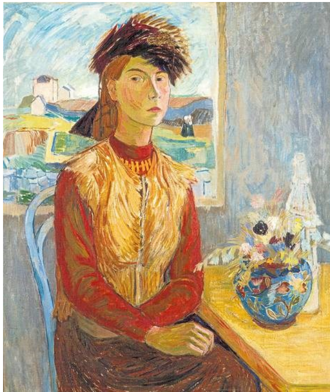
(Kuva 4) Tove Jansson Omakeuva karvalakissa, 1941, öljy.