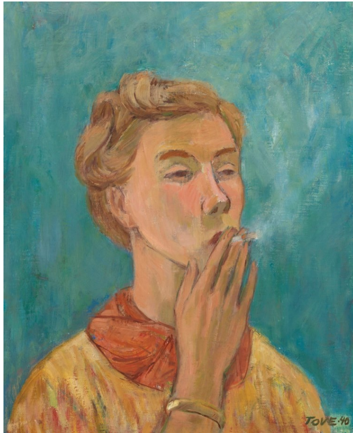
(Kuva 3) Tove Jansson Tupakoiva tyttö, 1940, öljy.

Tupakoiva tyttö -omakuvassa (Kuva 3) Jansson kuvaa itsensä polttamassa savuketta. Taustan hän on maalannut siniseksi, ja harmaanvaalea savu ikään kuin sulautuu taustan sinisiin sävyihin. Jansson on kuvassa pukeutuneena keltaoranssiin, hiukset ovat elegantisti ylhäällä ja lisäksi kättä koristaa kultainen rannerengas. Kuvasta välittyy itsevarmuus ja tietynlainen huolettomuus. Hän on maalannut itsensä polttamassa tupakkaa myös edellisenä vuonna 1939 omakuvassa Per il mio carissima Trinca 26 sekä freskossa Juhlat kaupungissa (1947). Taiteilijapiireihin kuuluvalla tavalla Janssonkin