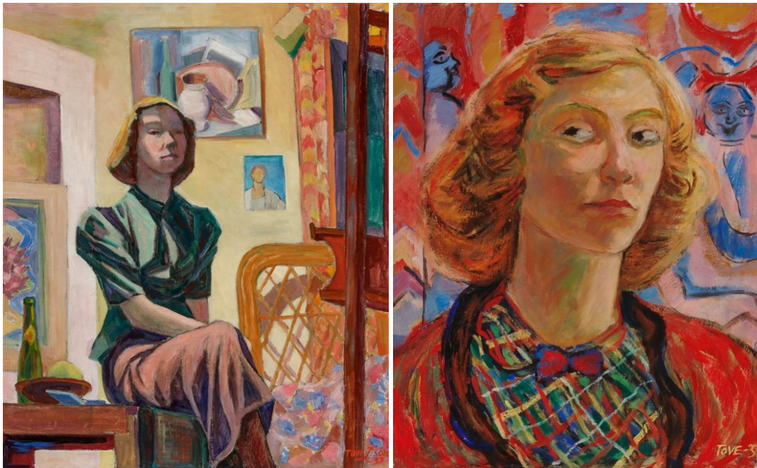
(Kuva 1) Tove Jansson Omakuva ja korituoli , 1937, öljy.