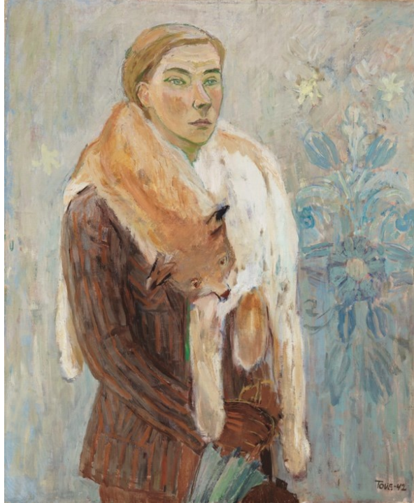
(Kuva 6) Tove Jansson Ilvesboa, 1942, öljy.

Ilvesboa -omakuvassa (Kuva 6) Jansson on maalannut yllensä ruskean raidallisen takin ja kaulan sekä rinnan peittävän suuren ilvesboan. Käsissään hänellä on ruskeat käsi- neet sekä sinivihreä sateenvarjo, ja hiukset ovat tiukasti takana kiinni. Tausta on hyvin vaalea ja siinä sekoittuu harmaan, sinisen, ja beigen sävyjä. Taustalta ei erotu muuta kuin sinisävyinen kukkakuvio. Tausta on hyvin seesteinen ja harmoninen ja asennosta ja ilmeestä välittyy tietynlainen arvokkuus ja rauhallisuus.