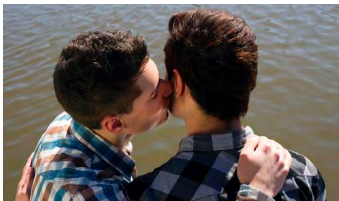
Kuva 7 Ylpeys - Identiteetistä ja seksuaalisuudesta nuorille miehille - oppaasta oppaan seksiä käsittelevästä osiosta kuvakaappaus, jossa näkyy kuinka homoja kuvataan siististi.

Havaintoni ei-heteroseksuaalisten marginalisoinnista seksuaalikasvatuksessa