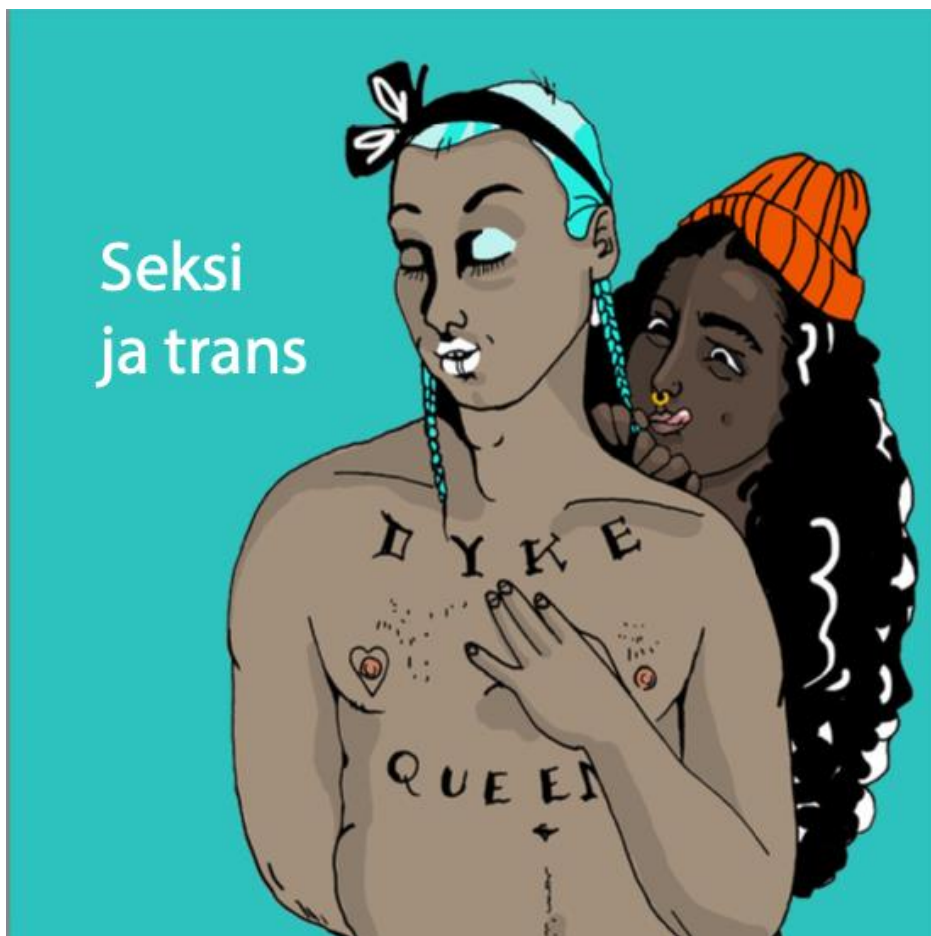
Kuva 5 Seksi ja trans -oppaan kannesta kuvakaappaus, jossa näkyy representaatioiden moninaiset intersektiot

Ylpeys-, Seksi ja trans- ja Anaaliseksi-oppaiden kohderyhmän ollessa pääasiassa muutkin kuin binääriset mies-nais heterot ja niiden representaatioiden ollessa melko monipuoliset ja muiden aineistojen ollessa heterokeskeisiä ja representaatioltaan kapeita rakentuu käsitys, että heteronormin ulkopuolelle marginalisoidut seksuaalisuudet ovat myös muilta ominaisuuksiltaan marginalisoitu normien ulkopuolelle. Tämä näkyy myös kuvassa 5. Esimerkiksi seksuaalisuudesta,