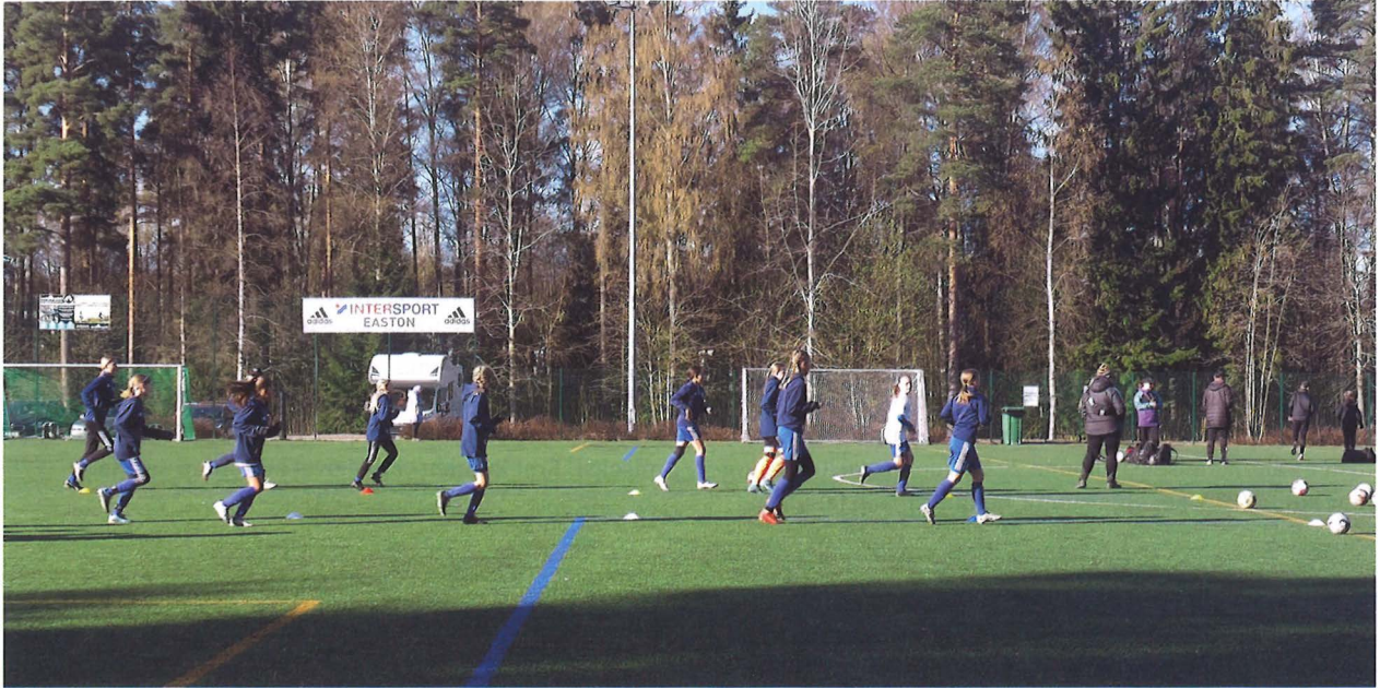
Kurkimäen kenttä Kontulan kupeessa on suosittu liikunta paikka.

yliopiston lehtori geotieteiden ja maantieteen osasto Helsingin yliopisto petteri.muukkonen@helsinki.fi