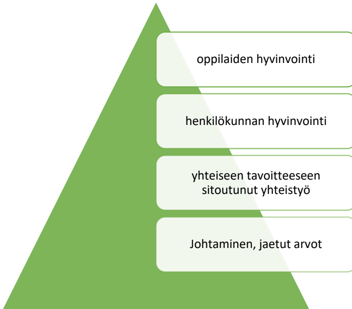
Kuva 2 Hyvinvointityön hierarkkinen malli, jossa hyvinvointityön eri osa-alueita tarkastellaan toisiinsa liittyvinä mutta erillisinä.