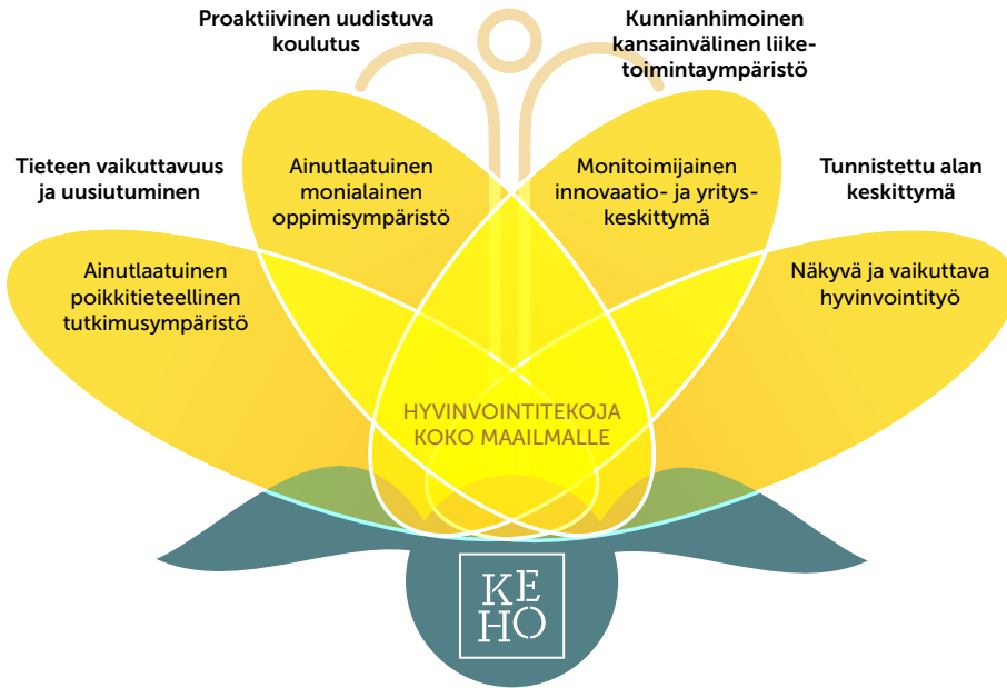
Kuvio 1 Keski-suomalainen hyvinvointiosaaminen tuottaa hyvinvointitekoja ja hyvinvointiosaamiseen pohjaavaa kasvua hyvinvointitalouden toimintamallin mukaisesti. (Kuvio julkaisusta Fadjukoff 2018, 25)