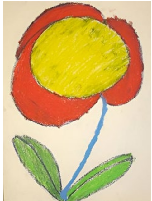
Kuva 15–16 Kukkakulkintoja samalta tekijältä. Helsingin kaupunginmuseo, Nikkilän sairaalan kokoelma, NSM I121 - EiNo; NSM I121 - EiNo.

Nikkilän kokoelman teoksissa esiintyvät kukkalajit eivät läheskään aina ole yksiselitteisesti nimettävissä, mutta selkeästi eniten teoksissa on kuvattu ruusuja ja onnen symboleina tunnettuja neliapiloita. Ruusuaiheissa huomiota kiinnittää usein piikkien tarkka kuvaus, mikä voimistaa vaikutelmaa ruususymboliikan kaksinaisesta luonteesta – kauneutta ja kipua.