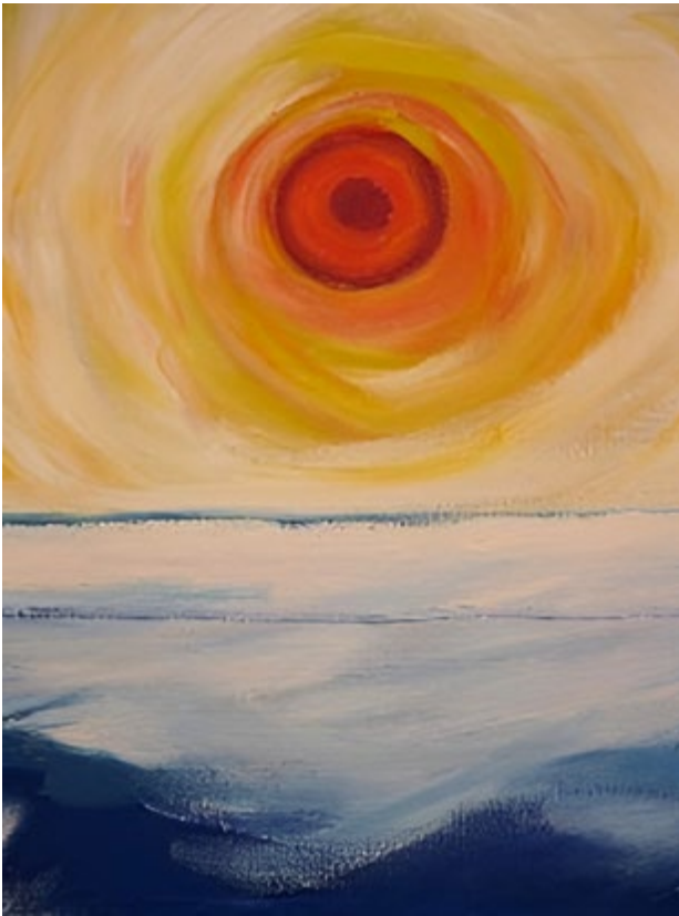
Kuva 12 Utuinen aurinko. Helsingin kaupunginmuseo, Nikkilän sairaalan kokoelma, NSM I121 - EiNo.

Päivittäin kävin tekemässä yli puolen tunnin kävelyretken. [...] Pimeyttä oli vaikea kestää. Ensimmäistä kertaa helmikuun valtava valo tuntui lähes välttämättömältä, koskaan aiemmin en ollut siitä niin iloinnut. (MKM 255–256.)