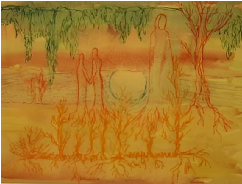
Kuva 8 Ihmiä juurtumassa maahan.

Monissa potilastöissä puiden maahan kuroutuvat juuret on kuvattu tarkasti, kuten myös kohti taivasta kurottelevat oksanhaarat. Nämä kuvat muistuttavat toisaalta ihmisen juurtuneisuudesta ympäristöönsä ja toisaalta halusta irtautua siitä. Joskus näyttääkin siltä, että puut ovat repimässä juuriaan irti maasta. Osalle potilaista sairaalajakso on saattanut merkitä etäisyyttä haasteelliseen elinympäristöön ja mahdollisuutta keskittyä omaan tilanteeseen neutraalissa ympäristössä ja sitä kautta myös muutosta, irtautumista aiemmasta elämästä ja kiinnittymistä johonkin uuteen.