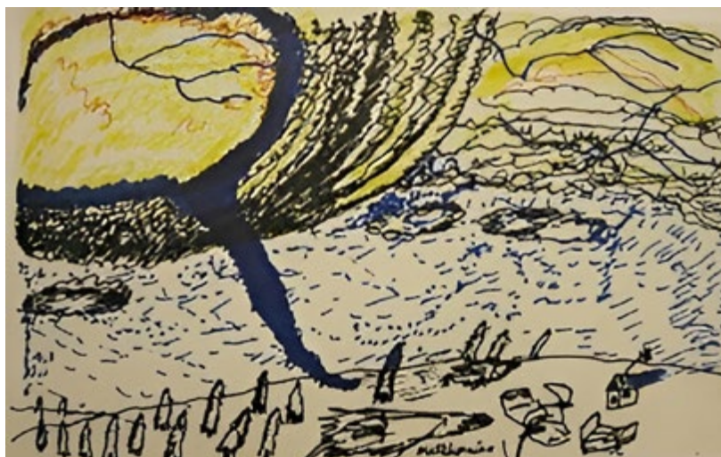
Kuva 10–11 Pyörremyrsky.

Myrskyaiheiden lisäksi Nikkilän teoksissa on kuvattu myös seesteisempiä luonnonilmiöitä ja -objekteja, kuten sateenkaarta ja aurinkoa. Teoksessa, jonka yhteyteen on liitetty sanat ”Nikkilän sateenkaari”, sateenkaaren värien järjestys ei täysin vastaa luonnossa ilmenevän sateenkaaren värijärjestystä, minkä voi mahdollisesti tulkita viittauksena Nikkilän sairaalaympäristössä tehtyihin poikkeuksellisiin havaintoihin ja niiden pohjalta syntyneisiin uudenlaisiin väriyhdistelmiin.