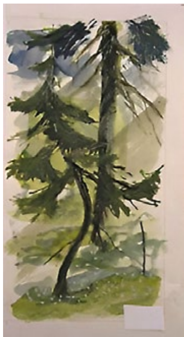
Kuva 6 Suora ja kaareva puu.

maiseman muutoksen tarkkailuna että oman tilanteen käsittelynä etäännytetysti luonnon-symboleiden kautta. Aina ei kuitenkaan ole selvää, onko tietty kuva tarkoitettu tulkittavaksi symbolisesti vai onko kyse puhtaasti luontokuvista vailla syvempää symbolista merkitystä.