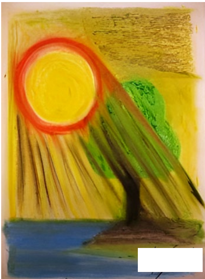
Kuva 13 Aurinko riippuvine säteineen. Helsingin kaupunginmuseo, Nikkilän sairaalan kokoelma, NSMI121 - EiNo, 1979.