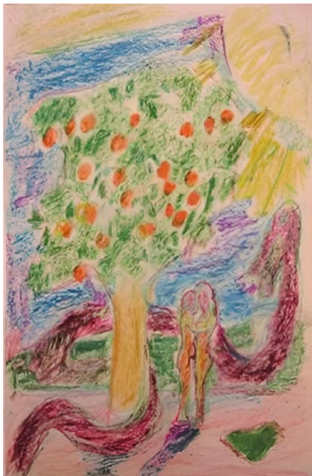
Kuva 9 Aatami ja Eeva omenapuiden katveessa.