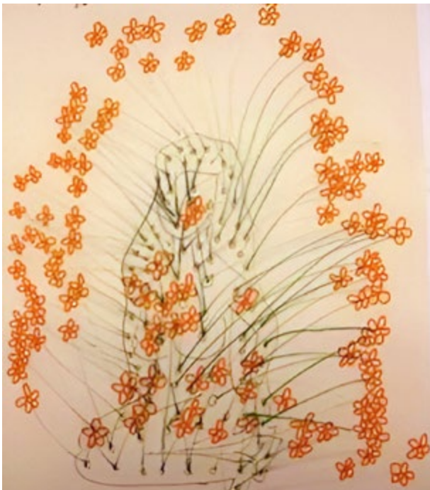
Kuva 14 "Vedenalainen kukkaistytö". 1980.

Sekä suomalaisessa että saksalaisessa potilastaiteessa kukka- ja kasviaiheisiin on liitetty mielikuvia kasvusta ja elinvoimasta, mikä on korostunut, kun aiheisiin on yhdistetty esimerkiksi aurinkosymboliikkaa. Kun osa Nikkilän kuvista perustuu tekijöidensä omiin tulkintoihin kasviaiheista, on osa teoksista kopioita tunnettujen taiteilijoiden teoksista. Teoksissa on