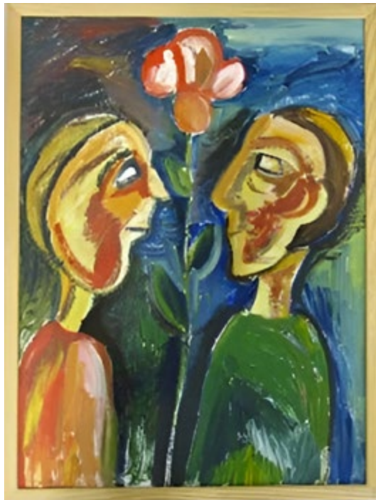
Kuva 18 Kukka ihmisten välillä.

too tunteista ihmisten välillä. Eräässä Nikkilän kokoelman teoksessa tyyllitelty nais- ja mieshahmo on asetettu vastatusten keskellä punertava kukka. Kuvaustapa muistuttaa Johannes Linnankosken (1869-1913) teosnimestä Laulu tulipunaisesta kukasta (1905) ja Munchin Silmätysten -teoksesta (1899-1900), jossa hahmojen väliin on asetettu puunrunko. Näissä kaikissa teoksissa ihmisten keskinäistä vetovoimaa kuvataan luonnonsymboliikan avulla.