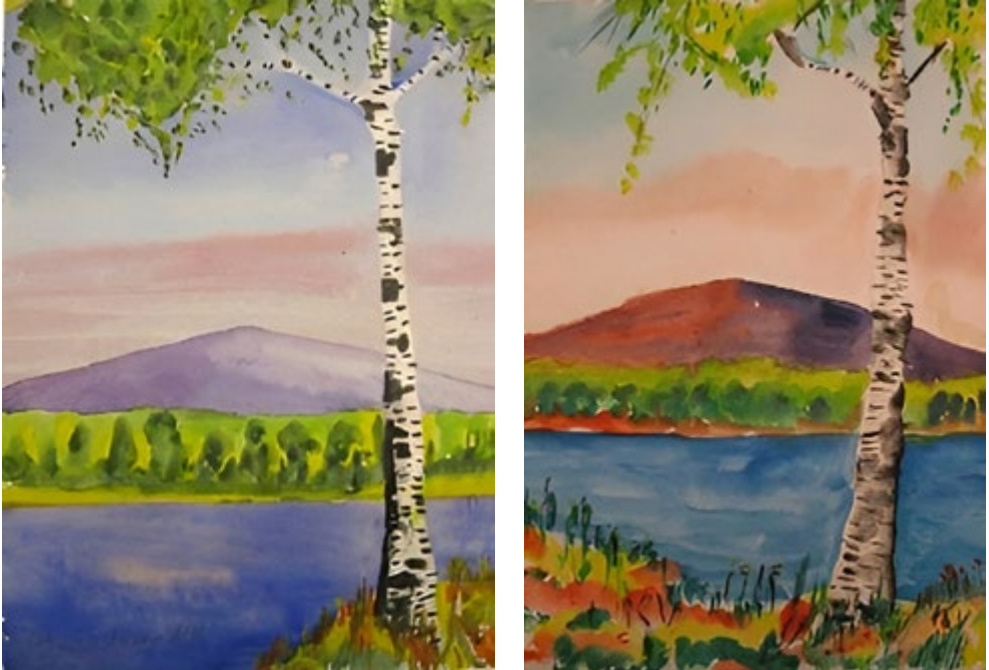
Kuva 4–5 Variaatioita puuteemasta. Helsingin kaupunginmuseo, Nikkilän sairaalan kokoelma; NSM I121 – 1472; NSM I121 – EiNo.

vimmaksi hahmoksi laajemman maiseman asettuessa taustaksi. Toisinaan puiden muotoja on abstrahoitu voimakkaasti ja puunlehdet on väritetty kirkkain satukirjakuvituksista muistuttavin sävyin. Joskus taas taustamaisemien värit ovat korostuneen voimakkaita ja draamattisia, jolloin mustanpuhuvat puut piirtyvät selkeärajaisina esiin taustaa vasten, mikä herättää muistumia esimerkiksi Hugo Simbergin (1873–1917) värienkäytöstä. Yksinäisiä, kiemuraisia ja murtuneita puita ovat kuvanneet paitsi potilastaiteilijat, myös monet kultakauden taiteilijat, kuten Gallen-Kallela, jonka erämaakuvauksia on usein tulkittu suomalaisuuden näkökulmasta.