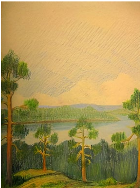
Kuva 1 Korkealta nähty järvimaisema.

potilaina olleet ovat halunneet keskittyä oman elämänsä kannalta merkityksellisiin maisemiin – todellisiin, muistettuihin tai kuviteltuihin. Kuvantekeminen saattaakin liittyä tarpeeseen irtautua sairaalaympäristöstä ja kurrottautua kohti sitä, mikä itselle näyttytyy tärkeänä ja voimauttavana.