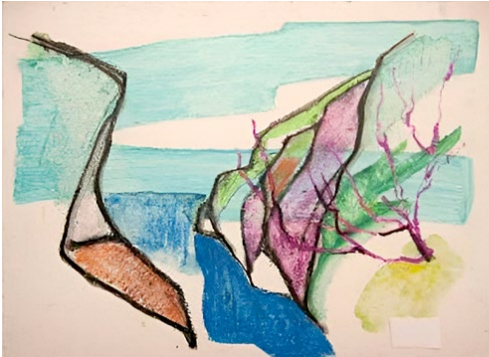
Kuva 3 Abstrahoitu maisema. Helsingin kaupunginmuseo, Nikkilän sairaalan kokoelma, NSM I121 - 3240, 1970.

Joskus kuun rinnalle on Nikkilän teoksissa asetettu myös tähtiä tai planeettoja, joista varsininkin jälkimmäiset ovat suomalaisessa taiteessa suhteellisen harvinaisia aiheita. Eräässä Nikkilän kokoelman teoksessa planeetta renkaineen hohtaa metsän rajassa, ja taustalla näkyy tähtitaivasta. Planeettasymboliikka herättää assosiaatioita esimerkiksi astrologiasta ja spirituaalisuudesta.