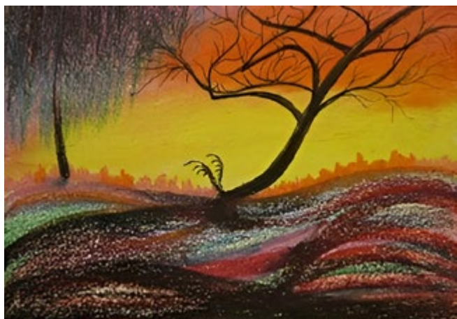
Kuva 7 Puu irtautumassa juuriltaan. Helsingin kaupunginmuseo, Nikkilän sairaalan kokoelma, NSM I121 - EiNo.

Eräessä Nikkilän kokoelman akvarellissa on asetettu rinnakkain kaksi puuta, joista toisella on suora ja vankka runko ja toinen on kitukasvuisempi, rungoltaan kiemuraisempi. Kiemurainen puu tuo asetelmaan ornamentaalisuutta. Valon siivilöityminen oksien välistä luo miltei monokromaattiseen teokseen vaikutelman merkityksellisyydestä ja herättää mielle yhtymiä identiteetin pohdinnasta vastakohtaisten puiden rinnastamisella. Toisessa teoksessa rankka sadekuuro taas erottaa kaksi mäntyä toisistaan. Kummassakin teoksessa puuhahmot muistuttavat symboliikkansa kautta jännitteisistä suhteista ihmisten välillä.