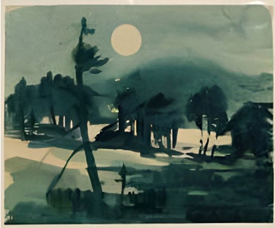
Kuva 2 Kuutamo metsikössä. Helsingin kaupunginmuseo, Nikkilän sairaalan kokoelma, NSM I121 – 449.

risontin takaa tummien sävyjen hallitsemassa maisemassa – metsikössä tai vesistön äärellä. Joskus kuun kuvajainen heijastuu vedestä ja muodostaa pylväsmäisen kuvion. Vastaavanlaisia pylväsmäisiä kuukuvauksia myös voi kohdata myös monien pohjoismaisten symbolistitaiteilijoiden, esimerkiksi Munchin ja Gallen-Kallelan teoksissa. Nikkilän teoksissa kuutamoiden värisävyt vaihtelevat valkoisesta keltaiseen, punertavaan, vihertävään ja siniseen, mikä voi viitata paitsi vaihteleviin sääoloihin, myös erilaisiin tunnetiloihin.